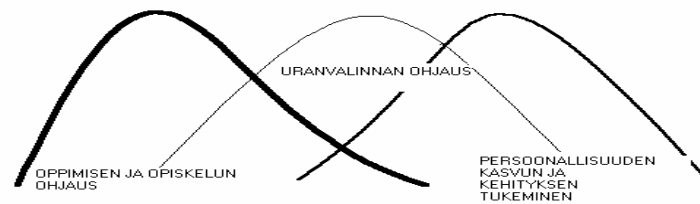
KUVIO 2. Opinto-ohjauksen tavoitealueet (Lerikkanen 2002)

Opinto-ohjauksessa ei voida erotella näitä kolmea tavoitealuetta toisistaan, vaan ne kulkevat ohjauksessa mukana päällekkäin leikaten toisiaan.