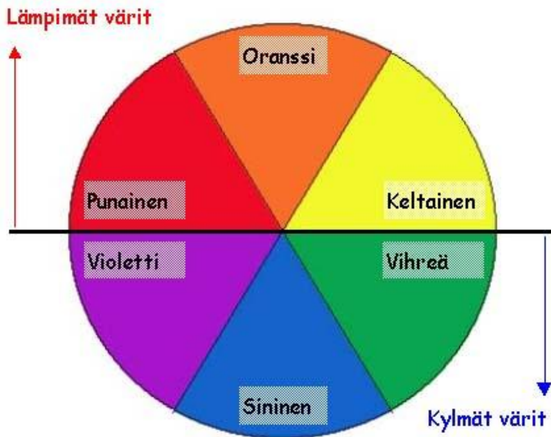
KUVA2. Väriympyrä (Väriympyrä, hakupäivä 23.9.2010)