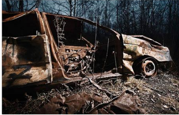
KUVA3. Tunnelman jatkuvuus kuvasarjassa