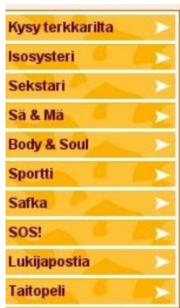
Kuvio 8: Terkkarin päänavigaatio

Päänavigaation kanssa kilpailee sivun ylälaudassa oleva toinen navigointi, joka sekkin on keltaisella pohjalla. Tämä navigointi liittyy osaksi Tervemedian muihin palveluihin ja täten osa linkeistä vie pois Terkkarin sivustolta. Kuitenkin esimerkiksi etusivulla mainostettavaan keskustelupalstaan pääsee vain ylänavigoinnin kautta. Molemmat navigoinnit kilpailevat päänavigoinnin tittelistä, mutta ne ovat ulkoasultaan ja rakenteeltaan hyvin erilaiset. Samankaltaisuuden, läheisyyden ja yhteisen liikkeen lait on kumottu ja lopputulokseksi on saatu sekava navigointikonaisuus, jonka logiikkaa käyttäjä pääsee hahmottamaan vain testaamalla.