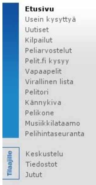
Kuvio 6: Pelit-lehden Internet-sivuston päänavigaatio.

Nuortennetissä päänavigointi on sijoitettu näytön ylälaitaan oikealle (kuvio 7). Vihreällä taustalla oleva navigointi erottuu selkeästi ja se sisältää vain viisi päälinkkiä, mikä on poikkeuksellisen vähän verrattuna muihin esimerkkisivustoihin. Navigointi on selkeä koska päälinkkejä ei ole liikaa ja jokainen linkki kuvaa selkeästi tiettyä aihepiiriä. Kun jotain päänavigoinnin linkkiä klikataan, sivun vasempaan laitaan ilmestyy kyseisen päälinkin alanavigaatio. Alanavigaatio ilmestyy joka sivulla samaan paikkaan ja se noudattaa joka sivulla samaa ulkoasullista teemaa.