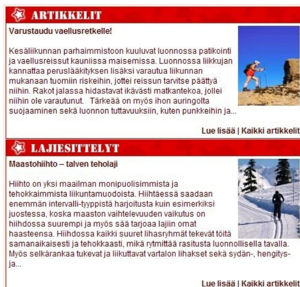
Kuvio 2: Terkkarin kuvat ovat pienikokoisia valokuvia.

Terkkarin sivustolla kuvia käytetään maltillisesti ja ne liittyvät aina kuhunkin esillä olevaan aiheeseen kuten kuvio 2 osoittaa. Kuvat ovat välillä hyvin pienikokoisiakin valokuvia, jotka on valittu havainnollistamaan aiheita mahdollisimman hyvin. Verrattuna Nuortennettiin Terkkarin perinteiset valokuvat eivät kuitenkaan herätä nuorissa samanlaista kiinnostusta kuin piirroskuvat.