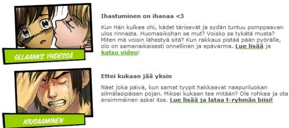
Kuvio 1: Nuortennetin kuvat on tehty havainnollistamaan aiheita.

Nuortennetissä pääosa kuvista on piirrettyjä ja ne liittyvät kaikki vahvasti sivuston teemoihin kuten kuviosta 1 voidaan todeta. Piirroshahmot ovat nuorison keskuudessa suosittuja ja ne ovatkin nuorille suunnatulle sivustolle oiva valinta. Piirroskuvista voi päätellä käsiteltävien aiheiden sisältöä, joten kuvat toimivat hyvin vihjeinä käyttäjille ja nopeuttavat käyttäjien toimintaa.