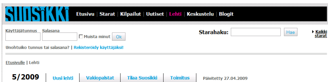
Kuvio 5: Suosikin kaksi navigaatiota.

Suosikin sivuilla päänavigointi on myös sivun ylälaudassa. Suosikin päänavigoinnin tausta on Demin tavoin musta. Linkkitekstit ovat valkoisia ja nykyistä sijaintia havainnollistavan linkin väri on punainen. Musta tausta tekee päänavigoinnista erottuvan ja jo sijaintinsa perusteella se on helppo mieltää navigoinniksi. Tosin esimerkiksi klikkaamalla päänavigoinnista kohtaa ”Lehti” saadaan näkyviin päänavigoinnin lisäksi uusi navigointi, joka näkyy päänavigoinnin kanssa kuviossa 5. Tämä navigointi jää kuitenkin helposti huomaamatta sillä se on sijoitettu liian kauas päänavigoinnista. Tästä johtuen navigointeja ei mielletä yhteenkuuluviksi (läheisyyden laki). Esiin tullut navigaatio ei myöskään noudata ulkoasullisesti eikä tyyliään samaa kaavaa kuin päänavigointi (samanlaisuuden laki).