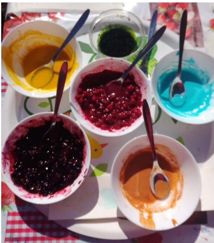
Kuvio 5 Maalit voi korvata luonnon väreillä

Taidetyöskentely: Meillä oli painantaa porkkanan, punajuuren ja leivän avulla. Väreinä hyödynsimme puolukoita, mustaherukoita, kurkumaa, vihreää teetä, paprikajauhetta ja sinistä elintarvikeväriä. Halusimme hyödyntää jotain muuta kuin valmista maalia ja siksi lähdimme pohtimaan, miten voisimme käyttää luonnon omia värejä. Lapset olivat kiinnostuneita ja jakoivat keskittyä hyvin työskentelyyn. He käyttivät monipuolisesti maalaamisvälineitä ja värejä. Osa kokeili painantaa ensin kokeilupaperille, mutta toiset tekivät taidetta heti vesiväri-paperille. Ohjeistus oli selkeää ja lapset ymmärsivät, mitä piti tehdä. Yksi lapsista tarvitsi henkilökohtaista ohjausta voidakseen aloittaa työskentelyn ja edetäkseen seuraavaan työskentelyvaiheeseen.