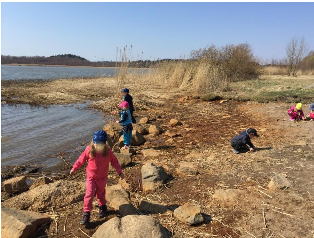
Kuvio 11 Materiaalien keräämistä rannalla

Suunnitellessamme toimintaa rannalle olimme huolissamme siitä, olisiko lapsille tarpeeksi materiaaleja, sillä kevät oli vasta aluillaan. Lapset onneksi löysivät kukkia, oksia, kiviä ja paljon muuta, joten huolemme oli turhaa. Työskentely oli kaikin puolin onnistunutta, tosin joskus lapset lähtivät tutkimaan, mitä muut ryhmät olivat saaneet aikaiseksi. Toisten löytämät hienot materiaalit saivat aikaan pieniä kinasteluja, sillä jokainen olisi halunnut käyttöönsä kukkia. Näissä tilanteissa patistimme lapset pois toisten töiden luota ja autoimme heitä etsimään itselleen kukkia tai jotakin, joilla he korvaisivat kukat. Valmiista töistä tuli muun muassa prinsessalinna ja sen puutarha sekä poliisiasema.