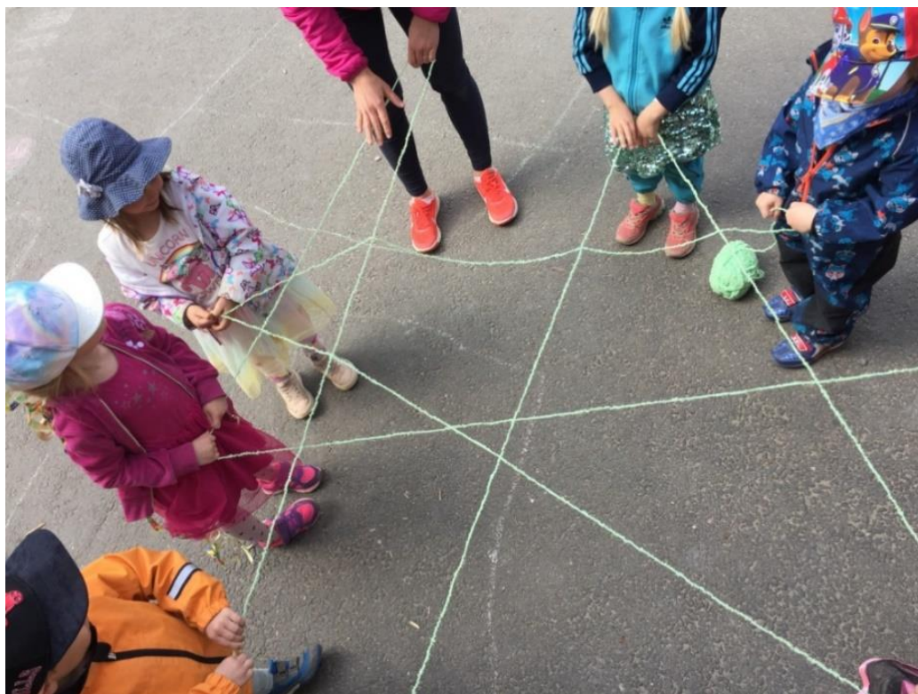
Kuvio 14 Alkuvirittäytyminen lankakerän avulla

että Onnimannin vierailut olivat kaikkein parasta. Lankakerä heitettiin oman vuoron jälkeen aina seuraavalle. Tällä tavalla langasta muodostui väliimme erikoinen kuvio, jota tarkasteltiin yhdessä. Kuvio laskettiin maahan ja se kiinnitettiin teippien avulla asfalttiin. Lapset pohtivat, miltä lanka tuntui ja minkälainen kuvio siitä oli oikein muodostunut.