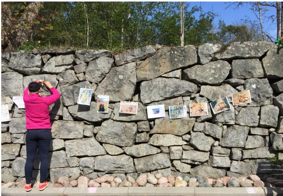
Kuvio 16 Taidenäyttelyn kokoaminen

Kun kaikki työt oli aseteltu paikoilleen taidenäyttelyä varten, kiersimme sen lasten kanssa yhdessä läpi ja keskustelimme taideteoksista, muistelimme kyseessä olevaa Kohtaamistaideker- taa ja kyselimme lapsilta, mitä he muistivat kerrasta. Tämä oli joillekin lapsille vaikeaa ja varsinkin Kohtaamistaidekertojen aikajärjestys aiheutti kinastelua joidenkin välillä.