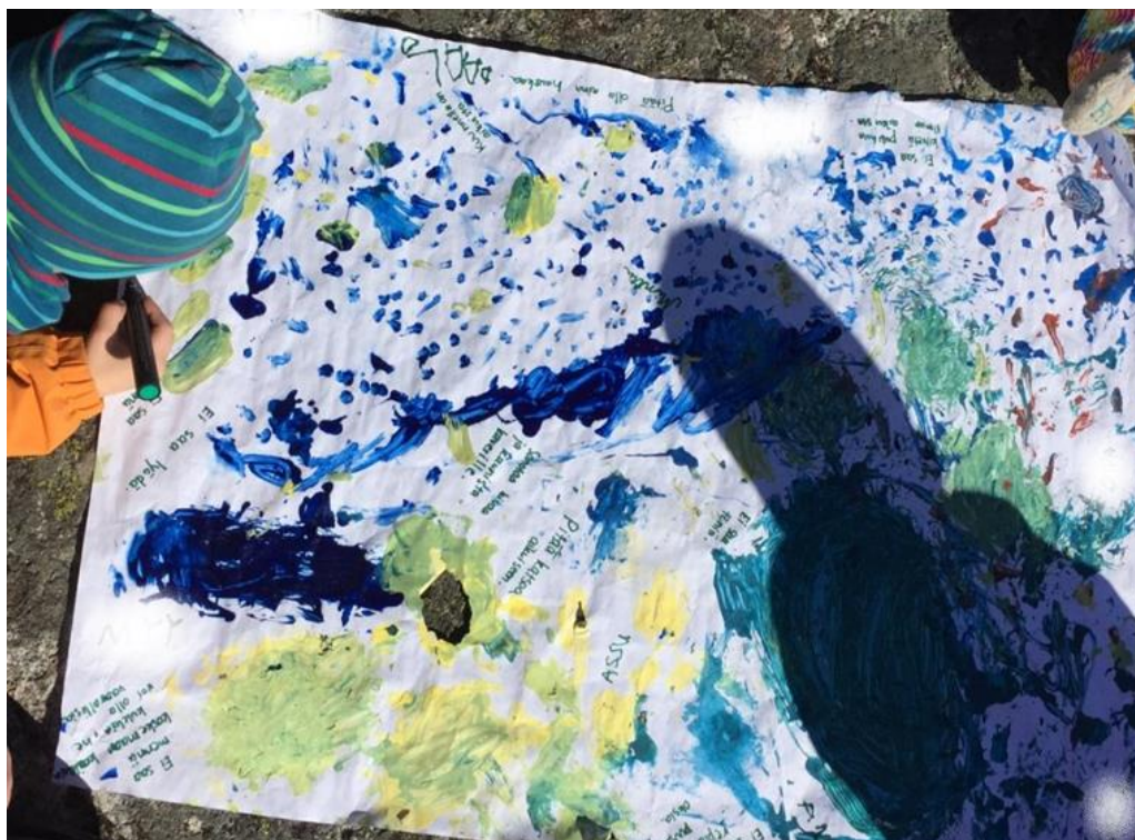
Kuvio 7 Meidän yhteiset sääntömme

Koska tällä kertaa kaikki ryhmäläiset olivat paikalla, päätimme käydä läpi Kohtaamistaideryhmän säännöt. Lapset kertoivat aktiivisesti, millaisia sääntöjä metsässä ollessa tulee noudattaa. Myös aikaisemmin passiiviset lapset olivat mukana keskustelussa. Kiinnitimme huomiota siihen, kuinka moni lapsista luetteli kielto-tyyppisiä sääntöjä. Jouduimme ehdottamaan heille, että he keksisivät myös, mitä ryhmässä saa tehdä. Kirjoitimme lasten keksimät säännöt ensimmäisellä kerralla tehdyille yhteiselle taideteokselle, johon jokainen sai lisätä oman allekirjoituksensa. Monet lapset tiesivät jo valmiiksi, ettei puusta saa repiä oksia tai lehtiä, eikä mitään voi rikkoa.