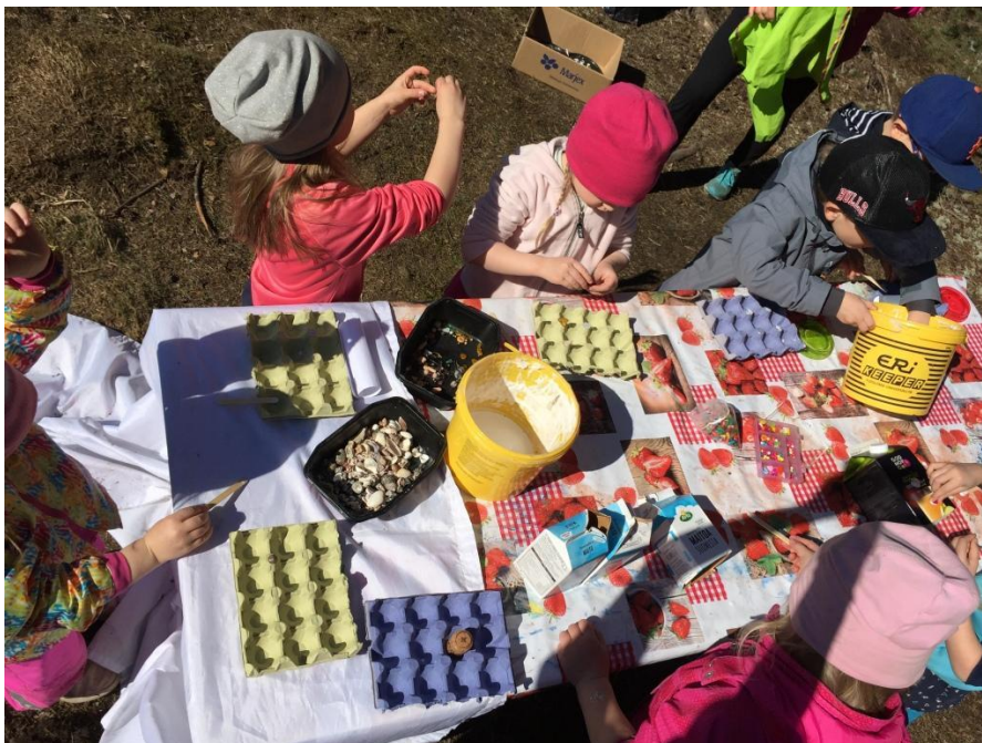
Kuvio 10 Kierrätysmateriaaleista askartelua

Arvostus: Paikalla oli kaikki kahdeksan lasta, joten jakauduimme taas kahteen ryhmään arvostusta varten. Tällä kertaa lapset tiesivät jo mitä piti tehdä, joten he arvostivat töitä ilman aikuisen kysymyksiä. Keskustelua kuitenkin piti ohjailla niin, ettei se lähtenyt pois raiteiltaan. Lapset kertoivat taas kauniita asioita toisten taideteoksista, mikä ilahdutti taideteosten tekijöitä. Kun arvostimme erään tytön teosta, hän esitti itse tarkentavia kysymyksiä, esimerkiksi: “Mikä muu kohta oli hieno?” ja “Entäs toi sitten?”.