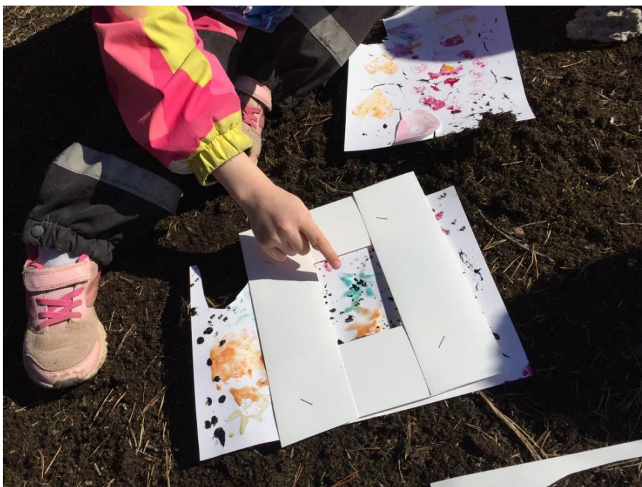
Kuvio 6 “Kato, miten hieno!”

Arvostus: Keräännymme yhteen arvostamaan toisten töitä. Jokainen sai arvostaa toisen työtä ja kertoa mikä kohta siinä oli kivoin. Käytimme apuna kehystä, jolla rajasimme työstä mielenkiintoisimman kohdan. Lapsi sai rajauksen jälkeen kertoa, miksi valitsi juuri kyseisen kohdan. Huomasimme, että lapset helposti matkivat toistensa sanomisia, joten arvostuskierroksen kommentit jäivät varsin yksipuolisiksi. Jokainen sai myös omalla vuorollaan kertoa, miltä oma työ maistuisi. Monet sanoivat valmiiden teosten maistuvan jauhoilta, varmastikin siksi, että olimme käyttäneet jauhoja värien sekoittamiseen. Tämä oli jäänyt lapsille mieleen virittäytymisessä värejä maistaessa.