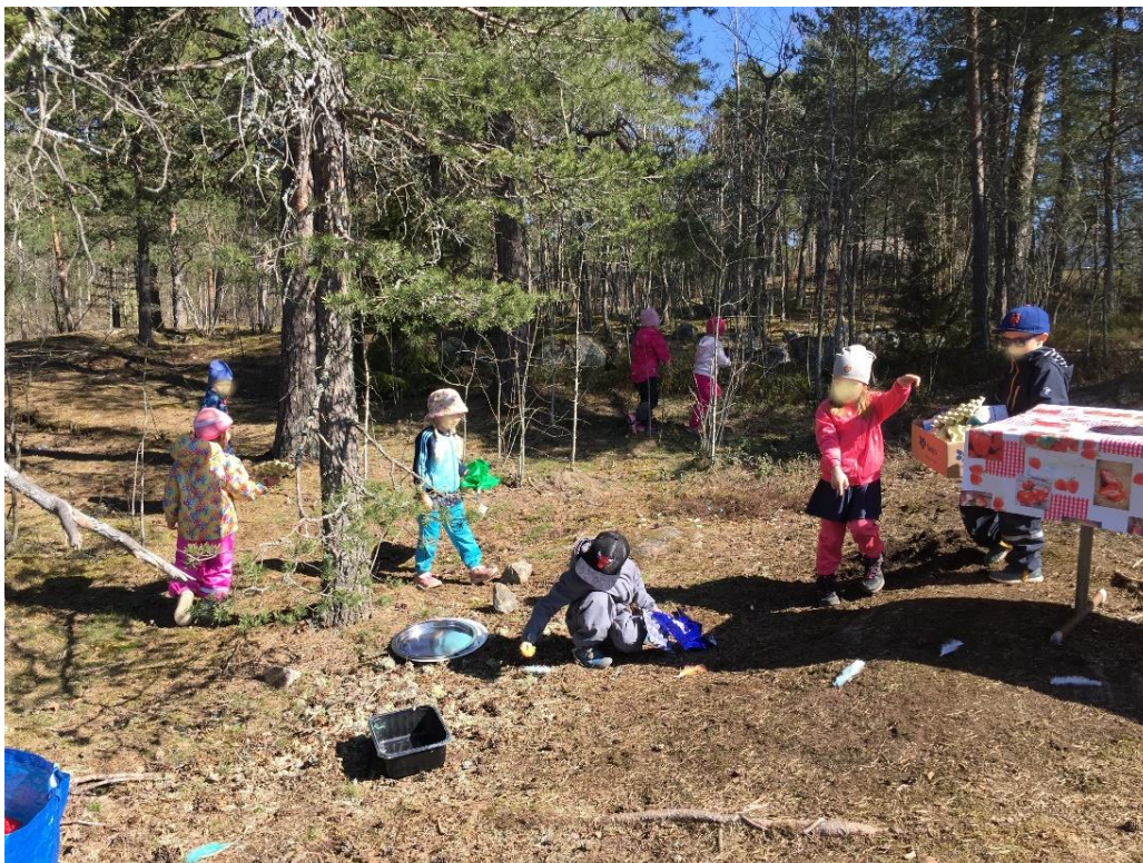
Kuvio 9 Lapset keräävät roskaa pois luonnosta

Taidetyöskentely: Emme antaneet erikseen ohjeita siitä, mitä pitäisi tehdä. Tarkoituksena oli antaa lapsille vapaat kädet tarjoamiemme materiaalien kanssa. Ehdotimme välillä eri materiaaleja, sillä ne olivat eri puolilla pöytää ja kaikki lapset eivät välttämättä nähneet niitä. Osa materiaalista oli vaikea kiinnittää, kuten simpukat ja helmet, joten kun olimme valmiita, ohjaaja kävi vielä kuumaliimaamassa nämä kohdat paikalleen, jotta ne eivät irtoaisi valmiista töistä.