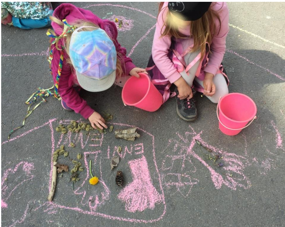
Kuvio 15 Katuliitutaide-teos

Arvostus: Kun työt olivat valmiit, asetuimme piiriin katselemaan ja arvostamaan niitä. Jokainen sai vuorollaan kertoa omasta työstään ja miltä sen tekeminen tuntui. Muut saivat kommentoida halutessaan toisen työtä. Lapset olivat tässä vaiheessa jo varsin rauhattomia, sillä heitä jännitti taidenäyttelyn järjestäminen. Teimme arvostuskierroksesta lyhyen, jotta pääsimme siirtymään seuraavaan vaiheeseen.