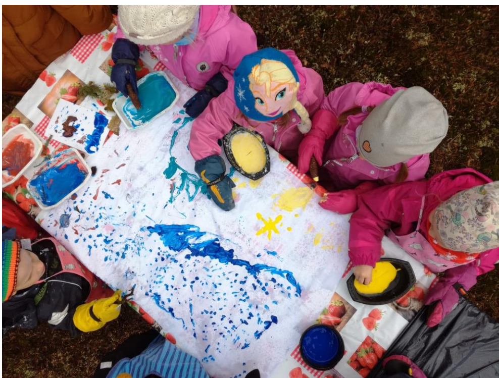
Kuvio 4 Yhteistä taideteosta tekemässä

Annoimme lapsille metsästä löytämiämme käpyjä, kaarnaa, keppejä ja sammalta, joita he saivat käyttää pensselien sijasta. Lapset hämmästelivät tätä, mutta ryhtyivät maalaamaan innolla. Kaikki keskittyivät maalaamiseen hienosti koko työskentelyn ajan. Välillä kehotimme heitä vaihtamaan ”pensseliä” tai väriä. Väriä vaihtaessa lasten käyttämät maalit sekoittuivat toisiinsa luoden uusia värejä. Tämä saattoikin olla koko taidetyöskentelyn kiinnostavin osuus. Lapset ymmärsivät ohjeita ja keskustelivat toistensa ja ohjaajien kanssa avointa keskustelua kaikesta mahdollisesta. Ohjaajat kannustivat ja kehuivat lapsia.