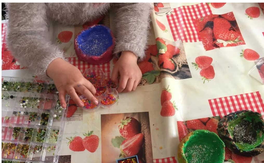
Kuvio 13 Ruukkujen koristelua

Tälle kerralle mukaan ottamamme liima oli varsin huonoa. Liimaa ei ollut enää paljon jäljellä, joten joku päiväkodissa oli yrittänyt laimentaa sitä. Tästä seurasi se, että helmet eivät tarttuneet lasten töihin kunnolla. Jouduimme tekemään hätäratkaisun ja siirtymään sisälle kuumaliimaa käyttämään. Aikuiset laittoivat kuumaliiman lasten osoittamiin paikkoihin ruukussa ja liimasivat helmet niihin. Osa lapsista halusi itse laittaa helmet kiinni, ja annoimme heidän tehdä sen.