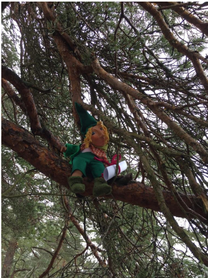
Kuvio 3 Onnimanni puussa

Seuraavaksi kerroimme lapsille, että näimme jonkun omituisen hahmon istuvan puussa. Lapset lähtivät katsomaan, kuka puussa oikein oli. Heidän yllätyksekseen puun oksalla istui päiväkodin Onnimanni-nukke kirje kädessään.