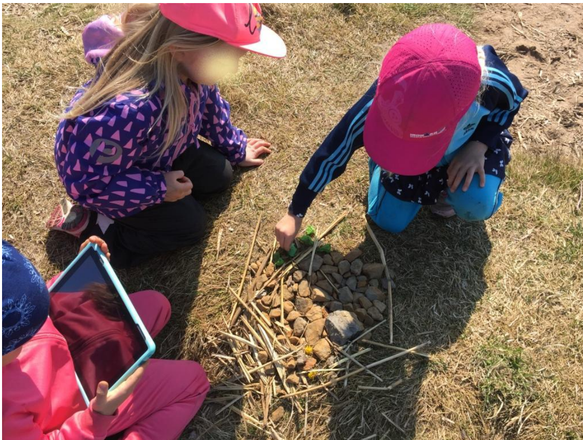
Kuvio 12 Arvostuksessa käytimme apuna tabletteja

Pohdinta: Tuuli oli aikaisemmillä kerroilla häirinnyt työskentelyämme, joten odotimme, että sama tapahtuisi rannallakin. Onneksi käyttämämme materiaalit olivat sen verran painavia, että tuuli ei päässyt siirtelemään niitä. Ainoastaan lasten keräämä irrallinen ruoho lensi pois. Lapsista oli kiinnostava ottaa kuvia tableteilla. He saivat itse päättää, mihin asetella kehykset ja millä tavalla ottaa kuvat. Kirkas auringonpaiste tosin hankaloitti tablettien käyttöä, sillä näyttöä oli vaikea nähdä välillä. Lapset eivät olleet tottuneet ottamaan kuvia tableteilla, joten jouduimme näyttämään heille, miten kuvia otetaan.