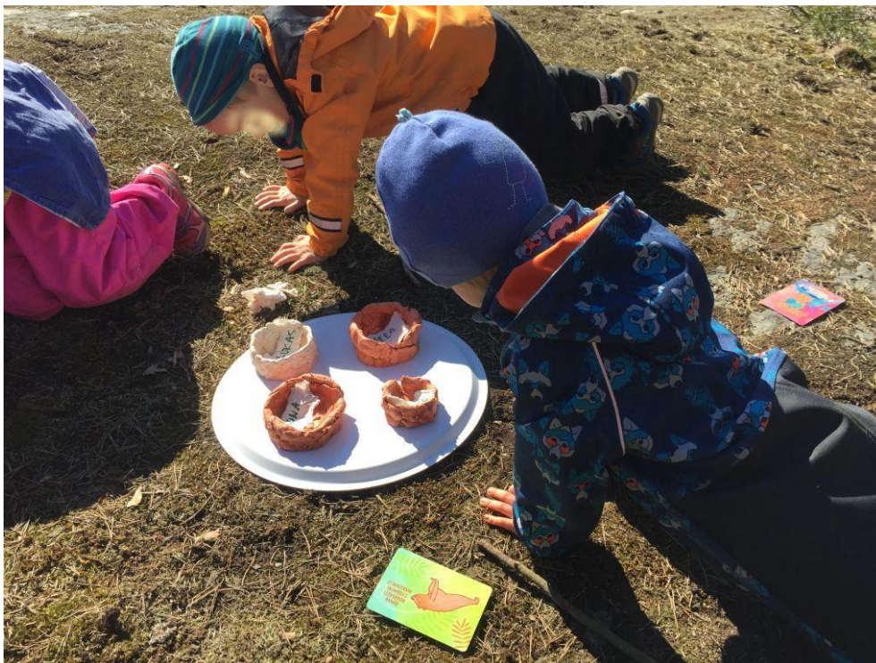
Kuvio 8 Arvostus eläinjoogakorttien avulla

Pohdinta: Me ohjaajat jouduimme auttamaan lapsia uusien palojen lisäämisessä, jotta ruukuista saisi hieman isommat. Ruukkujen ohuiden seinämien ja niissä olevien reikien takia pelkäsimme, että ne menisivät rikki. Lapset itse eivät osanneet kiinnittää huomiota ruukuissa oleviin reikiin tai halkeamiin, joten me ohjaajat korjailimme joitakin valmiita töitä. Pohdimme, onko oikein, että me korjaamme töitä, jos lapset olivat kuitenkin itse niihin täysin tyytyväisiä. Päädyimme siihen, että työt saavat olla juuri tekijöiden itsensä näköisiä, vaikka ne eivät lopulta kestäisi maalaamista tai multaa. Kohtaamistaiteen eettisissä periaatteissa (2019) mainitaan, että osallistujien omat esteettiset valinnat ovat tärkeitä ja jokaisen tulee päästä haluamaansa lopputulokseen. Vaikka me olisimme aikuisina halunneet korjailta lasten tekemiä savitöihin, on Kohtaamistaiteen ohjaajan muistettava, että asiakkaan työ on hänen omansa.