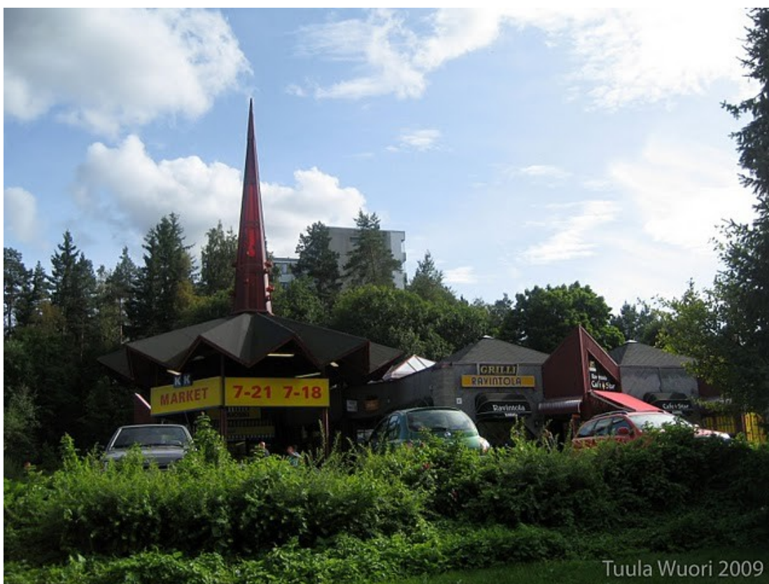
Kuva 5 Joutjärven kauppakeskus

Tonttilan läheisyydessä on kaksi (2) alle kilometrin päässä toisistaan olevaa palvelukeskusta. Ne ovat Tenava-Tonttilan ostoskeskus sekä Joutjärven kauppakeskus. Tonttilassa on kolme (3) parturi-kampaamo, R-kioski, kolme (3) ruokakauppaa, jotka ovat S-market, K-market ja Siwa. Alueelta löytyy myös muutama ravintola, tanssikoulu ja lastenkoti. Tonttilasta on hyvät bussiyhteydet Lahden keskusta.