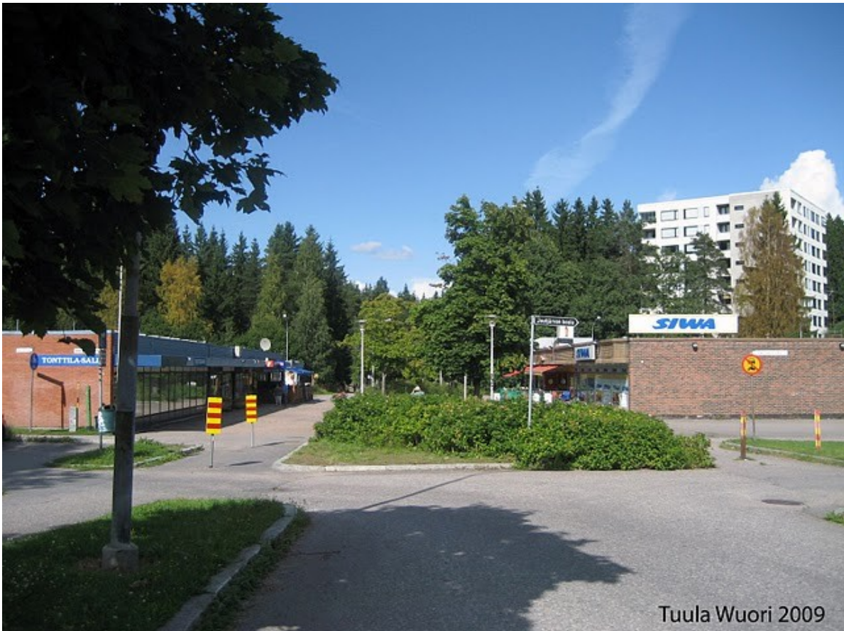
Kuva 1: Tenava- Tonttilan ostoskeskus, Tuula Wuori 2009

”Elinvoimaisten ja omavaraisten kaupunginosien sijaan lähiöistä tuli nukkumapaikkoja. Suurin osa väestöstä hankkii leipänsä muualla kuin lähiöissä ja tekee ostoksensakin tyypillisesti jossakin supermarkettissa alueen ulkopuolella. Tiiviin rakentamisen kautta kaavailtu kontakti verkosto ei toiminut kuvitellulla tavalla. Sen sijaan ilmeni monenlaisia sosiaalisia ongelmia.” (Erat & Luoma 1992: 6).