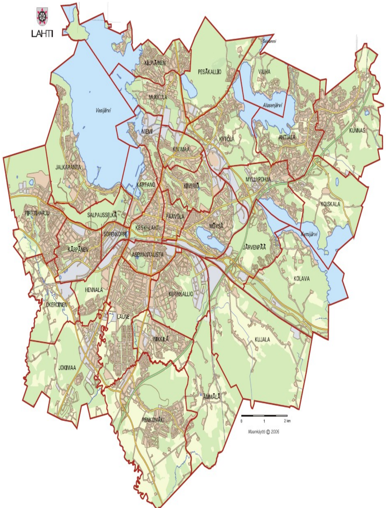
Kuva 3 Lahden kaupunginosat (2006)