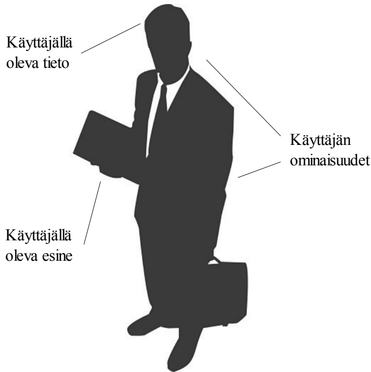
KUVIO 1. Todennuksen perusteet

Ensimmäinen kategoria on tieto. Tarkemmin määriteltynä salainen tieto, joka on vain todennettavan ja todentajan tiedossa. Tietoteknisissä yhteyksissä yleisin todennustapa on salasana ja tähän periaatteeseen myös Kerberosin toiminta perustuu. Yleisesti tietojärjestelmään ensin tunnistaudutaan antamalla käyttäjänimi, joka usein voi käytännössä katsoen olla yleistä tietoa. Siksi todennus tapahtuu tunnukseen liitetyllä salasanalla. Salasanojen käyttö on suosittua, koska se on helppoa ja halpaa. Niiden käyttäminen poistaa kalliit investointitarpeet avaimiin tai tunnistuskortteihin ja niiden lukkoihin ja lukulaitteisiin. (Järvinen 2003, 35.) Nämä lienevät tärkeimmät syyt siihen miksi salasanaja käytetään kaikkialla, myös Kerberosin todennusprosesseissa.