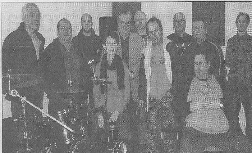
Tässä he ovat: Vuoden 2009 K-60-bändien jäsenet. Tutustu jäseniin tarkemmin netissä www.kaupunkilehti.fi .

Kitaristeja ja laulajia sekä harrasteita löytyi innokkaasta eläkeläisporukasta useampikin, mutta rumpalit ja basistit olivat