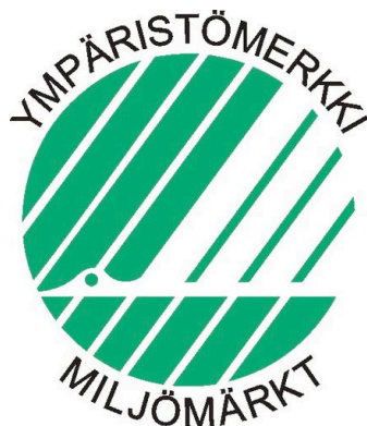
Kuva 5. Joutsenmerkki

Kestävän kehityksen edistäminen tarkoittaa, että tuotteiden valmistajat ottavat vastuuta ympäristöstä ja kehittävät ympäristön kannalta parempia tuotteita. (Tee vastuullisia valintoja -esite.) Merkki opastaa kuluttajia valitsemaan ympäristön kannalta parempia tuotteita ja kannustaa valmistajia tekemään tällaisia tuotteita. Viime vuosina Joutsenmerkki on laajentunut myös palveluihin, kuten esimerkiksi hotelleihin ja ravintoloihin (SFS-ympäristömerkinnän www-sivut . 2010). Joutsenmerkin avulla kuluttajat pystyvät tunnistamaan tällaiset tuotteet ja lisäämään ympäristömyötäisten tuotteiden kysyntää. Jokainen voi omalla toiminnallaan vaikuttaa ympäristön tilaan tekemällä ympäristöystävällisiä valintoja. Joutsenmerkin avulla näiden valintojen tekeminen helpottuu. (Tee vastuullisia valintoja -esite.)