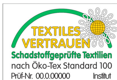
Kuva 2. ÖKÖ-Tex 100-merkki