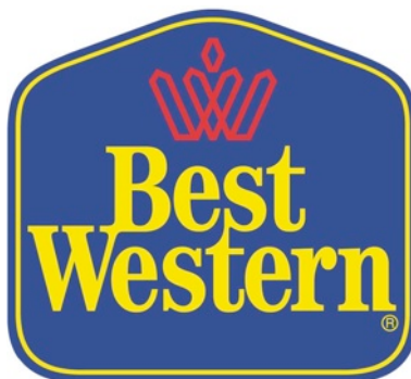
Kuva 4. Best Western logo

Kunniakkaat perinteet omaava, funkistyylinen rakennus on peruskorjattu 2000-luvulla. Kaikki hotellihuoneet uudistettiin v. 2003-2005 ja hotellin yleiset tilat v. 2005.