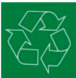
Kuva 1. Kierrätysmerkki

Virallisia ympäristömerkkejä Joutsenmerkin lisäksi on Euroopan Unionin ympäristömerkki – Ekotuotemerkki, ns. EU-kukka, joka on tunnettu koko EU:n alueella. Tekstiilejä voidaan merkitä omalla ÖKÖ-Tex100-merkinnällä, joka tarkoittaa ettei valmistuksessa käytetä haitallisia aineita. Lisäksi on olemassa kierrätysmerkki, joka on myös koko EU:n alueella tunnettu. (Liesimaa 1995, 16-27.)