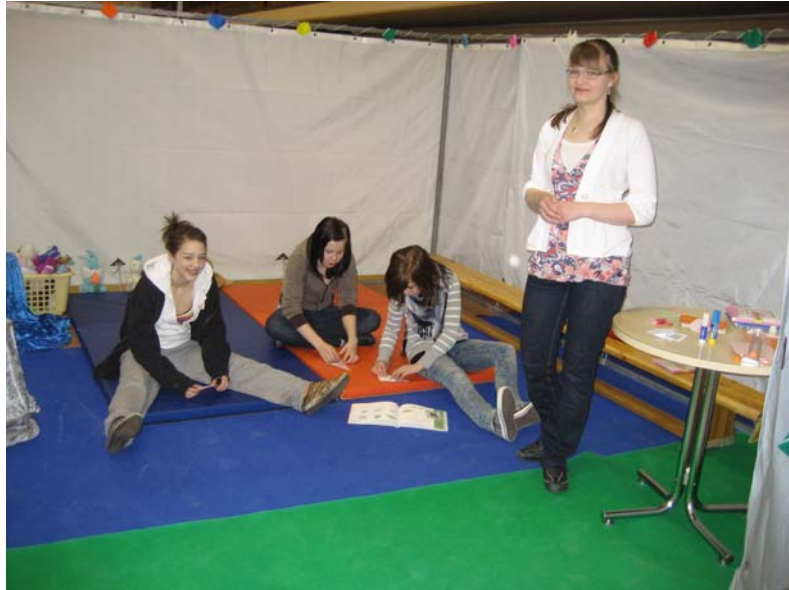
KUVA 6: Äitienpäiväkorttipiste