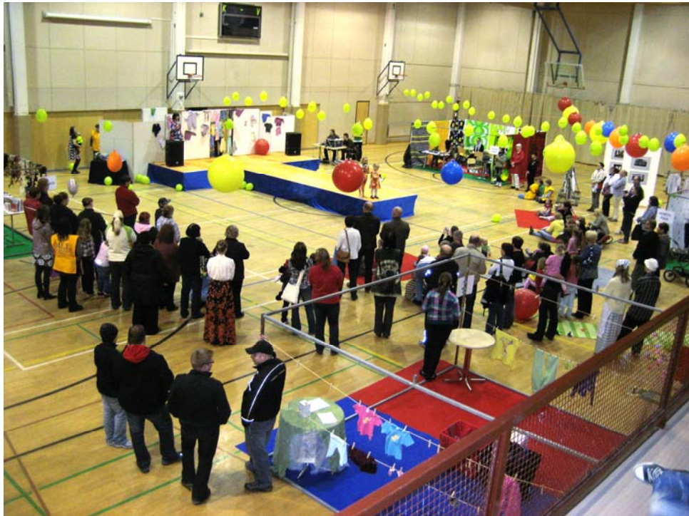
KUVA 1: Yleiskuva pääsalista