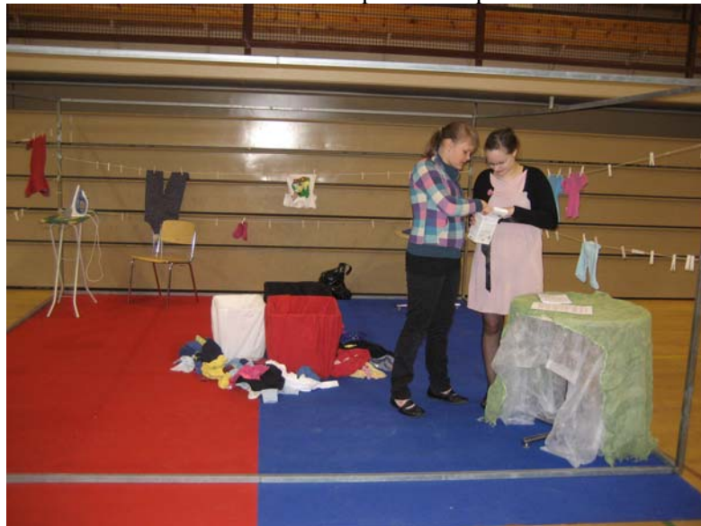
KUVA 7: Vaatehuoltopiste