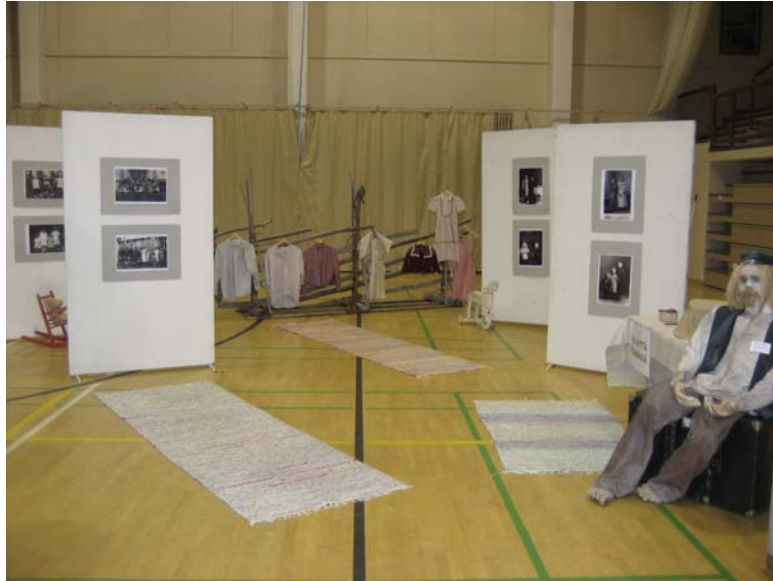
KUVA 3: Mennyttä etsimässä -piste