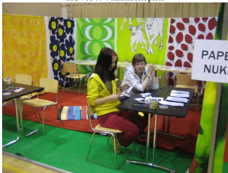
KUVA 8: Paperinukkepieste