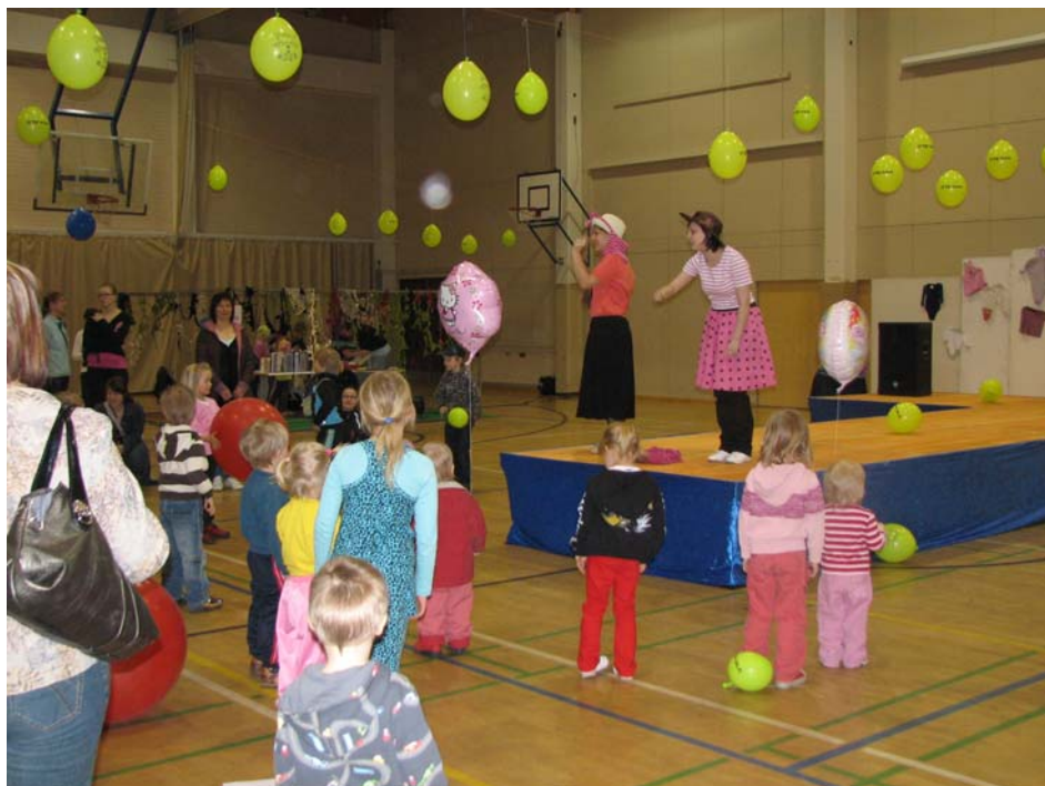
KUVA 2: Laululeikkituokio