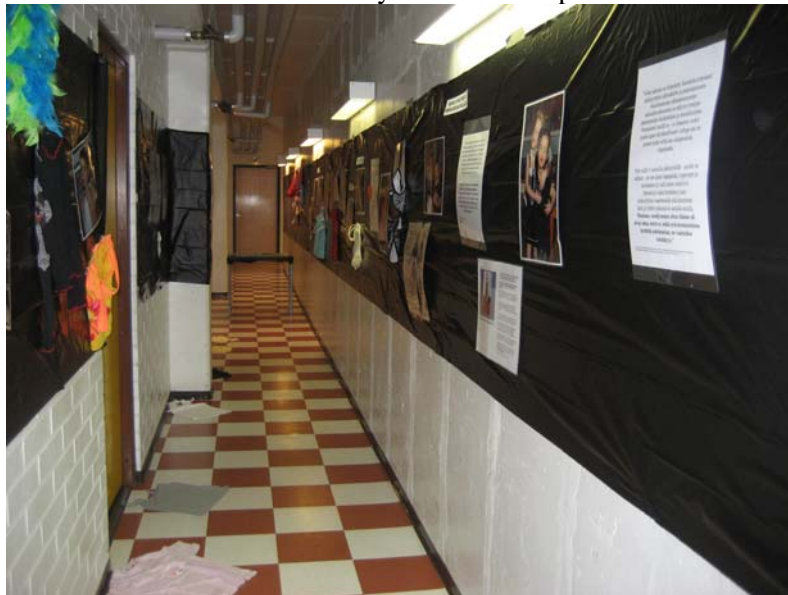
KUVA 4: K18-piste