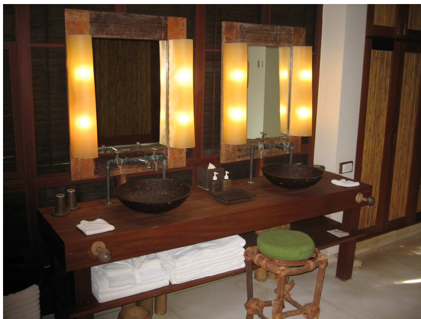
Kuva 8. Six Senses Hideaway-hotellihuoneen kylpyhuone.

Six Senses Hideaway Samui- hotelli, Art Café ja TK Tour olivat kaikki päällisin puolintehty ympäristöystävällisistä materiaaleista. Sisustuksessa Six Senses ja Art Café olivat käyttäneet pääosin luonnon omia materiaaleja, kuten puuta, bambua ja savea. TK Tour käyttää paikallista pitkähäntä venettä, joka on suurimmaksi osaksi puuta (Liite 1, 44; Liite 2, 44).