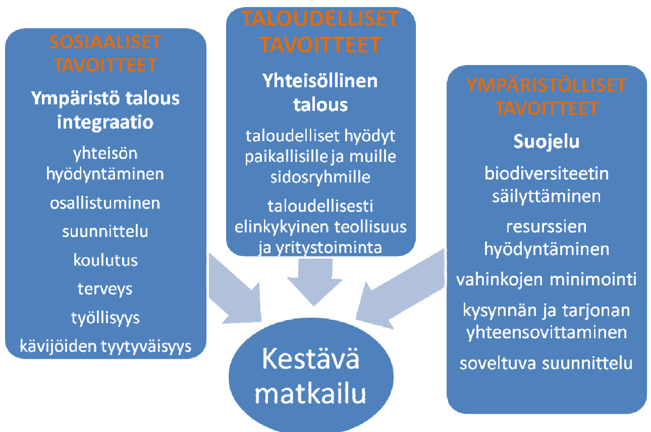
Kaavio1.Kestävänmatkailun arvot ja periaatteet( Saارين, Järviluoma 2002, 141)

Kestävässä matkailussa tähdätään luonnonvarojen optimaaliseen käyttöön samalla säilyttäen ja suojellen luontoa ja sen monimuotoisuutta. Kohdealueen paikallisia tapoja ja perinteitä suojellaan ja kunnioitetaan, mutta myös edesautetaan kulttuurien välistä yhteisymmärrystä. On muokattava alueentaloudesta luotettava, joka pystyy pitkällä aikavälillä tarjoamaan alueen väestölle pysyviä työllistymis- ja palvelumahdollisuuksia ja näin poistaen alueen köyhyyttä (UNEP, 2011).