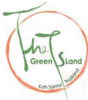
Kuva 7. The Green Island project (Green Island Project, 2010)

Osana TAT:in strategiaa se on perustanut The Green Island projektin, jonka tarkoituksena on muokata saaresta luonto- ja ihmisystävällisempi. Projektin tarkoituksena on pitkällä aikavälillä muokata Koh Samuista kestävä matkailun kohde. Projektin aloitettiin vuonna 2007.