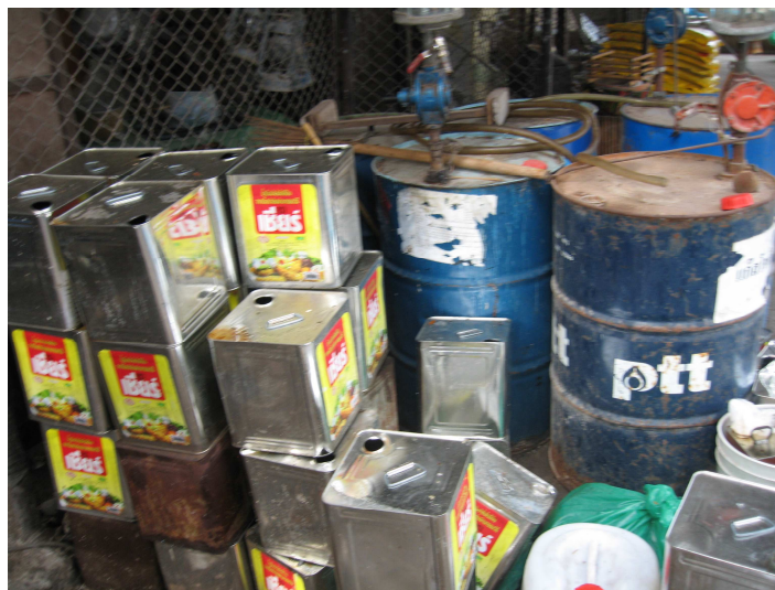
Kuva 9. Six Senses Hideawayn biodieselprojekti.

Myös fossiiliset polttoaineet ovat mahdollisemman huonoja ympäristön kannalta. Tulisi panostaa uusiutuviin luonnonvaroihin, kuten tuuli- tai vesisähköön. Six senses Hideaway Koh Samui-hotellin alueelta löytyi oma biodieseltehdas. Biodieseliä valmistetaan hotellin ravintolan jätteistä ja hotellin alueella kasvavasta pähkinästä. Osa hotellin moottoripyöristä ja autoista toimi hotellin omalla biodieselillä. TK Tourin käyttämän pitkähäntä veneen polttoaineen laatua ei saatu selville (Liite 1, 44).