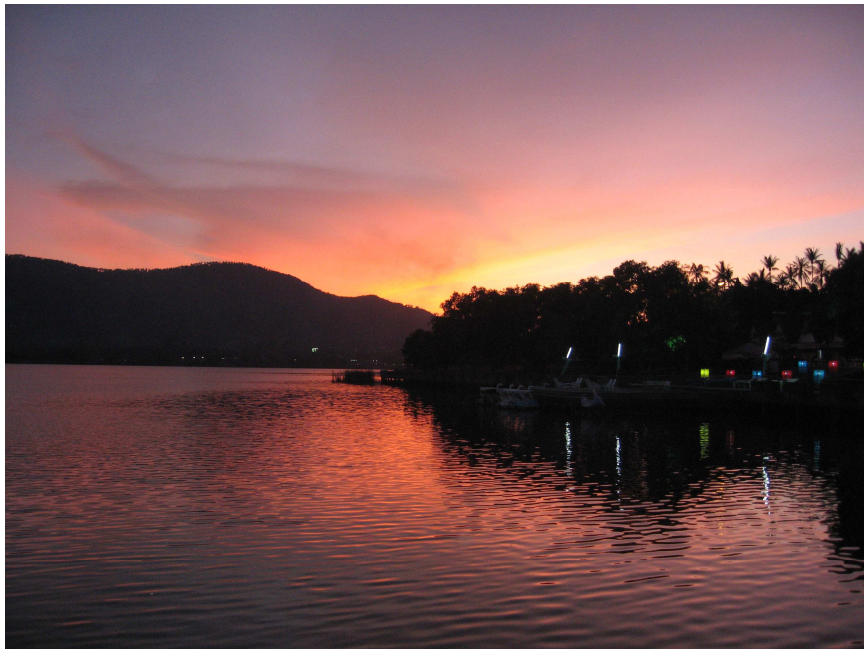
Kuva2. Auringonlasku Chawengjärvellä

hiekkarantaa vaan rantojen väliin työntyy kallioita saaren keskiosasta. Vuorien juurelta rantaan on paikoitellen vain muutamia sato ja metrejä, joten suuremmat kyläkeskukset ovat muodostuneet leveimillä rantakai stoille ,jotka ovat hieman kauempanavuorenjyrkistäseinämistä. BanChawengis talöytyymyöskaksijärveä ja saaren keskiosista useita vesiputouksia ja pieni ä jokia. Saaren eteläosa on suurimmaksi osaksi tasaista ja sieltä löytyvätkin Koh Samuun alueet, missä viljely on mahdollista (Cummings 2005, 556).