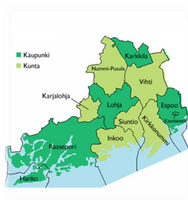
Kuva 1: Espoon yhdyskuntaseuraamustoimiston toimialueen kartta

Espeen yhdyskuntaseuraamustoimisto vastaa yhdyskuntaseuraamusten täytäntöönpanosta muiden yhdyskuntaseuraamustoimistojen tavoin. Yhdyskuntaseuraamuksia ovat ehdollisen vankeuden ja ehdonalaisen vapauden valvonta, yhdyskuntapalvelu ja nuorisorangeistus. (Yhdyskuntaseuraamukset 2011.) Espoon yhdyskuntaseuraamustoimiston asiakkaat asioivat pääasiassa toimistolla Espoossa, mutta alueen laajuuden vuoksi on Hankoon ja Lohjalle otettu käyttöön sivutoimipisteet, jonne työntekijät matkustavat asiakasmääristä ja resursseista riippuen kerrasta kahteen kertaan viikossa. Tarve sivutoimipisteille syntyi muun muassa Kriminaalihuoltolaitoksen Lohjan paikallistoimiston lakkautettua vuonna 2004 (Historia 2011).