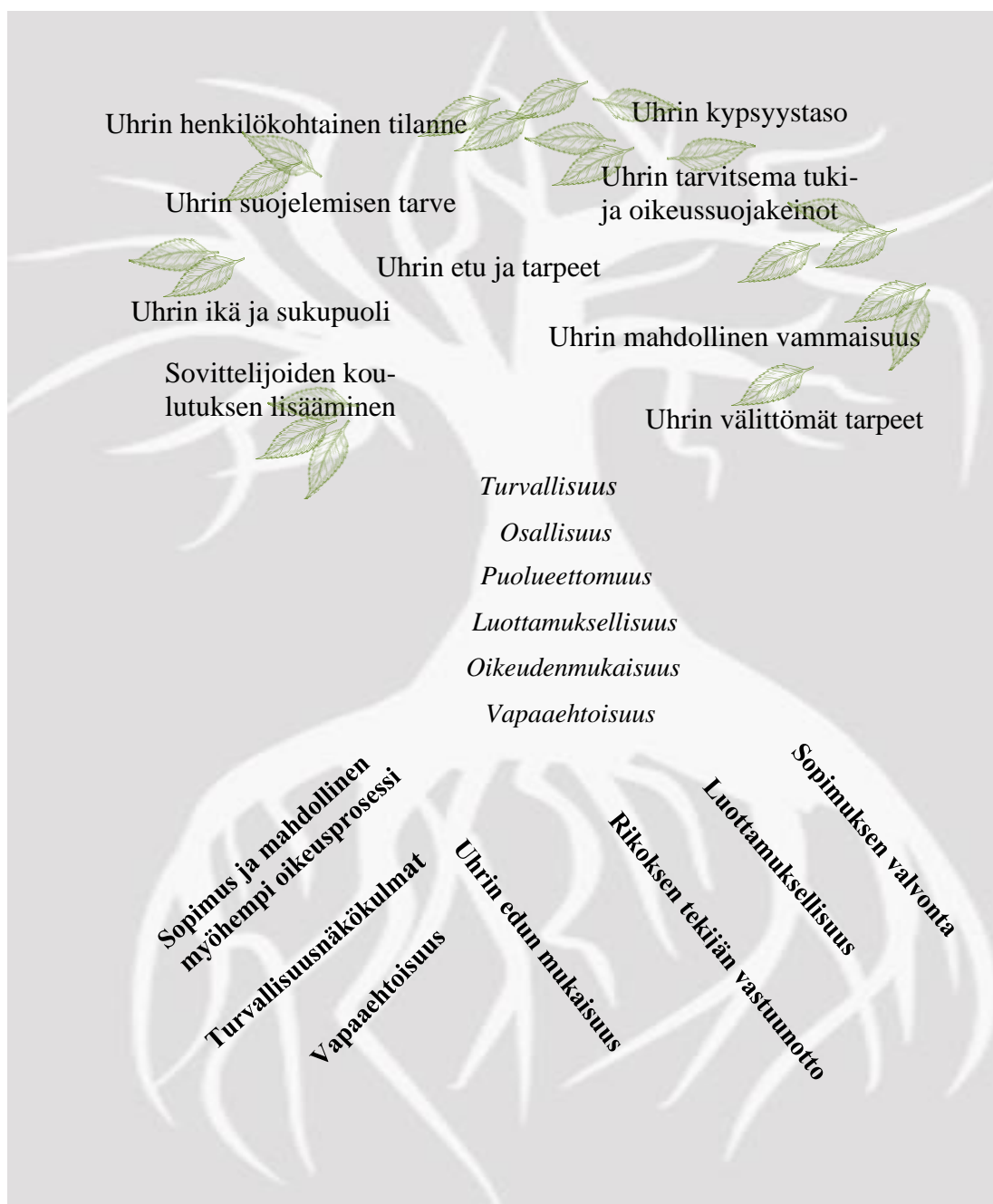
Kuva 1. Uhridirektiivin vaatimusten täyttymisen kannalta huomioitavia seikkoja uhrin kanssa toimimisessa. (Asioiden lähteet: Uhridirektiivi 2012/29/EU, Sovittelulaki 1015/2005, Flinck 2013, 18).

Kuvainnollisesti asian voi esittää esimerkiksi emokoivuna (Kuva 1), minkä perusta ovat juuret (uhridirektiivin vaatimukset). Juurista kasvaa runko (sovittelun periaatteet), josta taasen oksasto (asiakaskohtaamisessa huomioitava) levittäytyy eri haarioineen. Vahvana, tukevana ja viisaana se luo kasvupohjaa myös muulle ympäristölle.