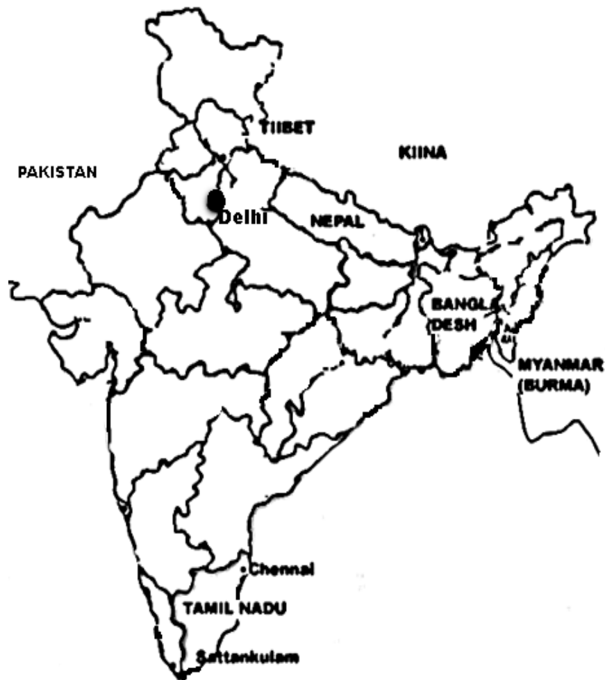
KUVIO 1: Intian kartta. Pääkaupungista Delhistä on 2095 kilometrin matka Tamil Nadun osavaltion pääkaupunkiin Chennaihin. Chennaista Sattankulamin maakuntaan on vielä noin 600 kilometriä.

junalla ja erinäisillä muilla välineillä yli 2500 kilometriä. Olen käynyt Tamil Nadun osavaltiossa aikaisemmin, mutta en osaa tamilin kieltä lainkaan, eikä alueen kulttuuri ole minulle yhtä tuttua kuin Pohjois-Intian. Koska olin Intiassa viidettä kertaa, päätin vihdoin opetella käyttämään paikallisbusseja. Se olikin välttämätöntä, sillä asuntoni Delhissä sijaitsi melko syrjässä. Harjoittelun aikana suorittamani tutkimusretket eri yhteisöihin suuntautuivat eri puolille laajaa kaupunkia. Kun ensimmäisen viikon jälkeen aloin hahmottaa kaupunkia uudella tavalla, pystyin liikkumaan yksin usealla liikennevälineellä ja pystyin kommunikoimaan rajallisesti myös hindiksi, koin suunnatonta tyydytystä.