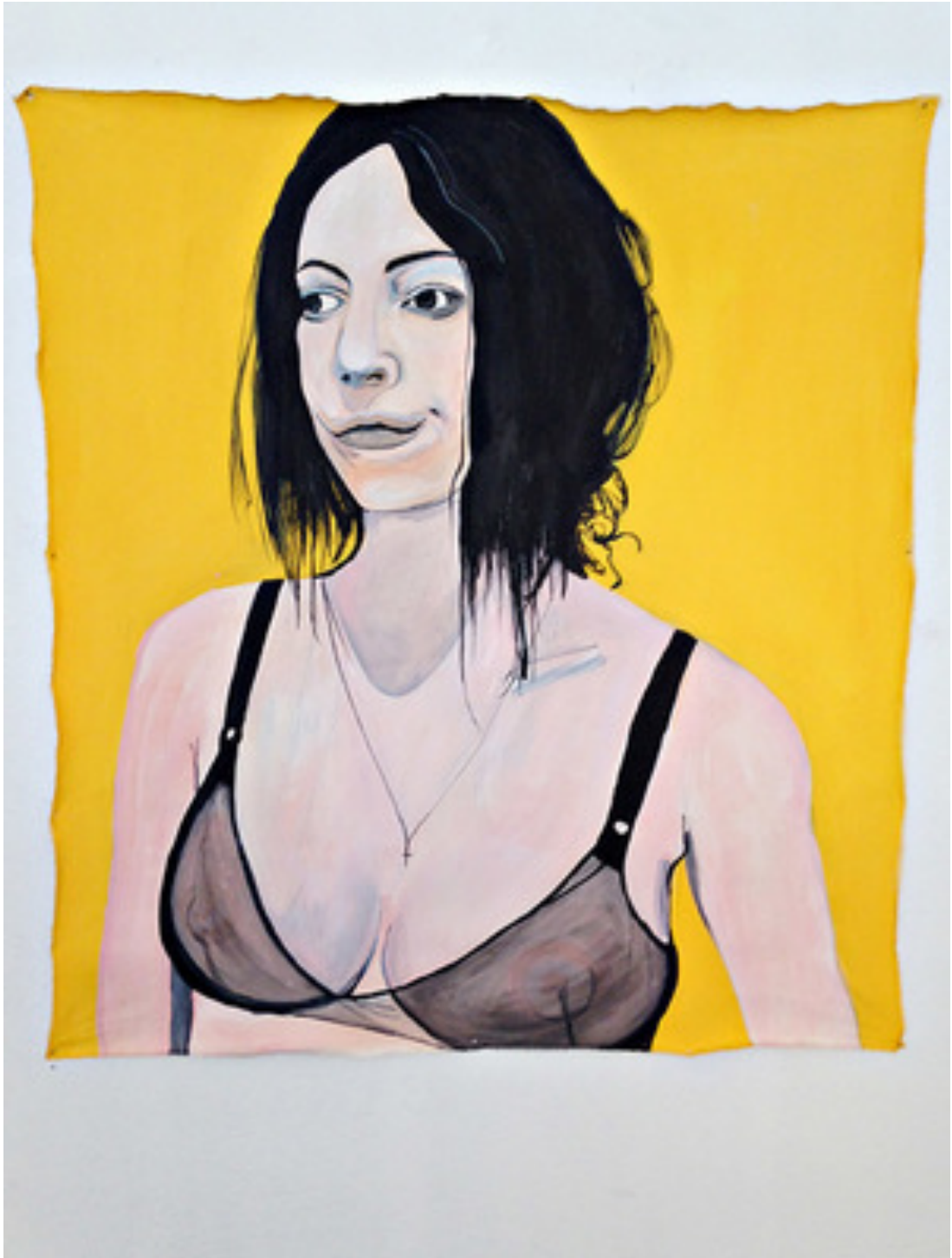
Kuva 3. Laura Kopio: Aatami, 152 x 107 cm, 2014, akryyli ja öljy kankaalle.