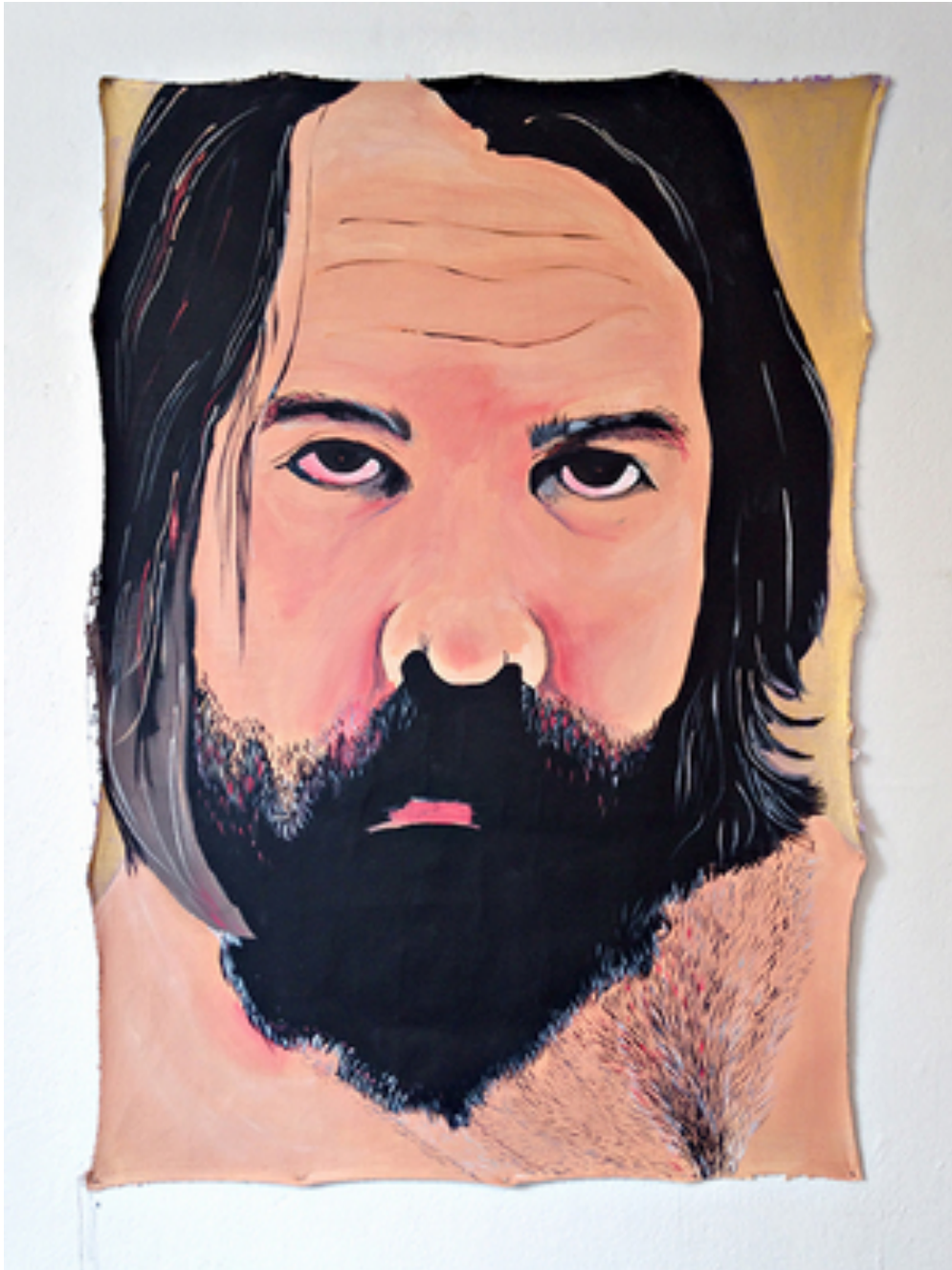
Kuva 4. Laura Kopio: Mies, 142 x 107 cm, 2014, akryyli ja öljy kankaalle.