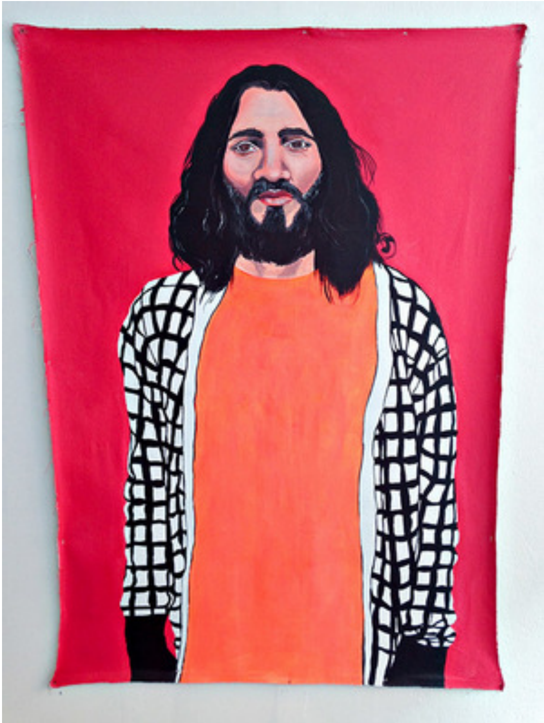
Kuva 2. Laura Kopio: Jaakoppi, 142 x 107 cm, 2014 akryyli ja öljy kankaalle.