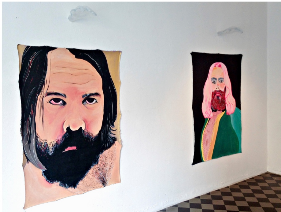
Kuva 6. Laura Kopio: Siunaavat kädet, 2014, läpinäkyvä polyuretaanimuovi.

Taiteellisessa osuudessa maalausten rinnalla oli myös kolme muovista siunaavassa asennossa olevaa onttoa kättä, jotka oli asetettu vain kolmen maalauksen päälle. Seinästä ulos tuleva siunaava käsi. Näiden veistosten merkitys oli tyhjyydessä, onttoudessa, läpinäkyvyydessä ja siunaavassa asennossa ja materiaalissa eli muovissa. Muovi on keinotekoisia, läpinäkyvää ja sitä voidaan käyttää mihin tarkoituksiin tahansa. Samalla se on metafora pinnallisuudelle ja teolliselle yhteiskunnalle. Tämä symbolinen muovinen Jumalan käsi suojelee kaikkia, eli muokkaa meitä itsensä teollisen kulttuurin kaltaiseksi (Horkheimer & Adorno 2008, 35)