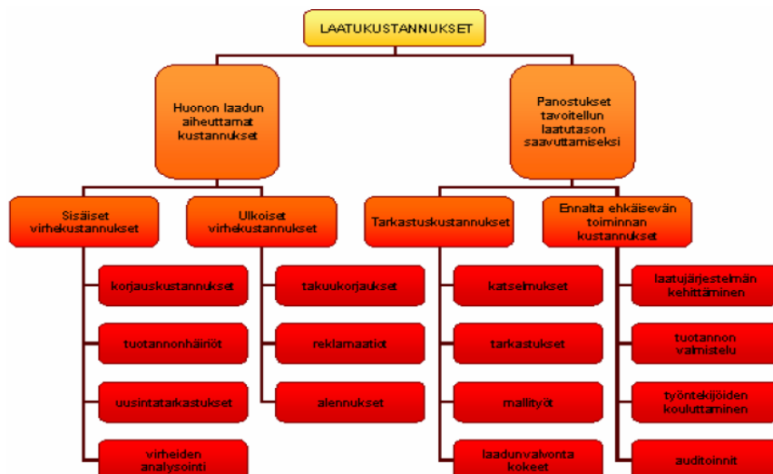
Kuva 1: Erilaiset laatukustannukset on kuvattu ryhmittäin./5/

Kuvassa 1 olevaa mallia tarkasteltaessa huomataan, että huonon laadun aiheuttavat kustannukset aiheuttavat kaikki aina merkittäviä toimenpiteitä, kun taas ehkäisevä toiminta voi olla pelkästään toimintatapojen muuttumista parempaan suuntaan ja pieniä tekoja ennen varsinaisen työn aloittamista. Ennakoivia toimenpiteitä on aina myös helpompi toteuttaa, kun tuotetta ei ole vielä luovutettu ostajalle. Samalla virheet jäävät pelkästään rakentajan tietoisuuteen, eivätkä ne vaikuta yrityksen laatukuvaa asiakkaan silmissä.