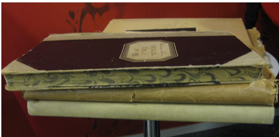
Kuvio 1. Vanhojen sidottujen kirjojen sivureunassa on kaunista mustekuviota.

na on käytetty tavallista tulostuspaperia. Pöytäkirjojen välistä löytyy erilaisia mainoksia. Vuoden 1988–1996 pöytäkirjat ovat mustassa Mercantil mapissa ja vaaleassa kotelossa. Pöytäkirjat on kirjoitettu pääosin konekirjoituksella, mutta muutamia tietokoneella kirjoitettuja tulosteita löytyy. Vuoden 1997–2001 pöytäkirjat ovat valkoisessa kansiossa ja tietokonetulostettuina sivuina.