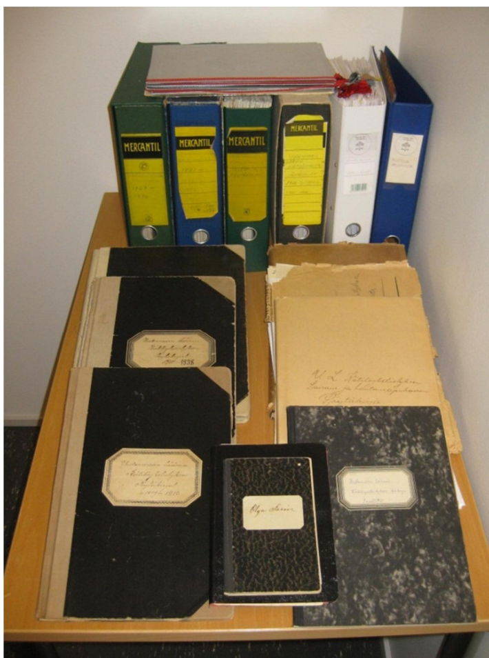
Kuvio 2. Historiikin aineisto.