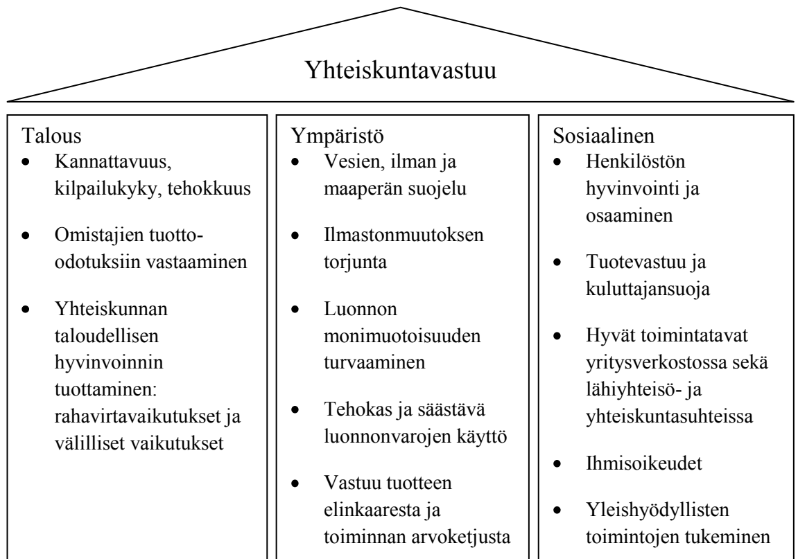
Kuvio 1. Yhteiskuntavastuun sisältö (mukailtu Niskalan ym. 2009 mallista)

pehmenevät. Myös kumppanuussuhteet lisääntyvät. (Elkington 1999, 4-13.) TBL:n johdosta liike-elämä ryhtyi tulkitsemaan yhteiskuntavastuuta laajemmin ja liittivät raportointiinsa taloudellisen, sosiaalisen ja ympäristövastuun. Tämä kolmen pilarin malli (ks. kuvio 1) on yleisesti maailmalle levinnyt ja sitä käytetään muun muassa yhteiskuntavastuu raportoinnin pohjana. Neljäntenä yhteiskuntavastuun pilarina mainitaan toisinaan myös kulttuurinen vastuu. (Juholin 2004, 14.) Kolmen pilarin näkökulman lähestymistapaa on kritisoitu siitä, että sosiaalinen ja ympäristö ulottuvuus jäävät liian irrallisiksi liiketoiminnasta (Lehtipuu & Monni, 2007.)