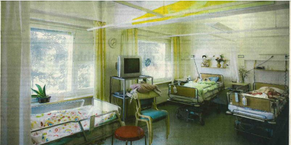
Perspektiivi-sängyt käsin -hankkeessa Vaasan kaupunginsairaalan osastolla 4 ja 7 tuettiin vasaalaistuvien potilaiden taitea. Taulut on sijoitettu kirkkoon, jotta niillä olisi nähtävissä kaikkien vuodepotilaiden nähtävissä.

Pitkäaikaipotilaat saivat taiteellista väriä omiin huoneisiinsa ja sairaalan käytäville