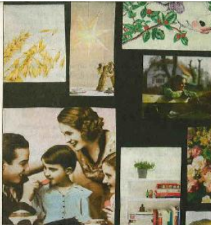
Kuvankokoon avuuta potilaat saivat koota yhteen itselleen tärkeistä muistoista, ajatuksista ja tunteista. Kollasit on ripustettu osaston käytävälle väreillä kirkkaan nähtäväksi.