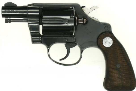
Kuva 1: revolveri

Lakimuutoksella rajoitetaan ensisijaisesti käsiaseiden saatavuutta, joihin lukeutuvat seuraavat aseet: pistoolit, pienoispistoolit, revolverit ja pienoisrevolverit. Revolveri on käsituliase, jossa panokset ladataan piipun takana olevaan, pyörivään sylinteriin (Nurmi ym., 1997.) Pistoolit ovat pieniä, lyhyitä käsituliaseita (Nurmi ym., 1997), joita ammuttaessa pidetään käden tai käsien varassa.