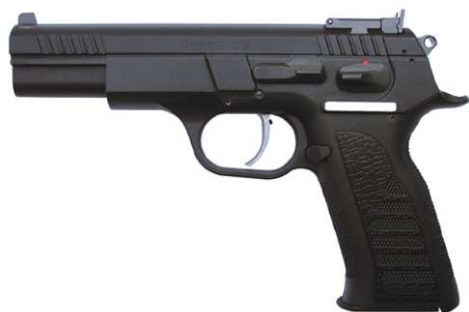
Kuva 2: pistooli