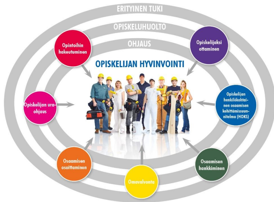
Kuva 1. Hyvinvointisuunnitelman visualisointi oppilaitoksessa