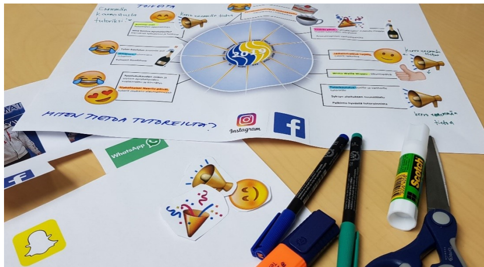
Kuva 5. Luotaimen käyttö hymiöiden ja tekstien avulla.

Luotaimella sain hyvin opiskelijoilta palautetta tutortoiminnan erilaisista muodoista sekä ideoita toiminnan ja palveluiden kehittämiseen. Hymiöt erilaisten tapahtumien kommentoinnissa toimivat hyvin, koska palautteen antaminen oli helppoa. Kommentteja ja kehitysideoita myös monet kirjoittivat luotaimeen.