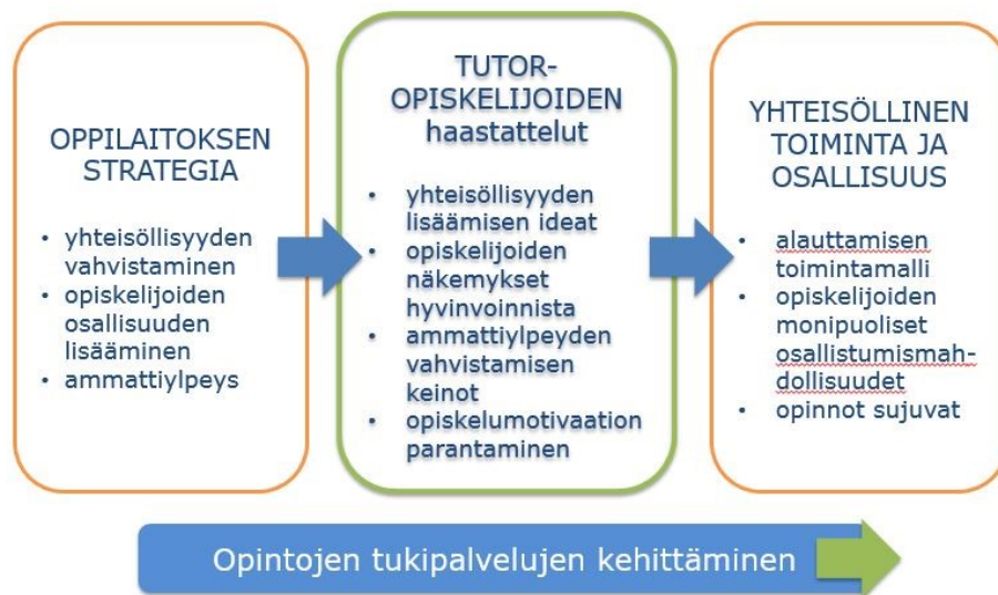
Kuva 3. Tutkimuksen tavoite - strategiasta yhteisöllisen toiminnan kehittämiseen.

Tutkimuksen tavoitteena on saada tutoropiskelijoiden haastatteluilla opiskelijoiden ajatuksia ja ideoita yhteisöllisyyden ja osallisuuden lisäämiseen oppilaitoksen yhteisölliseen toimintaan. Kuvassa 3 on havainnollistettu tutkimuksen tavoite oppilaitoksen strategiasta yhteisöllisen toiminnan kehittämiseen. Tutoropiskelijoiden haastatteluissa kerätään opiskelijoiden näkemyksiä hyvinvoinnista ja ideoita yhteisöllisyyden kehittämiseen.