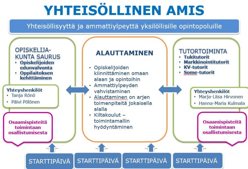
Kuva 2. Yhteisöllinen amis –toimintatavan kuvaus HOI-hankkeessa.

Suomen ammattiin opiskelevien järjestön, Sakki ry:n mukaan tutortoiminnan keskeisenä tavoitteena on edistää opiskelijoiden viihtyvyyttä oppilaitoksessa, ennaltaehkäistä syrjäytymistä sekä vähentää opintojen keskeytyksiä. Tutortoiminta kannustaa opiskelijoita osallisuuteen oppilaitoksessa ja markkinoimaan ammatillista koulutusta. (Mikkola, 2019)