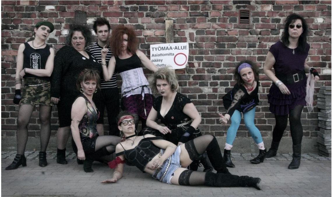
Kuva 3. Tuhmat tädit.

Yhtyeen sanoituksista löytyy intertekstuaalisia viitteitä suomalaisten rockklassikoiden lyriikoihin.