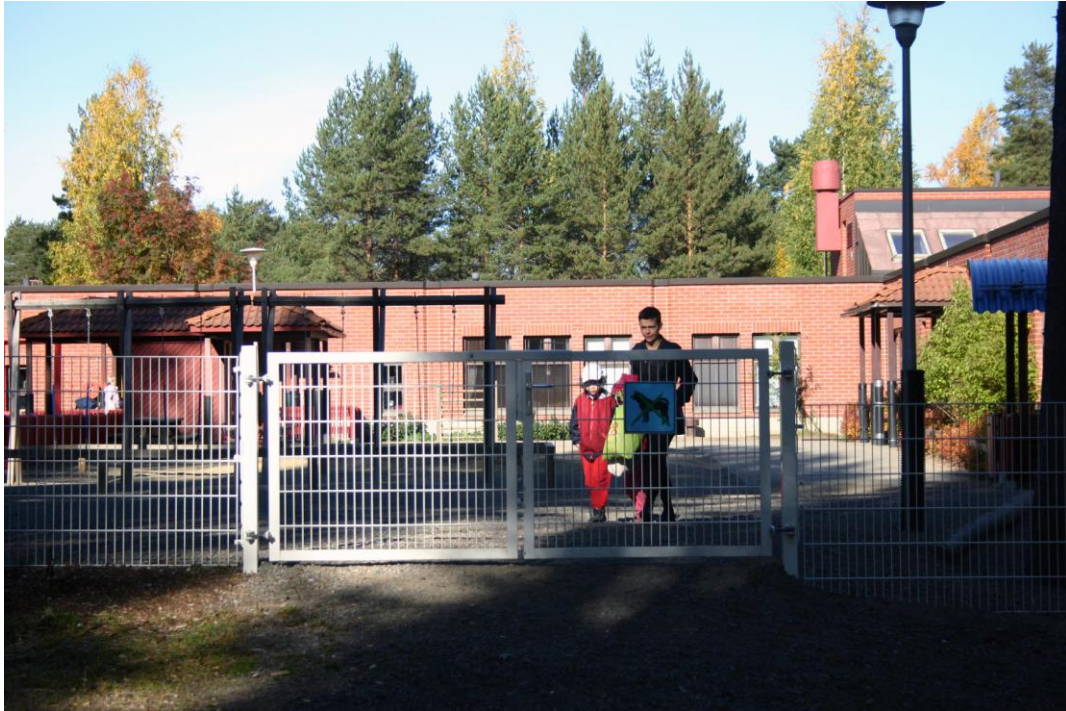
Kuva 1. Lastentarha.

Äitiys voi sinällään pitää sisällä mahdollisen toiseuden. Esimerkiksi yksinhuoltajia voidaan pitää erilaisina vanhempina. Äidin rooliin kuuluu usein yleisesti hyväksytyjä piirteitä, jotka yksilö puolestaan sisäistää osaksi identiteettiään. Kulttuuriset, äitiyttä koskevat odotukset vaikuttavat myös siihen, miten äitiys henkilökohtaisella tasolla koetaan (Berg 2008, 24).