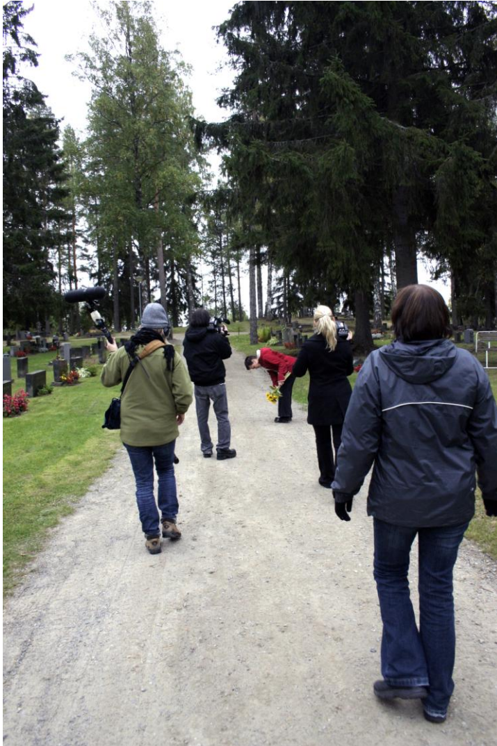
Kuva 6. Kuvausryhmä Rääkkylän Rasivaarassa.

Tärkein tavoite tuotantovaiheelle oli saada aikaan mahdollisimman aito ja välitön ilmapiiri. Haasteellisin tehtäväni oli luoda kuvattavien ja kuvausryhmän välille mahdollisimman luottamuksellinen suhde. Tärkeintä oli saada kuvattua tilanteet sellaisinaan ilman kameran fyysisen läsnäolon ja taltioimisen pelkoa. Tällainen ilmapiiri oli myös pyrkimykseni dokumentin yleisen olemuksen kannalta. Kuvaustilanteet vaativat koko työryhmältä täydellistä sitoutumista ja läsnäoloa. Ohjaajana pyrin kertomaan dokumentin ja kohtausten sisällöistä mahdollisimman paljon etukäteen kuvauksiin osallistuneille henkilöille. Luottamuksellisen ilmapiirin saavuttaminen mahdollisti myös kuvausryhmän intensiivisen osallistumisen tilanteisiin. Kuvausryhmästä tuli olennainen osa tarinankerronnan prosessia. Pystyin myös ohjaajana keskittymään haluamiini kuviin.