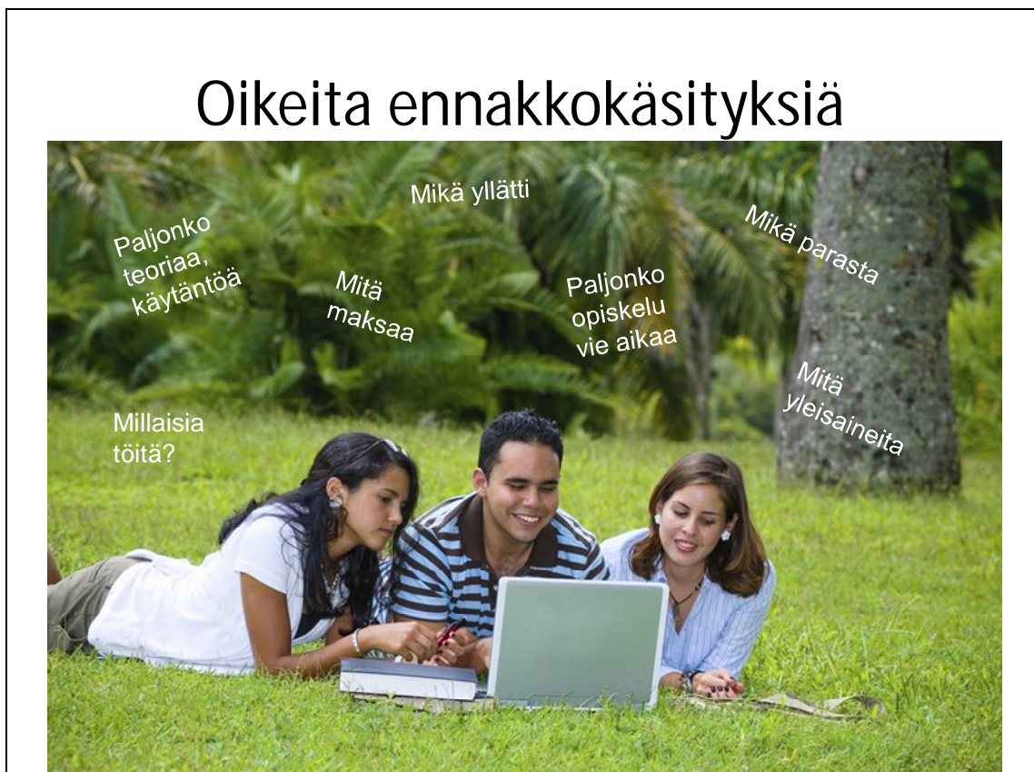
Kuvio 6. Oikeita ennakkokäsityksiä

Lähtisin tekemään pientä kyselyä ensimmäistä lukuvuotta opiskelevilta heidän kokemuksistaan opiskelusta ja siitä mikä heille tuli opinnoissa yllätyksenä. Edelleen opiskelijoista voisi valita pienen työryhmän, joka lähtisi työstämään asiaa oppilaitoksen ohjauksessa. Oppilaitos voisi oppilastyönä tehdä koulun verkkosivuille tai vaikkapa facebookiin linkkejä, joista voisi katsoa videopätkiä opiskelijoiden itsensä kertomana. Näin nuorten itsensä kertomana asiasta tulisi mielenkiintoinen kohderyhmää ajatellen. Kirjoitetussa muodossa oleva sama tieto tavoittaa todennäköisesti huomattavasti harvemman sivustolla surffailevan. Videolla voisi olla sekä tyttöjä että poikia eri aloilta. Eri henkilöt voisivat kertoa ja jakaa kokemuksiaan opiskelusta. Kaksoistutkinnosta voisi olla oma linkki, samoin kuin kaikista eri aloista. Seuraavassa (Kuvio 6.) esimerkkejä asioista, joista videolla voisi esim. kertoa: