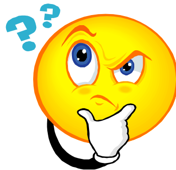
Kuvio 4. Keskustelunaiheita nuorille ja vanhemmille/huoltajille