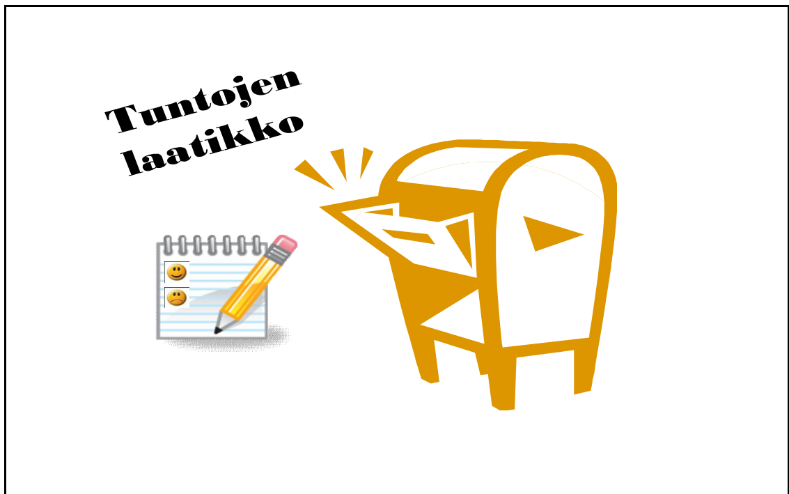
Kuvio 5. Tuntojen laatikko

Yksi ehdotus asian korjaamiseksi on ”Tuntojen laatikko” (Kuvio 5.). Jokainen ryhmä voisi itse suunnitella ja toteuttaa oman näköisen laatikon omasta materiaalista tai vaikkapa kenkälaatikosta. Hätätapauksessa asian ajaa vaikka rahalipas. Oleellista on, että sinne on turvallista jättää omat tuntosensa opettajan luettavaksi. Koskelan mukaan opintoihinsa sitoutumatonta opiskelijaa on usein vaikea lähestyä ja yhteyden muodostuminen on täysin opettajan aloitteesta riippuvaista. Opiskelija saattaa vastustaa kaikkea, myös siis opettajan lähentymisyrityksiä, kirjoittaa Koskela (2003, 115) ja jatkaa, että opiskelija saattaa heittäytyä myös kokonaan puhumattomaksi opettajan edessä. Ajattele kuitenkin, että silloin kun opiskelija on jättänyt viitteitä sitoutumattomuuden syistä, on se samalla myös käden ojennus opettajalle, jolloin opiskelijaa on helpompi lähestyä.