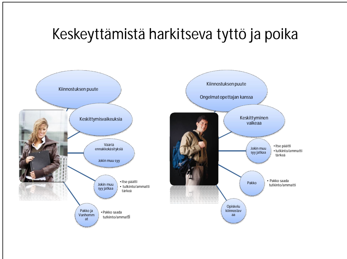
Kuvio 3. Keskeyttämistä harkitseva tyttö ja poika

Keskeyttämisajatuksista huolimatta jokin syy oli saanut nuoret jatkamaan opintojaan. Tässä kohtaa ei kyselyn perusteella ilmennyt suurta ero sukupuolten välillä. Molemmille ”Jokin muu syy” oli tärkein syy jatkaa opintoja. Sekä tyttöjen, että poikien kohdalla toiseksi eniten jatkamispäätökseen vaikutti pakko. Ainoastaan tyttöjen kohdalla myös vanhempien/huoltajien merkitys nousi yhtä tärkeäksi vaikuttimeksi kuin pakko. Suurin osa oli keskustellut keskeyttämisajatuksistaan kaverin/kavereiden kanssa, mutta jatkamispäätöksessä pojat eivät ilmoittaneet kavereiden merkitystä juuri lainkaan. Vastaavasti 21 prosenttia kaikista keskeyttämistä harkinneista tytöistä ilmoitti kaverin/kaverit yhdeksi syyksi jatkaa opintoja. Otannan perusteella voidaan tiivistää ne tekijät jotka saavat opiskelijat jatkamaan opintojaan. Näitä olivat lopulta järki ja pakko, joiden taustalla vaikuttivat vahvasti vanhemmat/huoltajat, sekä opiskelun kiinnostavuus.