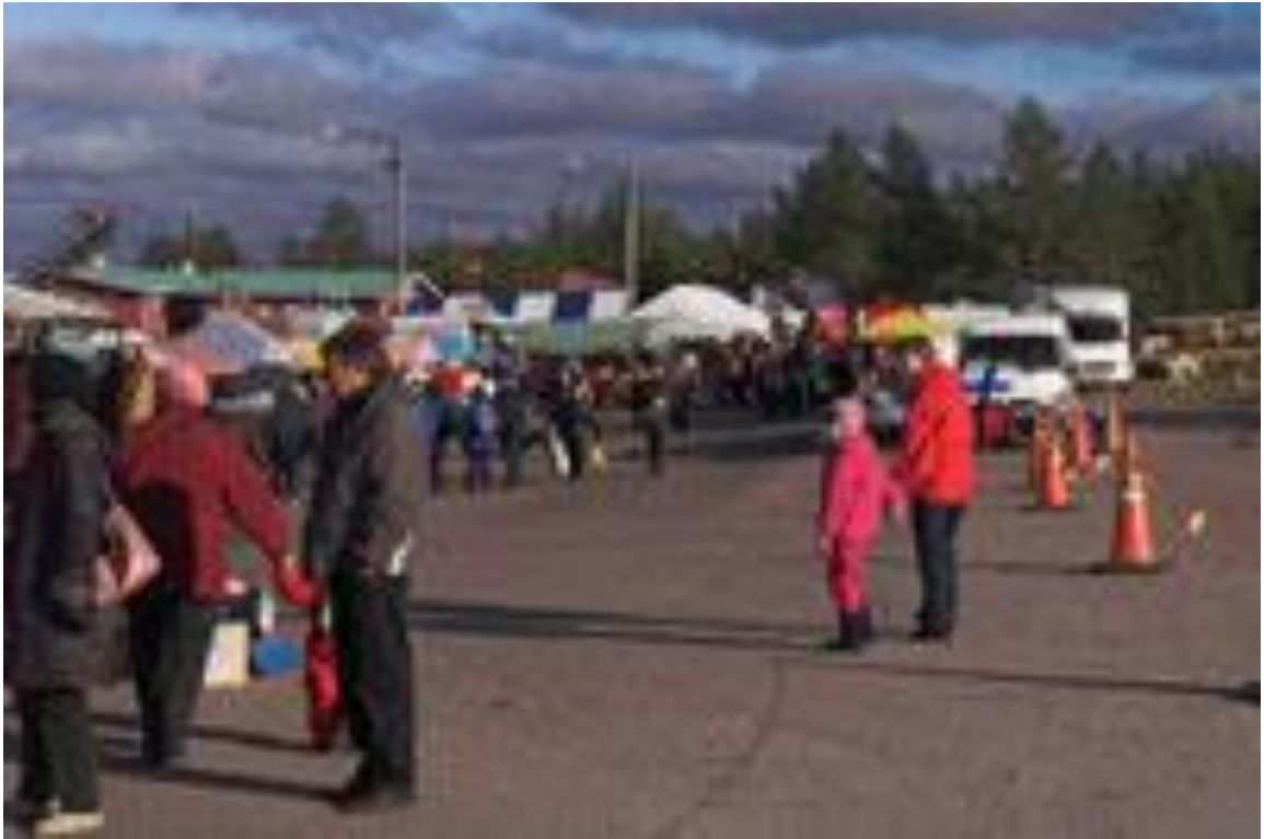
KUVIO 5. Siikamarkkinat Marjaniemessä. Hailuodon kunta, hakupäivä 22.3.2011.

kohderyhmä, vaikka useilla tapahtumilla onkin kävijöitä Hailuotoon suhteutettuna varsin mukavasti. Osallistujamäärät vaihtelevat vuosittain ja sääolosuhteilla tuntuu olevan erittäin suuri vaikutus Siikamarkkinoille saapumiseen.