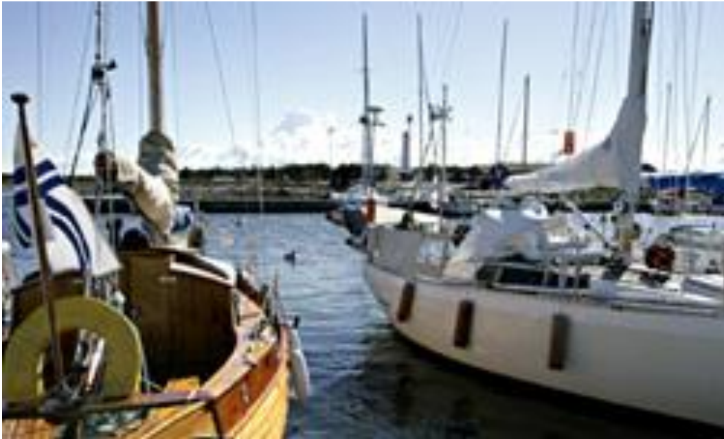
KUVIO 7. Veneitä Marjaniemen vierasvenesatamassa.

Markkinointia kannattaisi tehostaa sisällyttämällä kalastus-, hylkeenbongaus- ja virkistysreissuja saaren ohjelmalveluyrittäjien palvelupaketteihin.