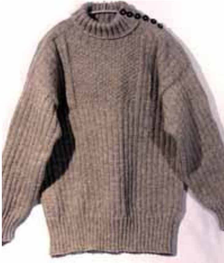
KUVIO 4. Luotolainen villapaita eli tikkuri. Luovon Puoji, hakupäivä 13.4.2011.