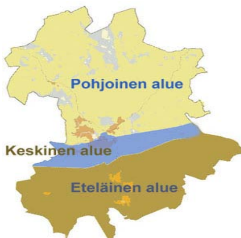
Kuva 1. Kouvolan varhaiskasvatuksen palvelualueet ( www.kouvola.fi/palvelut/paivahoito ).

Kouvolan Varhaiskasvatustarjonta on jakautunut kolmelle palvelualueelle pohjoiseen (Jaala, Kuusankoski, Valkeala), keskiseen (Koria, entinen Kouvola, Utti ja Kaipainen) ja eteläiseen (Anjalankoski, Elimäki) alueeseen. Kouvolan kaupunki tarjoaa kaikille perheille avoimen varhaiskasvatuksen maksutonta perhepuistotoimintaa kolmessa perhepuistossa, Pentsojan ja Kuovin perhepuistoissa Kouvolassa ja Rekolan perhepuistoissa Kuusankoskella. Vuosina 2009 - 2010 kävijöitä on keskimääräisen otannan perusteella ollut 62 henkilöä/puisto/pv.