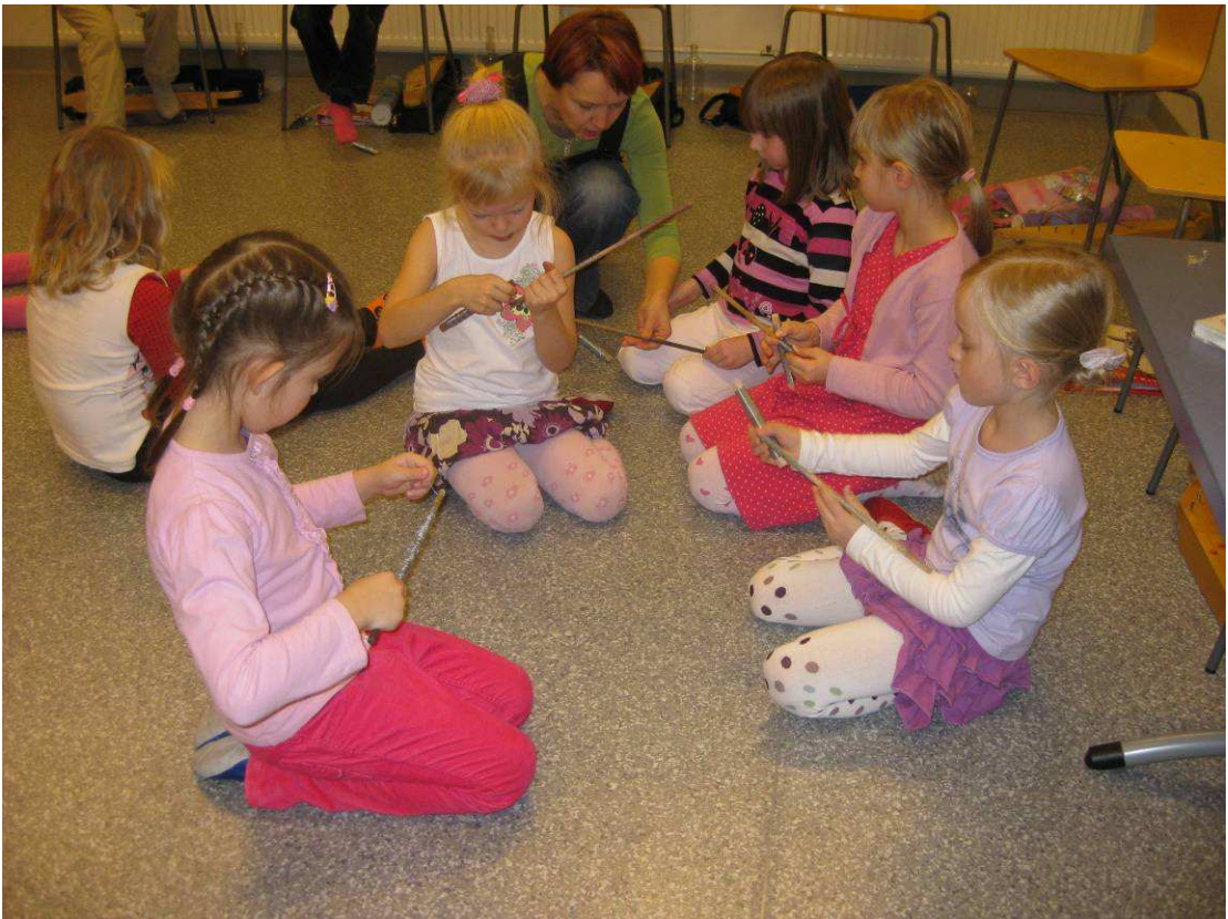
Kuva 12: Rautalangan kieritys loppusuoralla