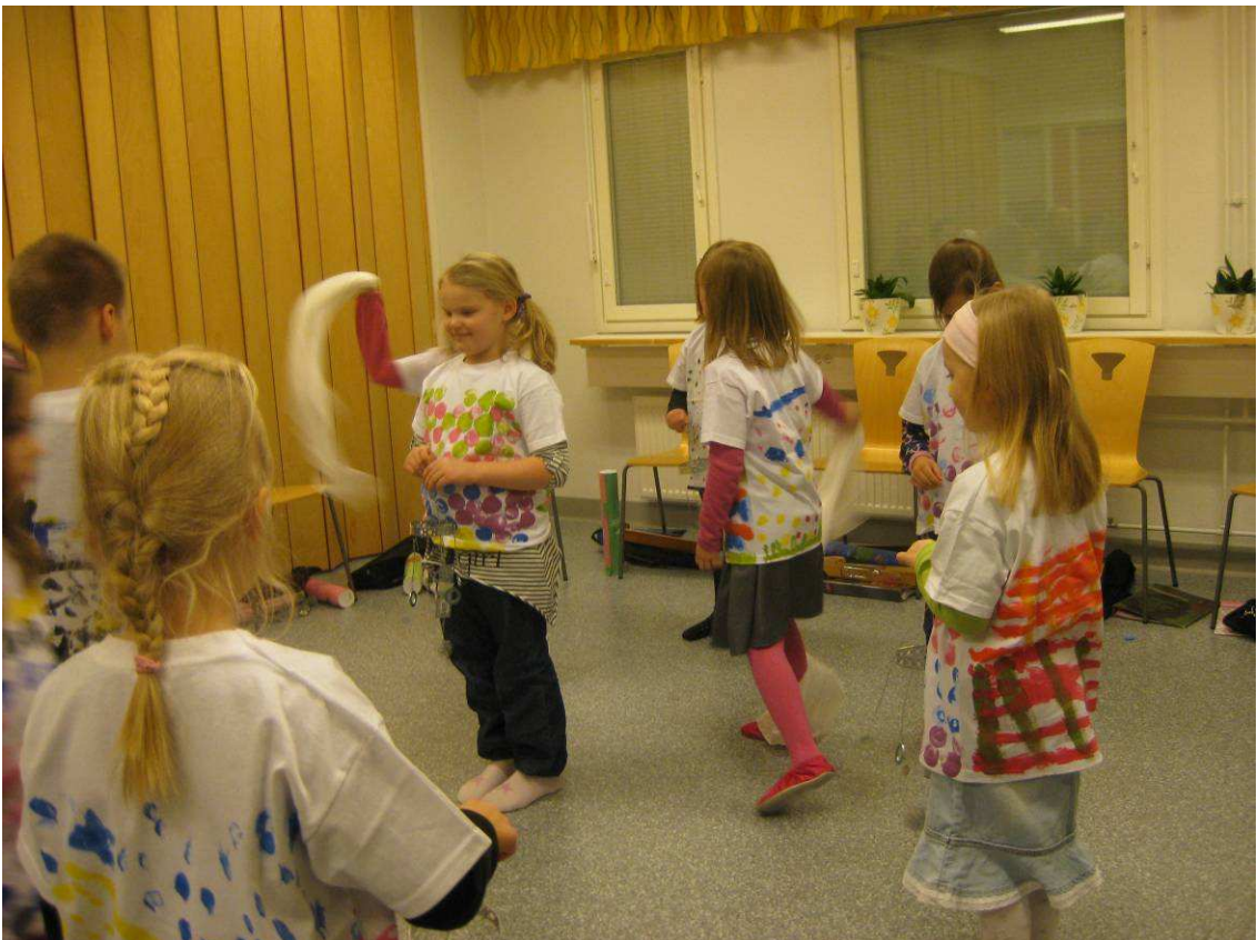
Kuva 18: Tuulimetsä