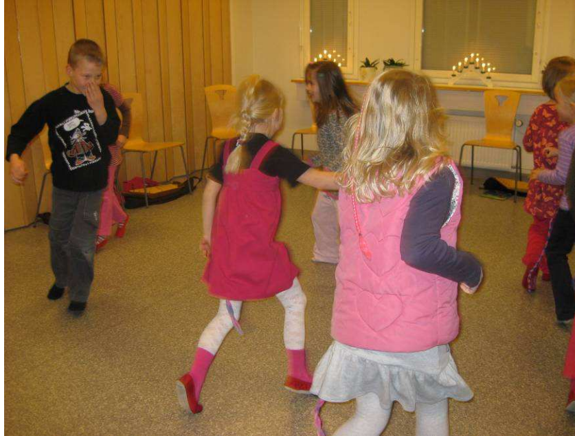
Kuva 16: Häntähippaa

Tällä tunnilla lapset tuntuivat oleva tosi iloisella päällä. Olisiko syynä ollut se, kun saimme pitkään työn alla olleen tuulikellon valmiiksi vai jokin muu seikka, mutta tällä kerralla tuntui, että lapset nauttivat sekä musiikillisista että kädentaidollisesta osuudesta.