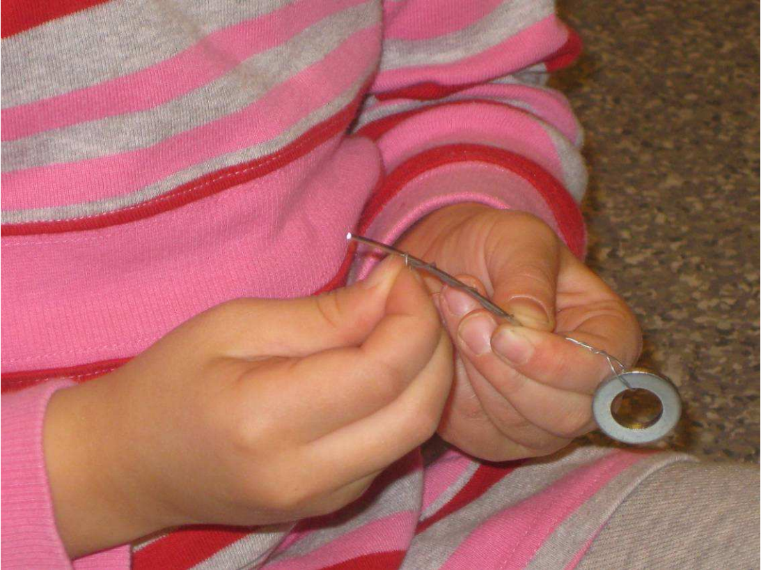
Kuva 8: Riipuksia tuulikelloon