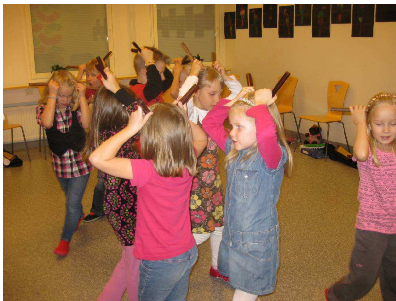
Kuva 3: "Turilas, turilas kärpänen toukka"

Tämän jälkeen virittäydyimme tunnin ötökkä-teemaan lorun "Turilas, turilas", mukana. Keskustelimme ensin lorun ötököistä, loruilimme ja taputimme samalla sanarytmiä. Lapset tuntuivat oppivan tosi nopeasti lorun. Tämän jälkeen soitimme kapuloilla lorua sanarytmissä ja lauloimme ja liikuimme "Etana, etana näytä sarves" ja "Lennä, lennä leppäkerttu" lauluja. Kapulat toimivat laulujen aikana ötökkäsarvina. Lapset eläytyivät ötököihin liikkumalla, kuten ötökät, kun kapulat toimivat sarvina. Tuntuu siltä, että lapset eivät tarvitse ollenkaan mitään erikoisia välineitä, että pystyvät heittäytymään tiettyyn rooliin, vaan riittää kuten tässä esimerkiksi vain kapulat. Tämän jälkeen soitimme loru ja laulu -sikermän kanteleella siten, että loru koputettiin kanteleen ponteen ja laulut soitimme ja lauloimme kanteleen säestyksellä.