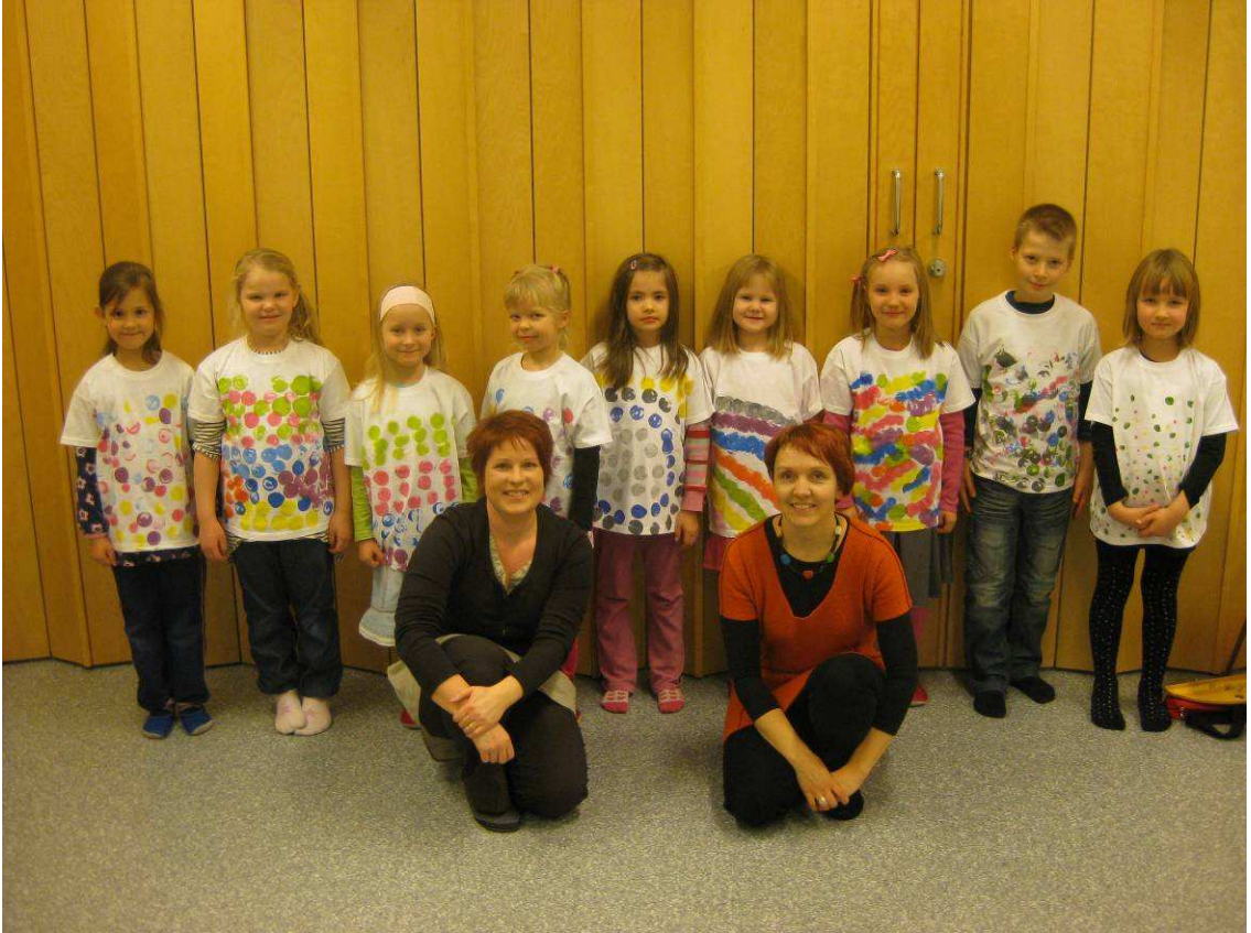
Kuva 20: MusaKäsi -kokeiluryhmäläiset (kuvasta puuttuu yksi tyttö)