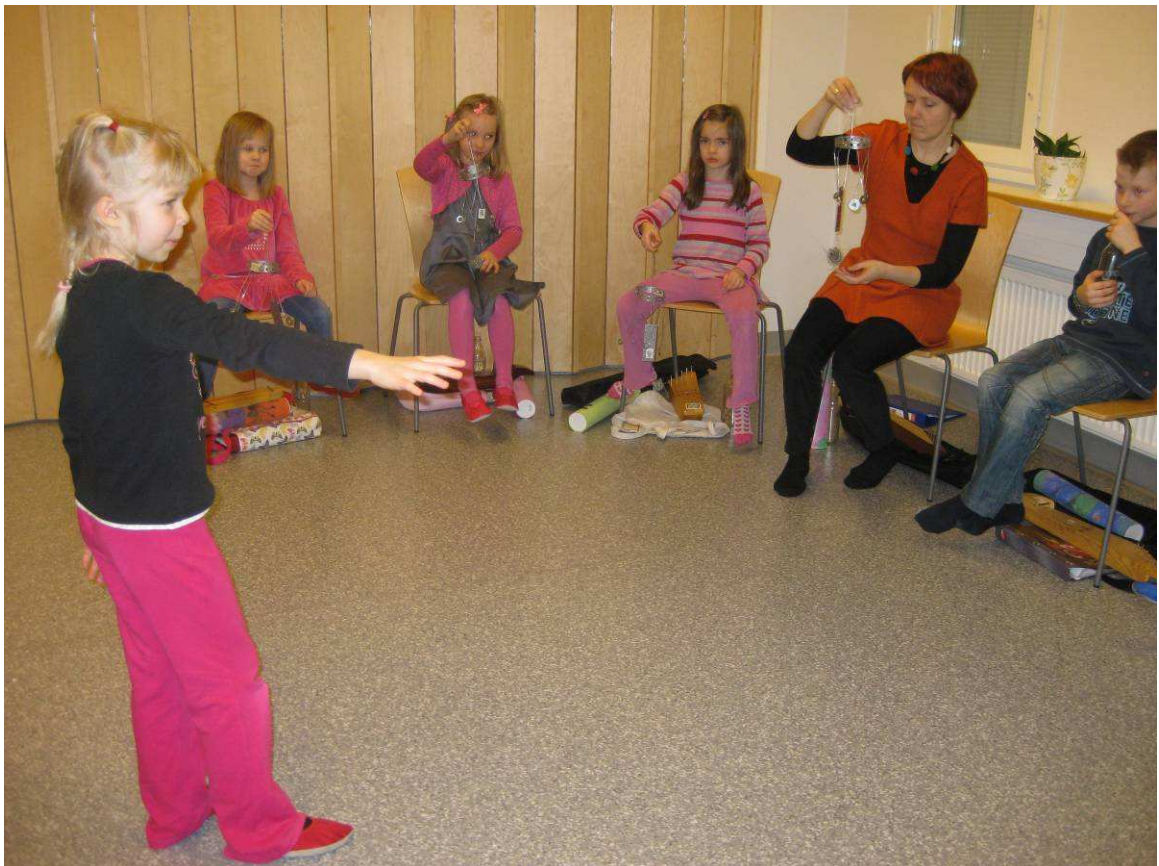
Kuva 13: Tuuliorkesterin kapellimestari työssään

Kaikkeen valmisteluun ja värien hakemiseen tuntuikin menevän aikaa huomattavasti enemmän kuin mitä olimme etukäteen ajatelleet. Käsityöosuuden jälkeen huomasin, että tuntia oli jäljellä noin 15 minuuttia. Halusin tehdä vielä lasten kanssa tuuliorkesterin, mikä jäi tunnin alussa tekemättä. Jaoin ryhmän kolmeen ja kullakin ryhmällä oli oma soitin: tuulikello, sadesoitin tai lasipullo. Ensimmäisen kerran minä olin kapellimestarina ja lapset tuntuivat ihan lumoutuvan omasta soitostaan. Lapset olivat erittäin keskittyneitä ja tuntuivat eläytyvän tuulen ääniin. Teimme orkesterin vielä muutaman kerran vaihtaen joka kerralla kapellimestaria. Kaikki lapset olisivat halunneet olla johtamassa orkesteria, mutta se ei ajallisesti ollut tällä kerralla mahdollista. Viimeisellä soittokerralla johtamassa oli kaksi kapellimestaria ja tuntuikin joko kahdesta kapellimestarista tai tunnin lopusta, etteivät lapset enää jaksaneet kunnolla keskittyä.