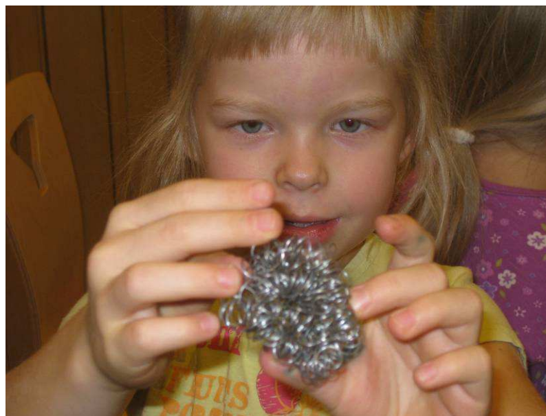
Kuva 15: Peikkopoika