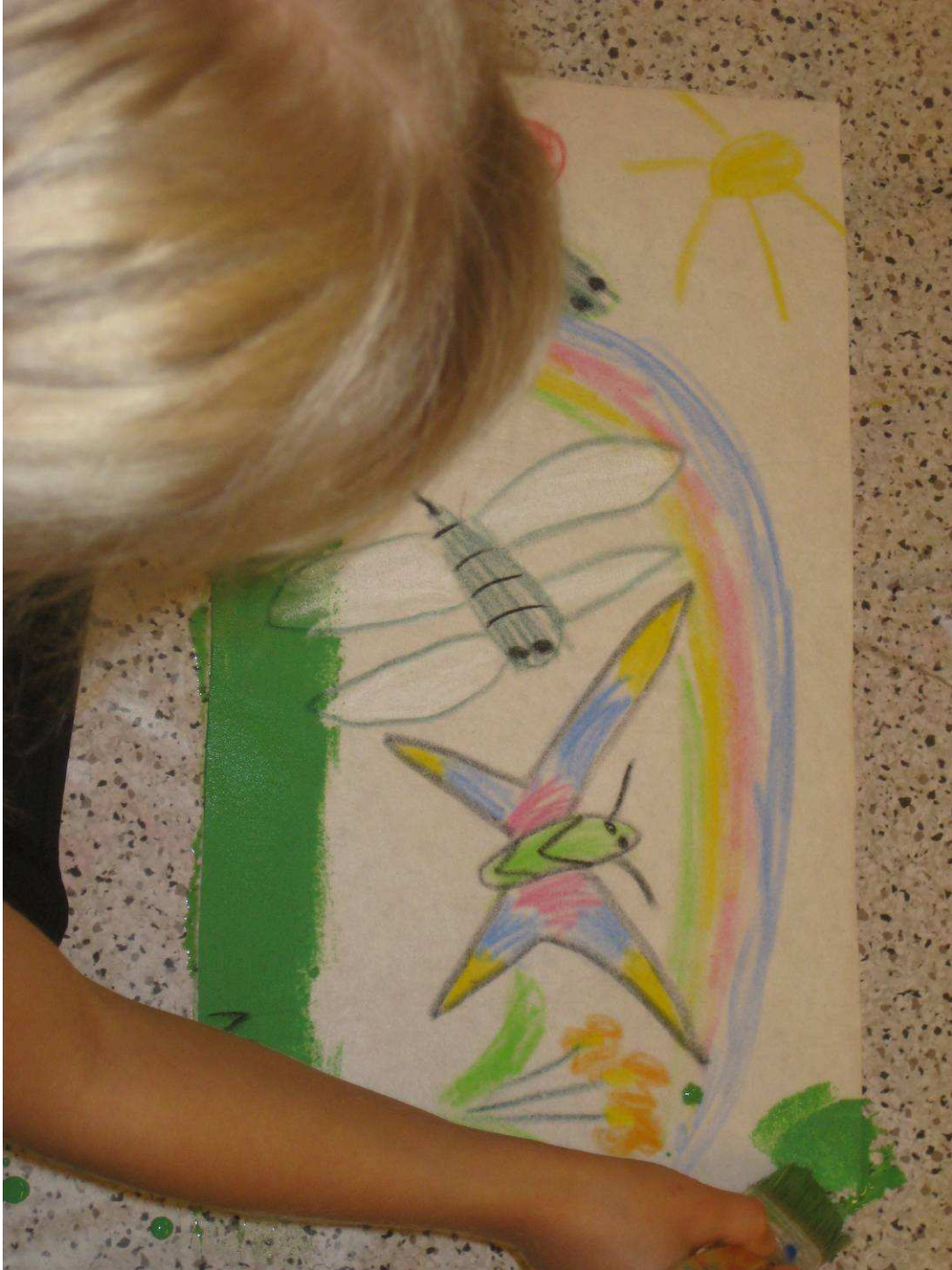
Kuva 6: Taustamaalausta

Lopuksi jaoin lapsille tunnilla kanteleella soitetut laulut. Tunti kului tosi nopeasti, joskin joihinkin musiikillisiin osuuksiin olisin halunnut käyttää aikaa hieman enemmän.