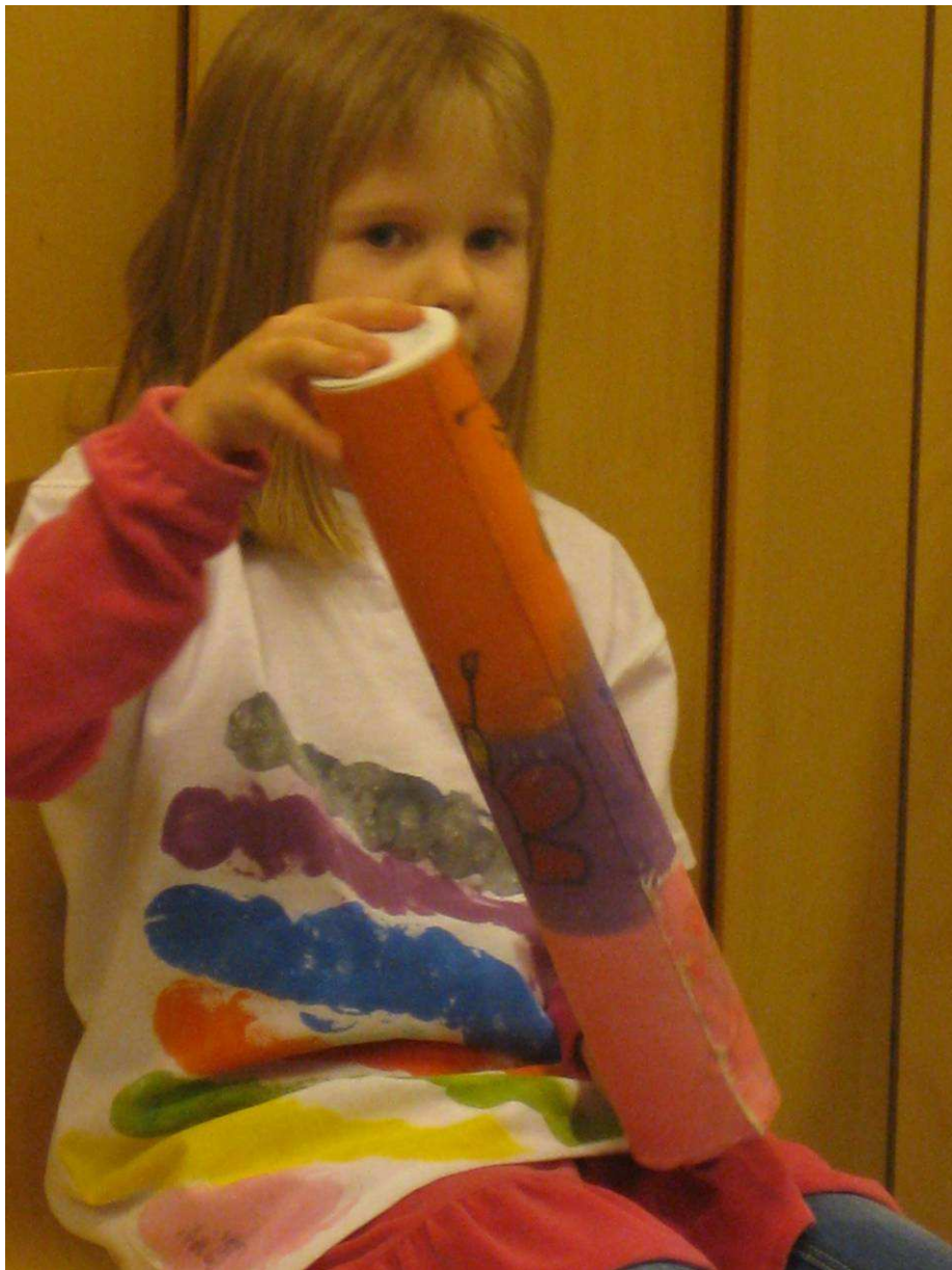
Kuva 19: Silisilisee