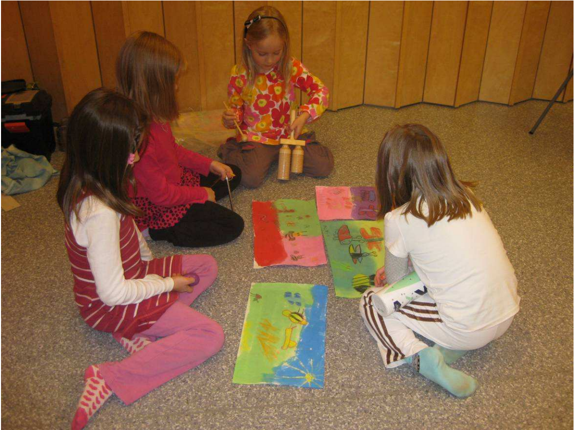
Kuva 7: Kuvasta tarinaa ja ääntä

Veera: Eräänä päivänä ampiainen tapasi leppäkertun. Leppäkerttu ja ampiainen näkivät perheen sekä kirppuja. Leppäkerttu meni istumaan ja katsoi aurinkoa. Se päätti mennä kotiin. Rupesi satamaan. Ampiainen tapasi madon. "Rakennan äkkiä sinulle mato kolon", sanoi ampiainen. Pian sataa ja täytyy mennä sisälle.