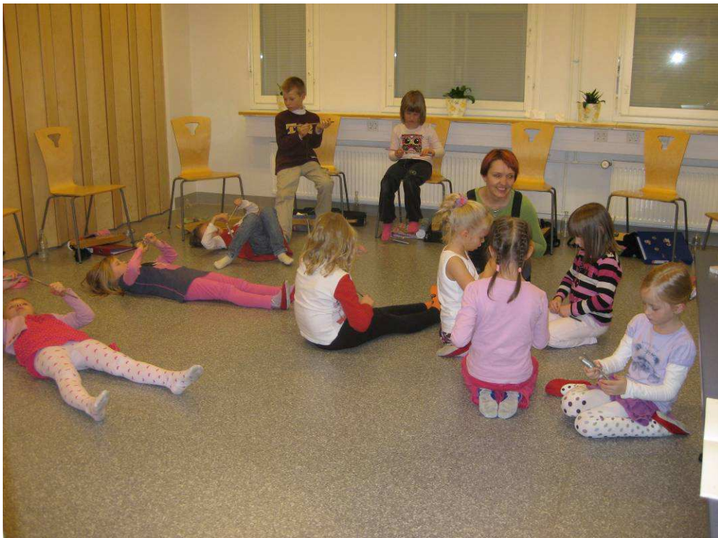
Kuva 10: Tuulikellon koristeiden työstämistä

Peikkolaulun jälkeen aloimme tehdä koristetta tuulikelloon. Ajatuksena on, että aloittaisimme sen kierittämällä rautalankaa ohuen kepin ympärille vieteriksi, josta sitten pyöritämme peikon. Rautalangan kieritys olikin osasta lapsille yllättävän haastavaa. Toki muutamat lapset huomasivat heti, miten pitäisi toimia ja pääsivätkin mukavasti alkuun. Vaikka muutamalle lapselle alku oli hieman hankalaa, ryhtyivät kaikki kumminkin innokkaasti työhön. Varsinkin työn edetessä rautalangan kierittäminen oli käsille raskasta, kukaan lapsista ei sanonut, että ei halua tehdä. Muutama lapsista keksikin, miten helpottaa oloaan. He menivät lattialle selälleen makaamaan ja jatkoivat kieritystä selällään. Näin heidän mielestään hartiat ja kädet saivat levätä lattiaa vasten. Näky oli huvittava.