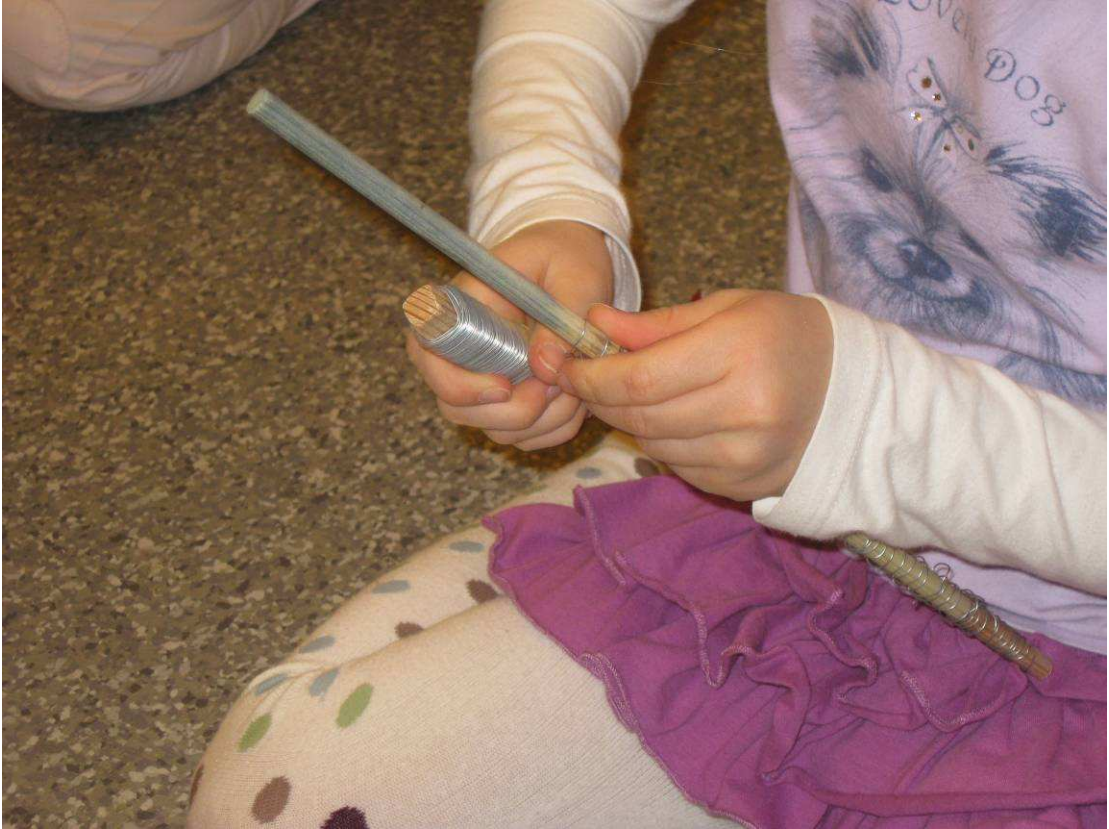
Kuva 11: Rautalangan kieritystä