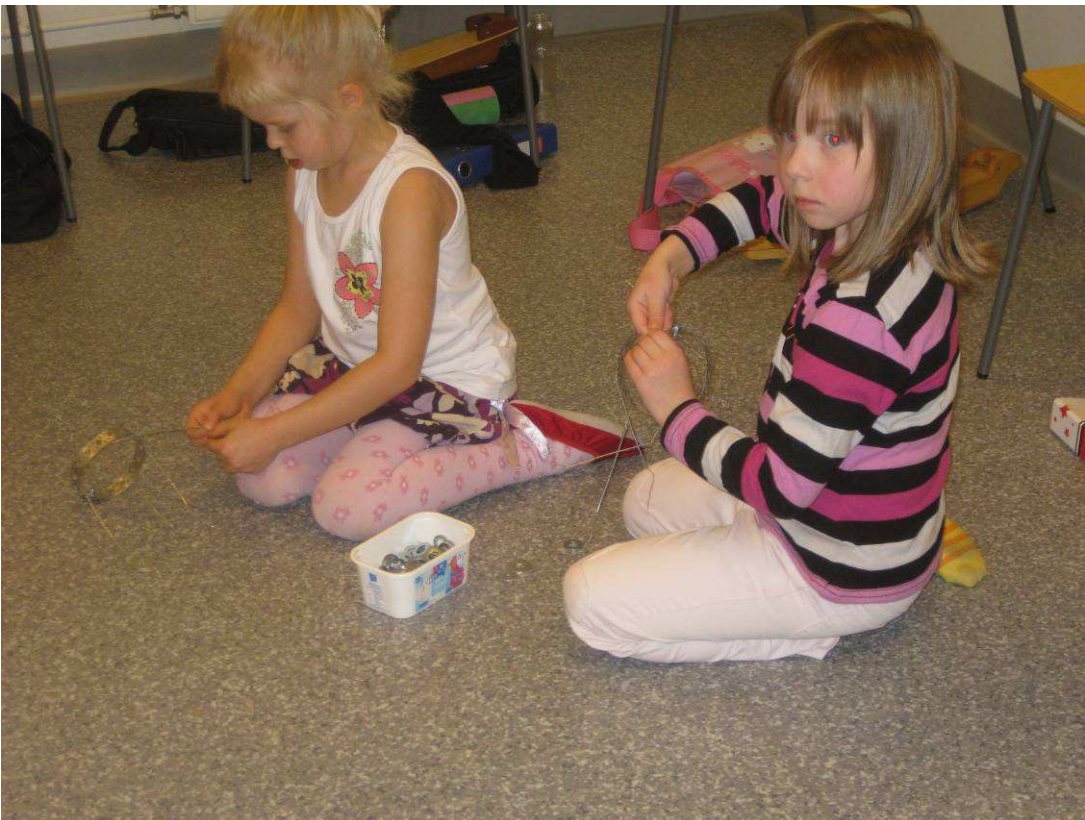
Kuva 9: Riipukset kiinnitetään reikävanteeseen