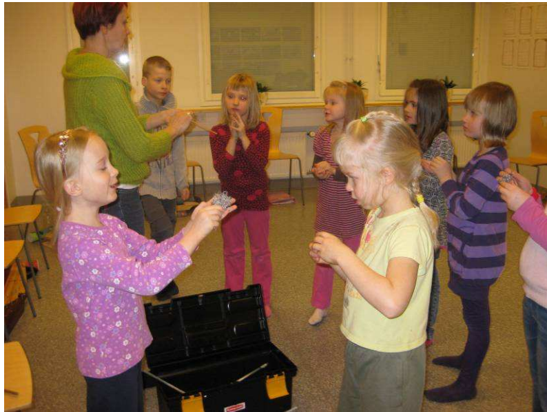
Kuva 14: Vieteristä Peikkopoika

työstää kanteleensoittoa. Kertasimme toissakerralla hieman vähälle jääneen "Peltirummun peikkopoika" -laulua ensiksi liikkuen, siten soittaen ja laulaen. Yhdistimme kanteleensoittoon ja lauluun myös tuulikelon, sadesoittimen ja lasipullon. Jaoin ryhmän kahteen siten, että toinen puoli soitti kannelta ja toinen puoli ryhmästä säestivät laulua muilla edellä mainituilla soittimilla. Lapset saivat päättää, mitkä säkeistöt soitettaisiin milläkin soittimella. Peikkopojan orkesteri soi tosi hienosti ja tuntui, että lapset oppivat laulun sanat nopeasti kun lauluun yhdistettiin siihen kuvaavia soittimia.