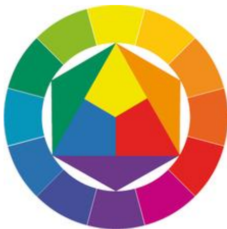
KUVIO 1. Johannes Ittenin väriympyrä (1961).

Rooliasujen suunnittelussa päätin käyttää Johannes Ittenin (1998) kaksitoistaosaista väriympyrää, joka toimii myös suunnittelun värikarttana.