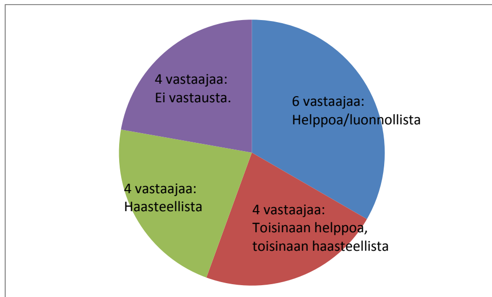
Taulukko 1. Kyselyyn vastanneiden kokemukset uskontokasvatuksen järjestämisestä.

Uskontokasvatuksen toteuttamisen helppous tai haasteellisuus jakoi vastaajien mielipiteitä. Kolmasosa vastaajista koki uskontokasvatuksen toteuttamisen helppona ja luonnollisena, jopa mielenkiintoisena ja antoisana. Vajaa neljäsosa vastaajista koki uskontokasvatuksen järjestämisen toisinaan helppona ja toisinaan haasteellisena esimerkiksi käsiteltävästä aiheesta riippuen. Saman verran vastaajia koki uskontokasvatuksen haasteellisena.