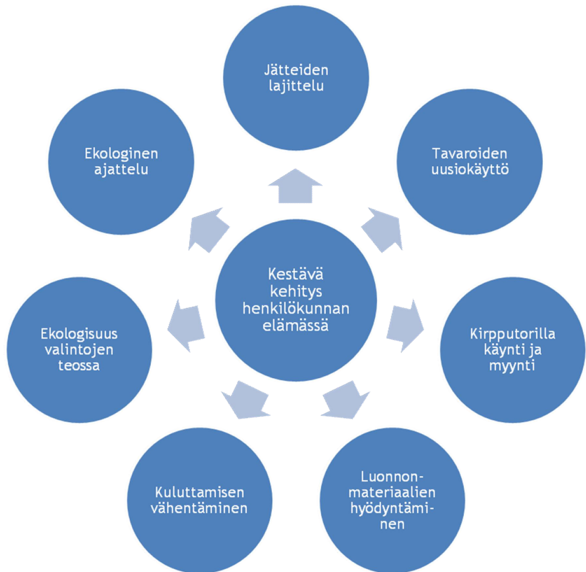
Kuvio 1. Kestävä kehitys henkilökunnan elämässä