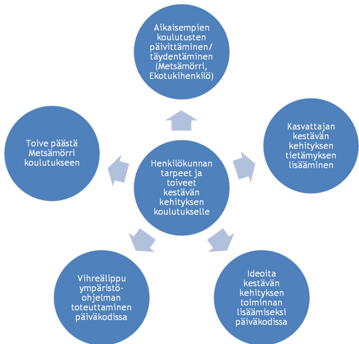
Kuvio 3. Henkilökunnan tarpeet ja toiveet kestävän kehityksen koulutukselle

” Kyl mä aina haluisin koulutusta, jos vaan mahdollista. Kaikkea ja sit- ten ihan käytännössä, että aina jos oppisi uusia asioita mitkä liittyy sii- hen (kestävään kehitykseen): leikkejä, askartelua, kaikkea toimintaa mitä voi käytännössä tehdä.”