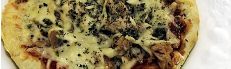
Kuva 2. Kuva pizzasta

Ohjeena kuluttajalle annettiin, että tuote pitää palauttaa lähimpään myymälään, joka tuotetta myy.