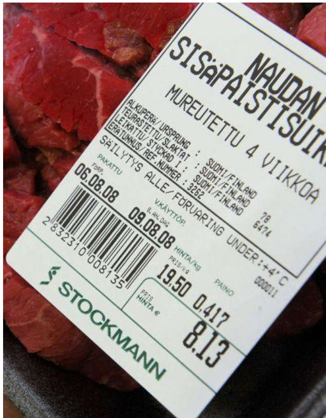
Kuva 1. Pakkausmerkinnät