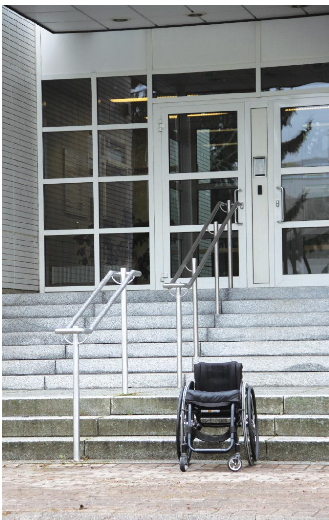
Kuva 9. Kaupungintalon pääovi.

Kaupungintaloa kuulee kutsuttavan kaikkien kaupunkilaisten olohuoneeksi. Ulvilan kaupungintaloon johtaa kolme erillistä sisäänkäyntiä. Sisään pääsee vain portaita.