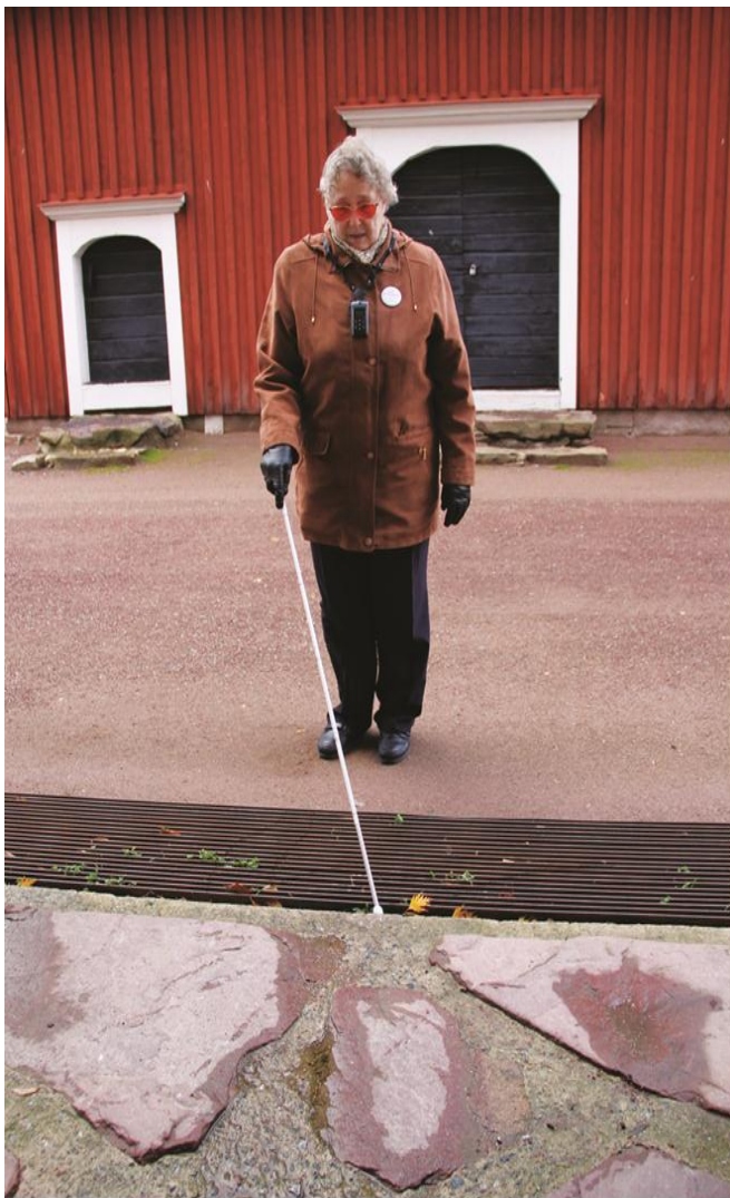
Kuva 10. Pyhän Olavin Kirkon pääsisäänkäynnin edusta.

Kuvassa 10 näkyy Pyhän Olavin Kirkon pääoven edusta. Edustassa on ritilä, johon näkövammaisen opaskeppi tarttuu helposti kiinni. Kenkien korot juuttuvat usein ritilöihin. Oville on vaikea päästä pyörätuolilla, koska kulkuväylä ei ole yhtenäinen, vaan siinä on rakoja ja kohoumia.