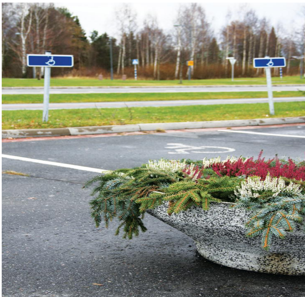
Kuva 12. Kauppakeskus Hansan apteekin lähellä sijaitseva invapaikka (kuvannut Niina Inberg).

Hansassa on kaksi parkkialuetta, joita voivat hyödyntää henkilöt, joilla on invakortti. Apteekin ja kirjaston välissä on paikoitusalue, jossa on invapaikoitukselle varattuja ruutuja. ( Kuva 12. ) Ruutujen eteen on asetettu kaksi suurta betonikukkapurkkia keskelle kulkuväylää niin, että parkkiruuduille on mahdoton kääntyä. Autoilijat joutuvat kiertämään Hansan parkkialueen ympäri ja ajamaan kahden rakennuksen välistä pelastustieksi tarkoitettua tietä päästäkseen paikoitusalueelle. Väylää kaventavat entisestään pylväät ja kauppojen edustalle asetetut mainostaulut. Reitti aiheuttaa lukuisia vaaratilanteita, koska sitä käyttävät myös jalankulkijat ja pyöräilijät.