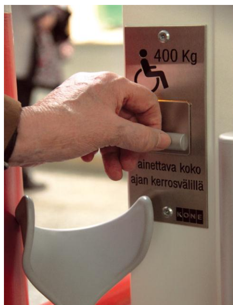
Kuva 5. Kerrosnostin.

Terveyskeskus on kaksikerroksinen eikä siinä ole varsinaista hissiä vaan jälkeinpäin asennettu nostin. Nostin ei ole kovin tilava ja ongelman muodostavat myös nostimen napit, joita täytyy painaa koko ajan. Tasapainoilu huterantuntuudessa nostimessa esimerkiksi kyynärsauvojen kanssa on jo muutenkin haastavaa saatikka kun pitää kurottautua painamaan nappia. (Kuva 4. )