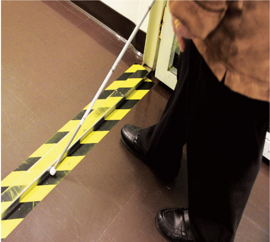
Kuva 3. Terveyskeskuksen fysioterapian yhdyskäytävään johtava ovi.

Varoitustarrojen värien tulee olla selkeästi kontrastisia. Kuvassa 3 on musta-keltainen varoitustarra, jonka kontrastisuus on erittäin hyvä. Sen sijaan kuvan 4 keltapunainen varoitustarra on vaikeasti hahmotettavissa etenkin punavihersokeille. (eml.)