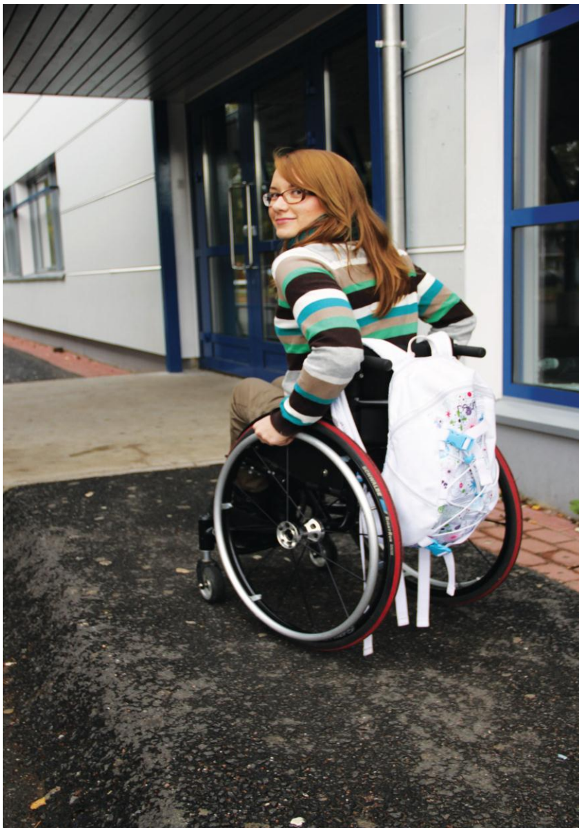
Kuva 1. Yhteiskoulun luiska (kuvannut Niina Inberg).

tarvitsevat askelmien tai portaiden sijasta luiskan. (eml. ) Esteetön luiska on tarpeeksi loiva (5-8 %) ja se on varustettu molemminpuolisilla käsijohteilla. Yksikaistaisen luiskan vähimmäisleveys on 900 mm ja se saa olla enintään kuusi metriä pitkä. Sen on lähdettävä tasanteelta ja päädyttävä tasanteelle ilman pienintäkään tasoeroa (Invalidiliitto 2009,77.) Ulkotiloissa oleva luiska tulee pitää puhtaana ja kuivana lämmittämällä tai kattamalla. Luminen, jäinen tai märkä luiska on liukas ja vaarallinen. Luiska on valaistava hyvin ja apuna kannattaa käyttää materiaali- ja värikontrastia. Portaita täydentämään vaaditaan aina myös esteetön tasonvaihtojärjestelmä. (esteeton.fi www-sivut 2011)