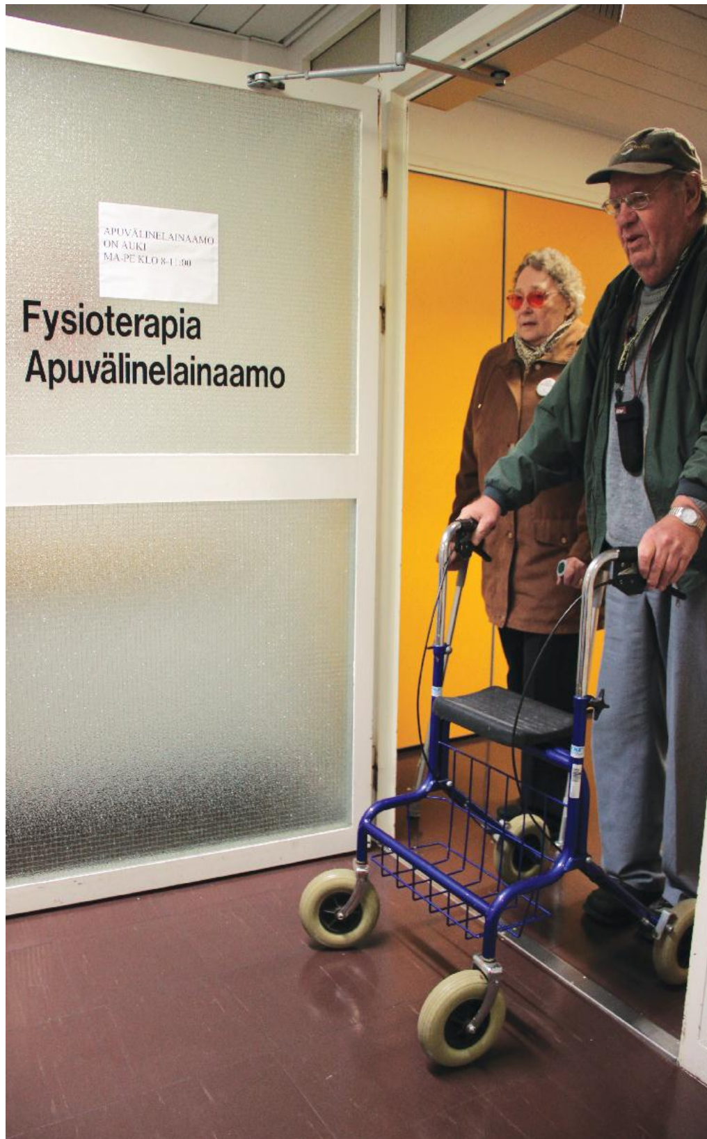
Kuva 2. Terveyskeskuksen fysioterapian ovi.