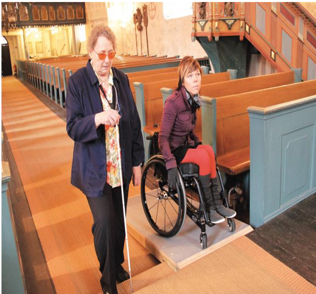
Kuva 11. Ulvilan Pyhän Olavin kirkko.