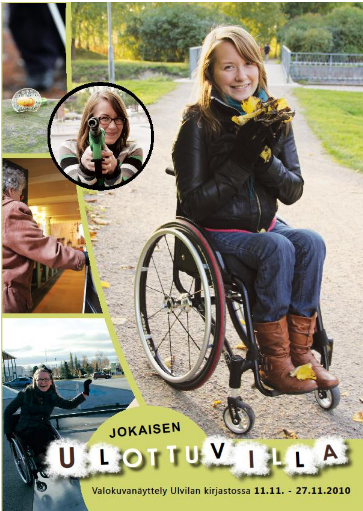
Liite 1. Juliste: Jokaisen ulottuvilla.