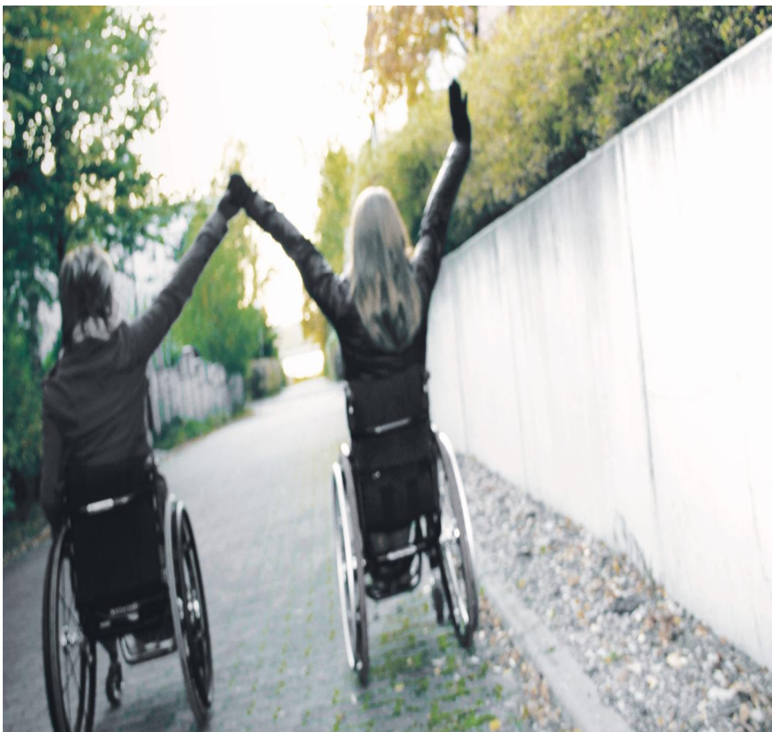
Kuva 14. TULEVAISUUS – JOKAISEN ULOTTUVILLA

Jonakin päivänä Ulvilakin on, jos ei jokaisen ulottuvilla, ainakin paremmin saavutettavissa!