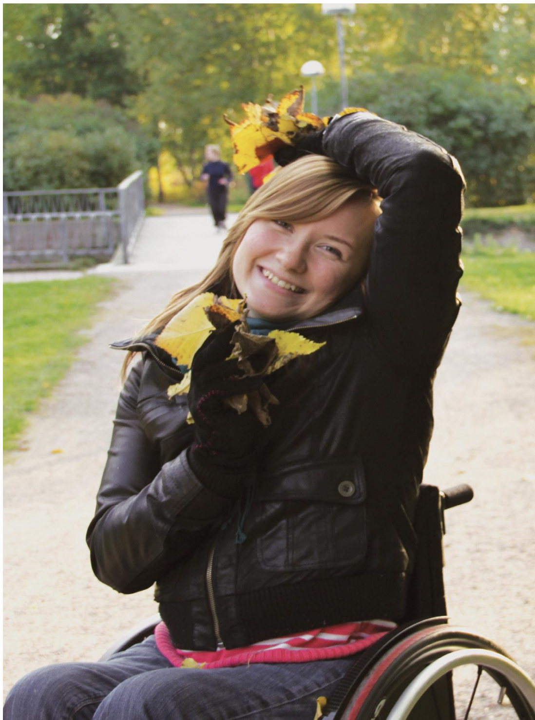
Liite 3. Esitteen pääkuva.