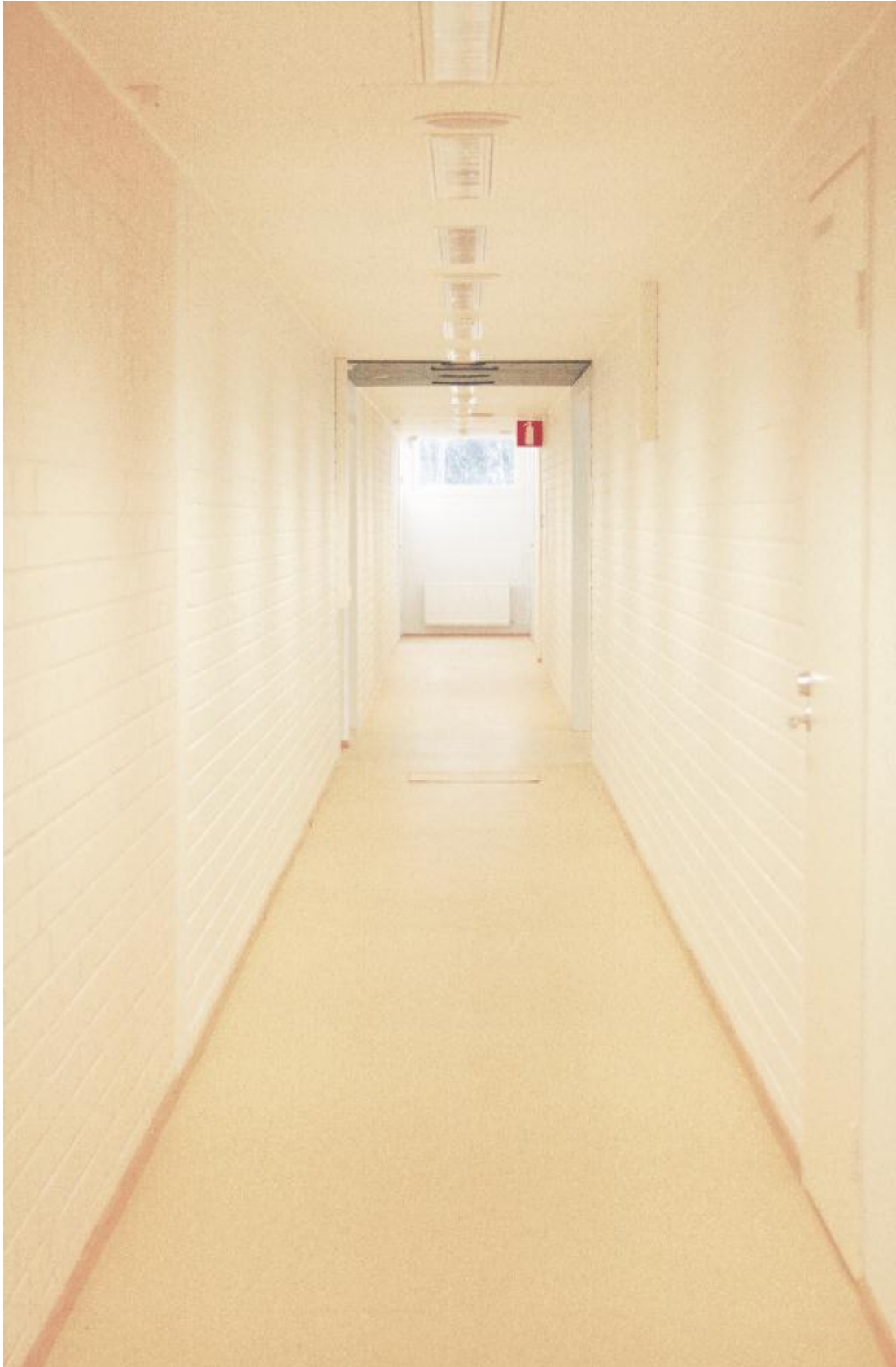
Kuva 7. Vapaa-ajakeskus Kaskelotin uimahallin pukutiloihin ja kuntosaliin johtava käytävä.