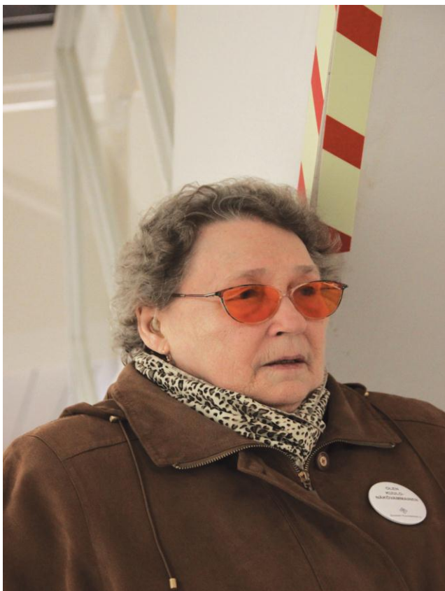
Kuva 4. Terveyskeskuksen varoitustarra.

Terveyskeskus on kaksikerroksinen eikä siinä ole varsinaista hissiä vaan jälkeinpäin asennettu nostin. Nostin ei ole kovin tilava ja ongelman muodostavat myös nostimen napit, joita täytyy painaa koko ajan. Tasapainoilu huterantuntuudessa nostimessa esimerkiksi kyynärsauvojen kanssa on jo muutenkin haastavaa saatikka kun pitää kurottautua painamaan nappia. (Kuva 4. )