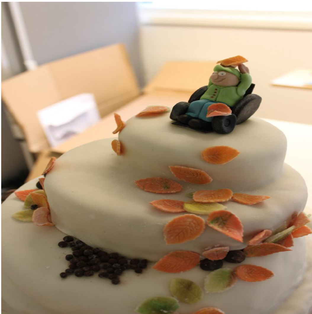
Kuva 13. Porraskakku.

Vau, kun on upea kakku! Sopii hyvin tuohon teemaan! Tärkeästä asiasta kirjoitit... että useimmiten ne esteet ovat ihmisten asenteissa! Niitä onneksi voi kuitenkin, ainakin itsessä muuttaa. Ja kun itsellä muuttaa asenteitaan, kummasti lähipiirissäkin alkaa tapahtua jotain... ;) Hyvää viikonloppua!