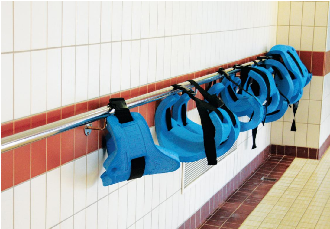
Kuva 6. Suihkutiloista altaalle vievä käsijohde.

Esteettömässä uima-allastilassa altaisiin pääsee loivia portaita pitkin sekä allashissillä. Allashuoneessa ja muissa tiloissa tulisi olla käsijohteita. ( Kuva 6. ) Uima-allastilassa käsijohteiden tulisi ohjata portaalle ja allashissille ja estää altaaseen putoamisen (Invalidiliitto 2009, 101.)