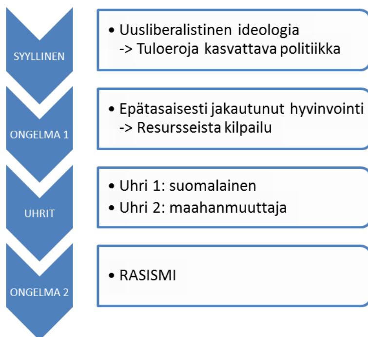
Kaavio 2: Nykyisenkaltaisen politiikan vaikutus rasismiin.

Laadin kaavion havainnollistamaan asiaa: