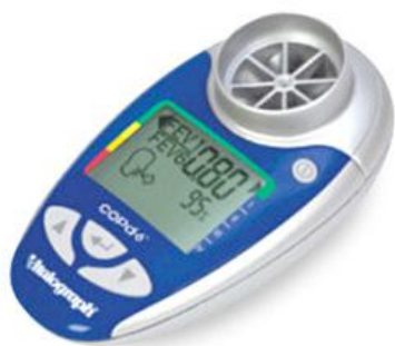
Kuva 1: Mikrospirometria-laite.

Keuhkohtauma.com internet-sivustolla neuvotaan, että pitkään tupakoineiden tulisi selvittää keuhkojen kunto. Vaikka oireet eivät olisi vielä päivittäisiä, voi keuhkojen toiminta olla heikentynyt. Keuhkohtaumatauti voidaan todeta keuhkojen toimintakokeella, puhallustestillä. Spirometria johon tarvitaan lääkärin lähete, on keuhkojen perustutkimus. FEV 1 (Liite 1) tarkoittaa sekuntikapasiteettia, joka on yksikkö litraa sekunnissa. Siinä mitataan puhalluksen ensimmäisen sekunnin aikana puhalletun ilman määrä. Viitearvoon vaikuttaa tutkittavan ikä, pituus ja sukupuoli. Useiden lääkäreiden ja terveydenhoitajien, sekä joidenkin apteekkien käytettävissä on Mikrospirometri-laite (Kuva 1), jolla muutamassa minuutissa voidaan mitata keuhkojen sekuntikapasiteettia (FEV 1 ).