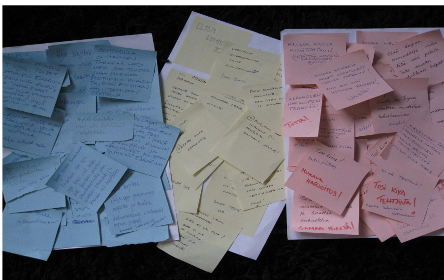
Kuva 1. Kansioon arvioijien toimesta liitetyt kommenttilaput.

Eriväristen kommenttilappujen avulla pystyin vertailemaan sitä, minkälaisiin asioihin eri ammattikunnat olivat kiinnittäneet huomiota. Kommentit keskittyivät kielellisiin ja matemaattisiin harjoitteisiin. Lastenhoitajat kommentoivat monien tehtävien kohdalla niiden mukavuutta, käytännöllisyyttä tai uutuutta. Joihinkin tehtäviin he toivoivat lisäohjeistusta. Lastentarhanopettajat kommentoivat tehtävien laajempia sisältöjä ja tavoitteita. Lastentarhanopettajat ehdottivat useammin jonkin tehtävän pois jättämistä. Molemmat ammattiryhmät painottivat leikin tärkeyttä. Erityislastentarhanopettajan kommenteissa viitattiin erityislapsiin, kehoitettiin lisäämään ohjeita ja esitettiin mielipiteitä siitä, mitä voi viisivuotiailta vaatia.