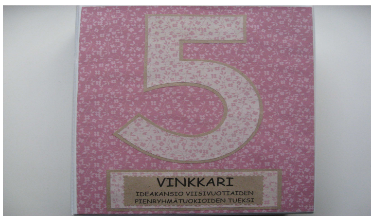
Kuva 2. Vinkkari-kansion ulkoasu.

Kansion hyväksymisen jälkeen tein viimeiset korjaukset sisällysluetteloiden osalta ja viimeistelin kansion ulkoasun. Kuvasin kansion, jotta sain liittää kuvan raporttiini. (Kuva 2.) Lokakuun loppupuolella annoin kansion Littoisten päiväkodinjohtajan arvioitavaksi ennen koululle luovuttamista.