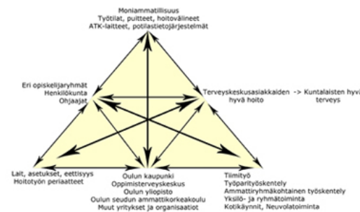
Kuvio 1. Moniammatillinen oppiminen oppimisterveyskeskuksessa (Engeström 1995, mukaellen)