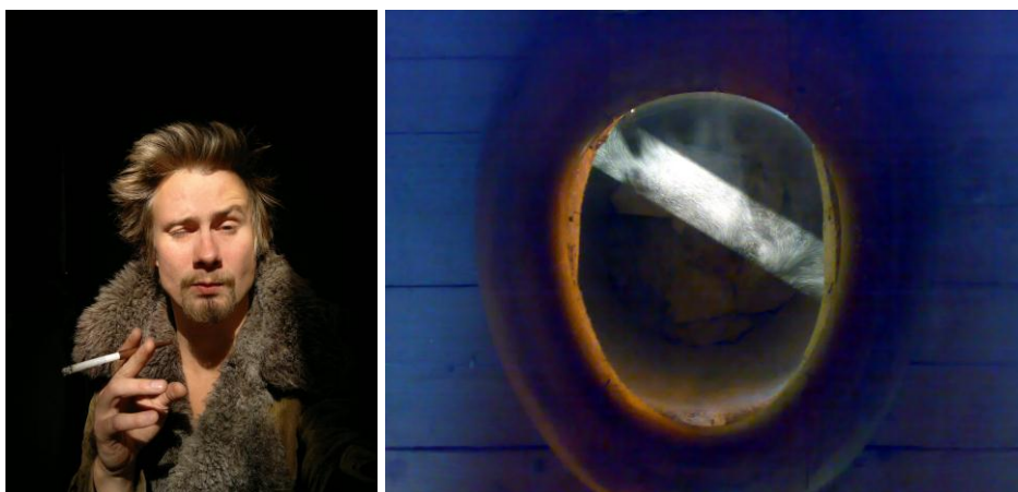
Kuva1. Omakuva istumassa ulkokuusissa. Kuva2. Pöntön sisältö.

Nopeasti tuotettu teospari: kaksi muotokuvaa yhdeltä istumalta.