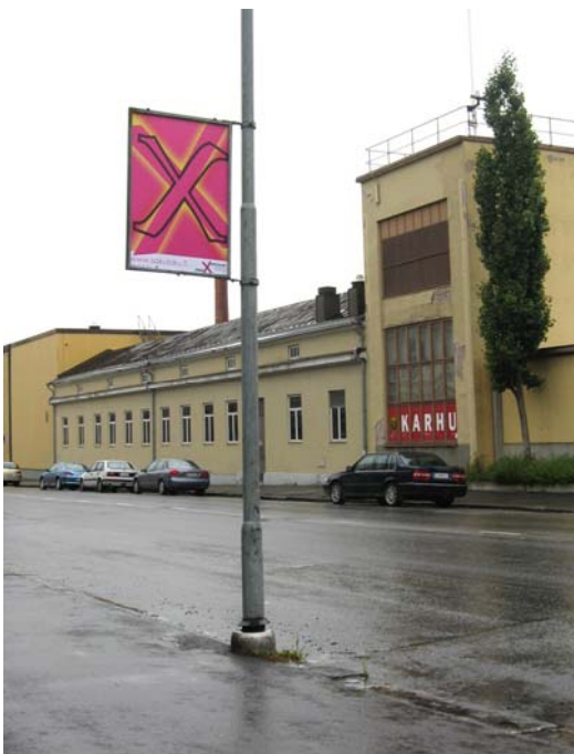
Kuva 11. Toinen pylväsmainos oli selkeämpi, muttei antanut tarpeeksi informaatiota.