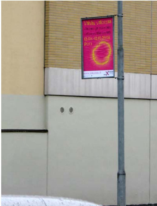
Kuva 10. Ensimmäinen pylväsmainos. Huonot sääolosuhteet rypistivät paperin ja luettavuus heikentyi.