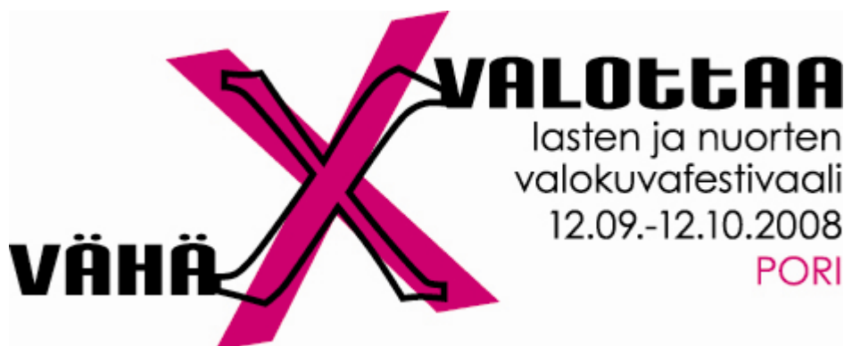
Kuva 4. Vähäx valottaa –logo