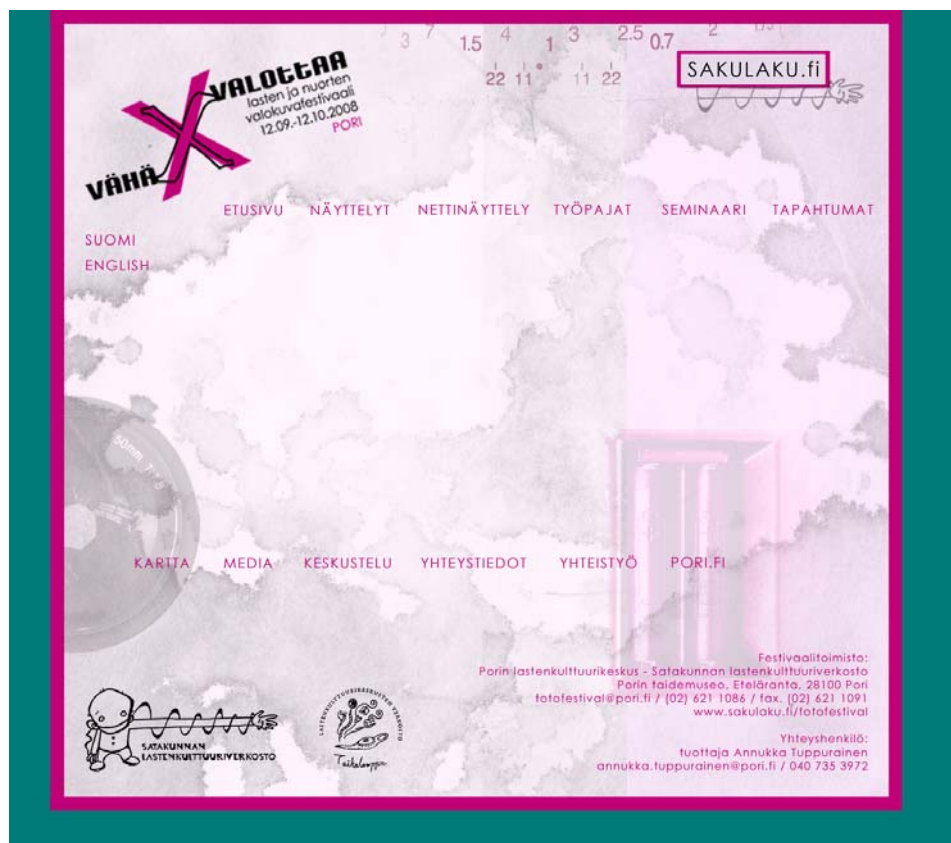
Kuva 6. Vähäx valottaa -sivuston etusivu. Koko näkymä on yksi kuva, paitsi navigointilinkit