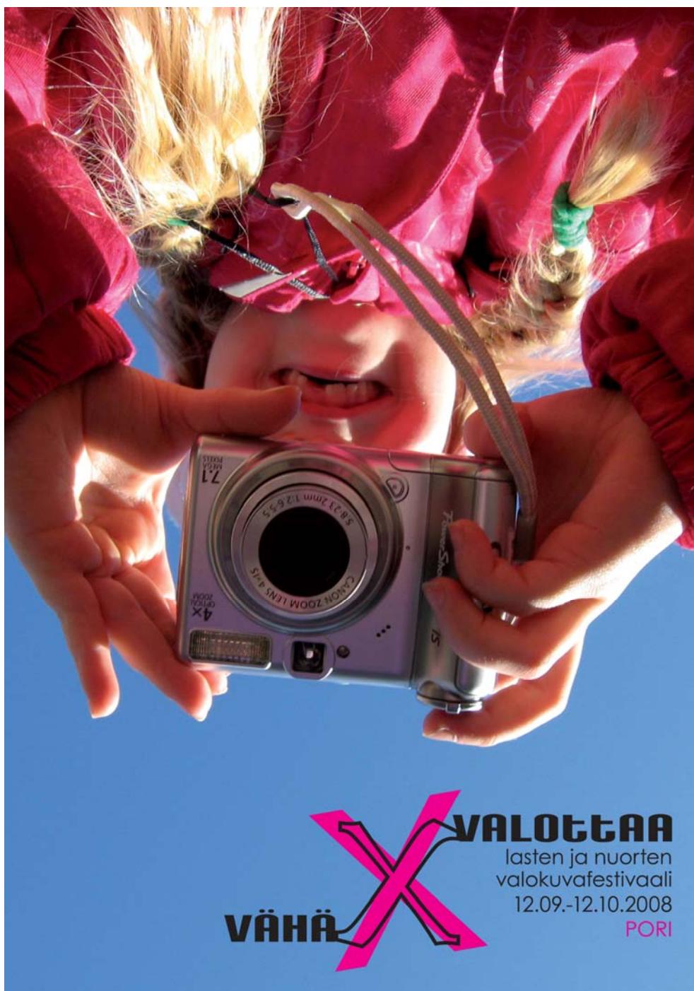
Kuva 8. Käsiohjelman kansi kertoo olennaisen festivaalin temasta.

ti ohjaa lukijaa kääntämään sivua. Silmän lukusuunta on vasemmalta oikealle ja suunta ylhäältä alas (Huovila 2006, 159). Kansi kiinnittää huomion ja kuvan ylösalainen mielikuva luo leikkisyyttä, käsiohjelmaa voi joutua kerran pyöryttämään ennen kuin huomaa, miten päin sitä tulee lukea.