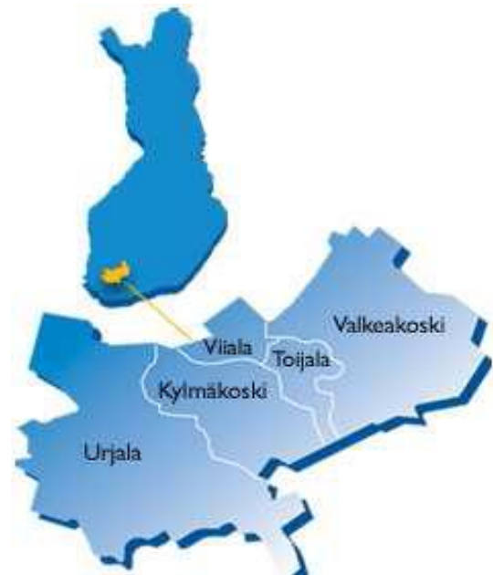
Kuva 2. Etelä-Pirkanmaan seutukunta vuonna 2006 (Pirkan Helmi ry 2012).

Kun Nuorten Ykspaja -toiminta alkoi vuonna 2006 noin 8 000 asukkaan Toijalassa (kuva 2.), julkinen liikenne toimi hyvin ja palvelut olivat tasavertaisesti tarjolla Toijalan keskustassa, jonne oli mahdollista jopa kävellä. Nykypäivänä toiminta on laajentunut Viialan ja Kylmäkosken alueille ja asukasmäärä on kasvanut yli 17 000 asukkaaseen. Yhdistymiset ovat saattaneet nuoret eriarvoiseen asemaan, sillä siellä missä toinen kävelee palveluiden luo, toinen joutuu etsimään oman kyydin, koska julkisilla kulkuneuvoilla ei pääse.