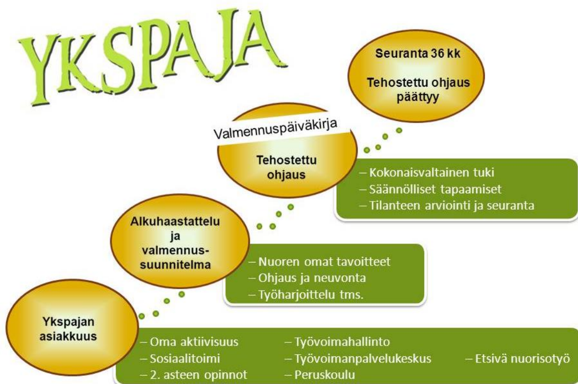
Kuva 3. Nuorten polku Nuorten Ykspajassa (Juutilainen 2012).

Kun nuori on päässyt tavoitteeseensa tehostetun ohjauksen jälkeen, hän siirtyy seurantaan. Seuranta tehdään Nuorten Ykspaja -toiminnassa 36 kuukautta. Sen tarkoituksena on seurata tehostetun ohjauksen vaikuttavuutta ja olla vielä nuoren elämässä läsnä. Lisäksi kaikille kansallista työpajavaltionavustusta saaneille tahoille lähetetään valtakunnallinen työpajakysely, jossa kysytään nuorten sijoittumista heti tehostetun ohjauksen jälkeen sekä nuorten sijoittumista yhden ja kahden vuoden jälkeen tehostetusta ohjauksesta. Seurantavaiheessa nuoreen ollaan yhteydessä ensimmäisen puolen vuoden aikana kuukausittain, seuraavan puolen vuoden aikana kolmen kuukauden välein, seuraavan vuoden aikana puolen vuoden välein ja lopuksi kolmen vuoden päästä.