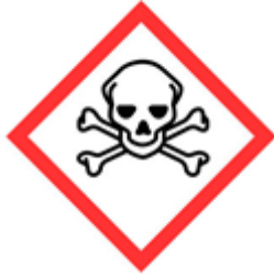
KUVA 2. Välitön myrkyllisyys.

Kassatyöntekijän työtä on helpottanut huomattavasti, kun lokakuusta 2011 lähtien myrkylliset ja erittäin myrkylliset kemikaalit on säilytettävä lukitussa tilassa. Polttoaineista kuitenkin vain metanolipitoista polttoainetta tulee säilyttää lukitussa tilassa. (KemikaaliA 3 §.) Kyseinen säädös helpottaa siten kassatyöntekijän työtä, etteivät alaikäiset saa tuotteita käsiinsä ja näin ikärajan noudattamista on helpompi valvoa.