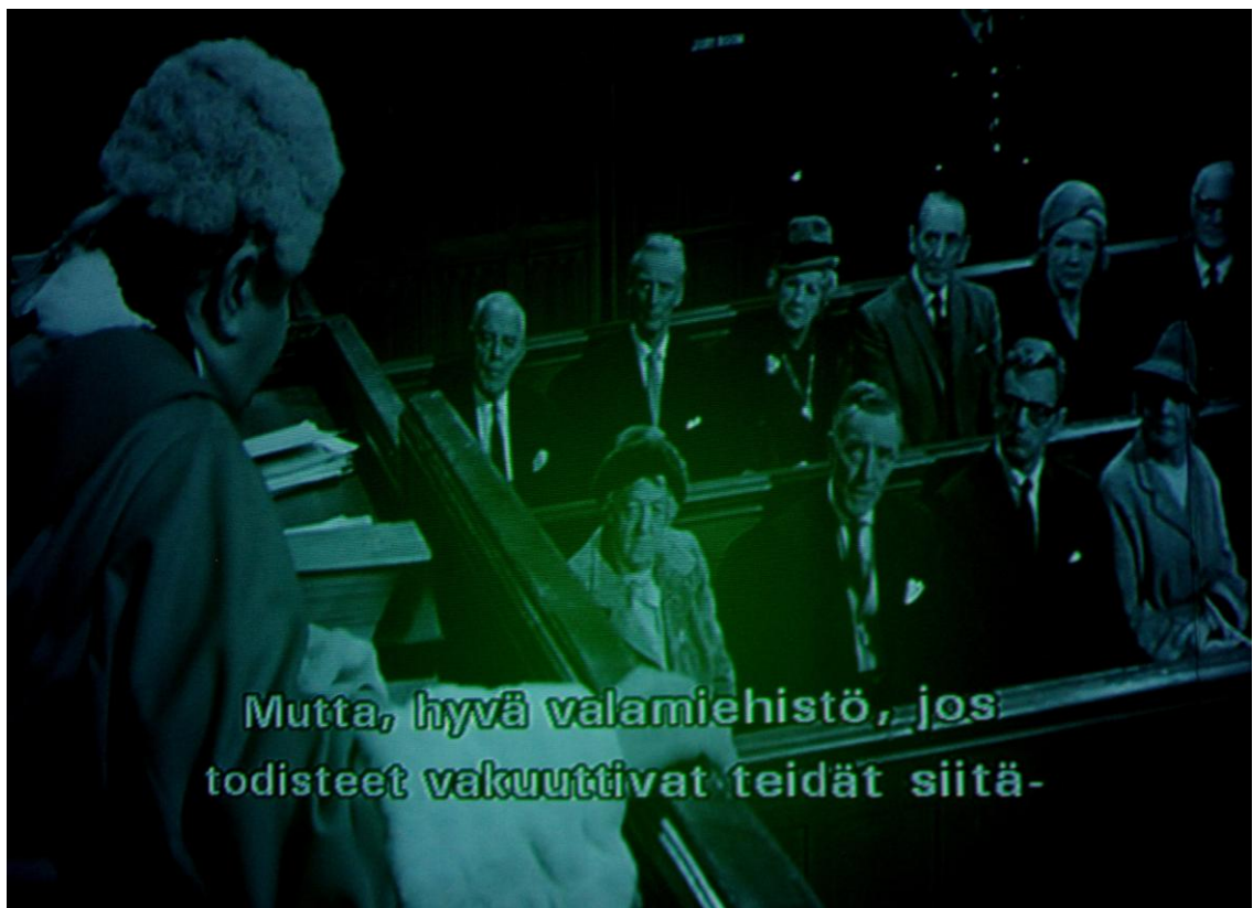
Kuvio 3. Kohtaus elokuvasta ”Murha teatterissa”.