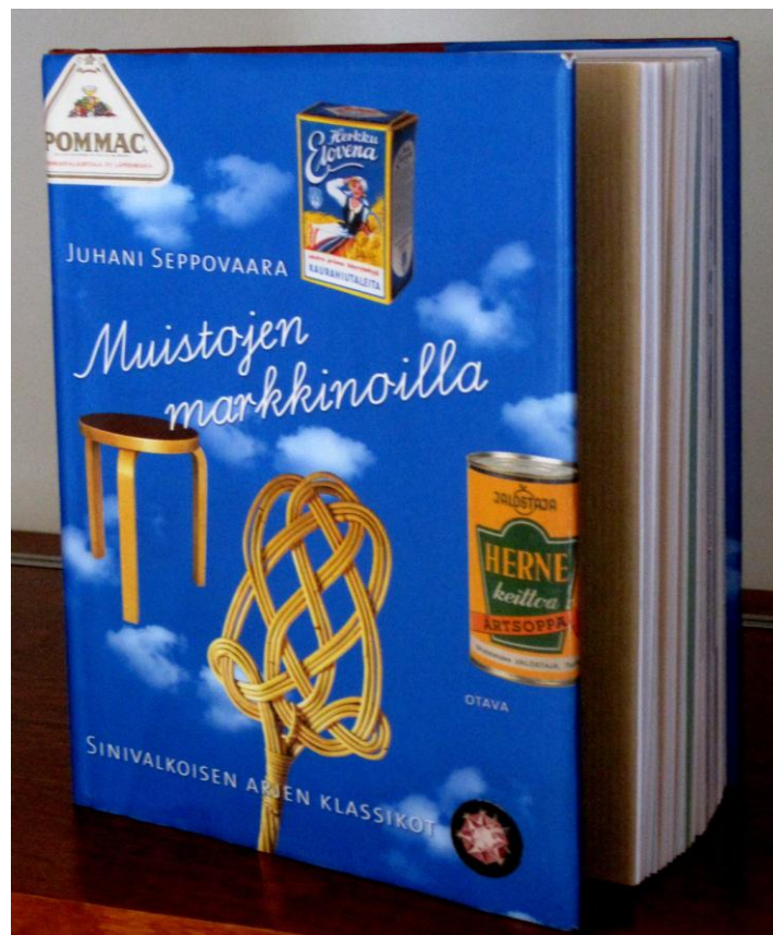
Kuvio 2. Juhani Seppovaara ”Muistojen markkinoilla – sinivalkoisen arjen klassikot” -kirja.

”Ylellinen sokeri arkistui” -kappale herätti keskustelua vanhan ajan sokerimerkeistä. Puristettu Pulmu- ja sahattu Sirkku -palasokerit toivat mieleen paljon lapsuuden ja nuoruuden muistoja, ja myös muistoja siitä, miten ensimmäinen maailmansota aiheutti pitkäaikaisen sokeripulan.