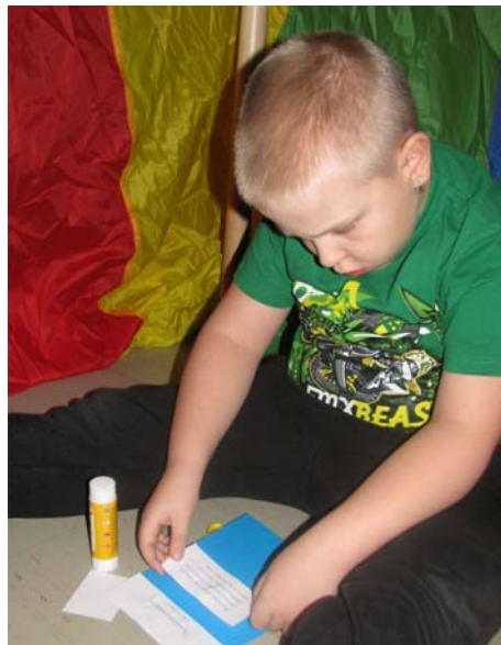
Askartelua salaisessa majassa