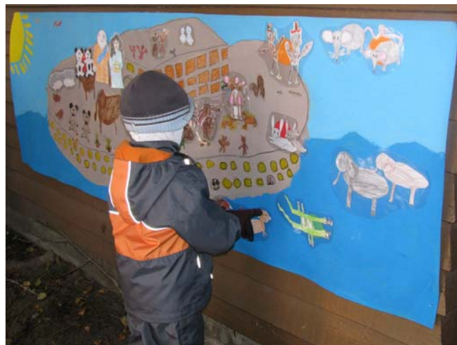
Nooan arkki ja eläinparit