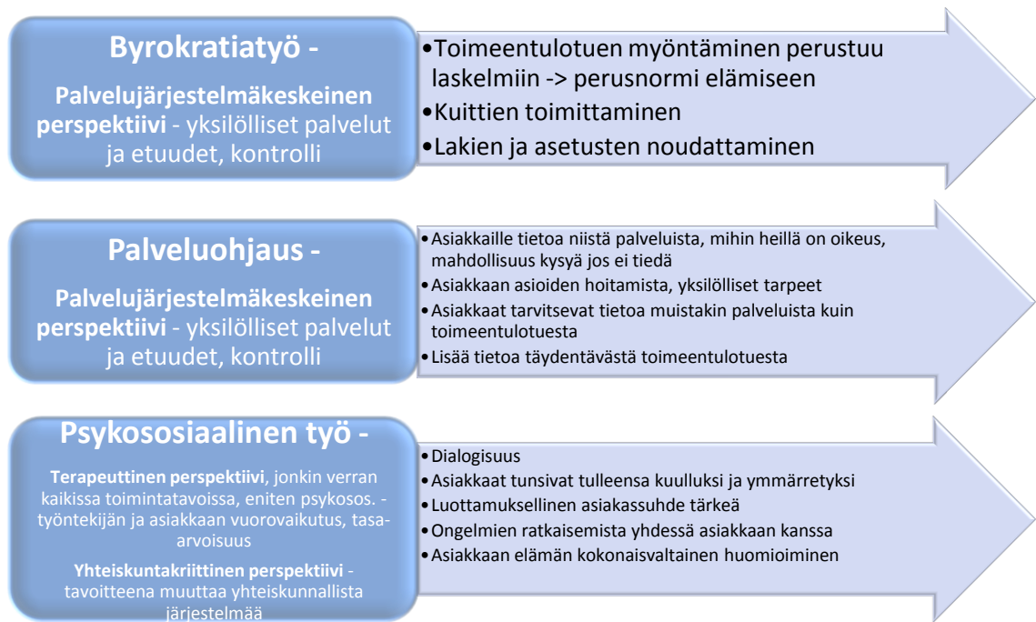
Kuvio 1. Toimintatavat ja toiminnalliset perspektiivit toimeentulotukityössä.

Toimeentulotukilaskelmaa tehtäessä huomioidaan asiakkaan tulot ja menot. Hänelle tulee jäädä perusosan suuruinen määrä kuukaudessa elämiseen. Jokaiselle asiakkaalle tehdään laskelma samoin perustein. Laskelman teko on byrokraattista, koska se perustuu erilaisiin sääntöihin ja ohjeisiin. Asiakkaan pitää toimittaa hakemuksen liitteenä erilaisia tositteita tuloista ja menosta. Tutkimuksessani tuli esille, että toimeentulotukiasiakkuudessa saattoi asiakkailla olla työntekijöiden kanssa erilaisia näkemyksiä, mutta toisaalta myös ymmärrettiin, että työntekijöiden velvollisuus on noudattaa lakeja ja asetuksia. Salosen (2010, 86) tutkimuksessa todettiin toimeentulotuen byrokraattisuus, mutta huomioitiin myös se, että toimeentulotuen saamista määrittävät erilaiset lait, joiden puitteissa työntekijän tulee toimia.