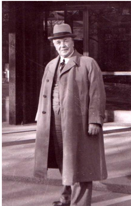
Kuvio 12. Kauppaneuvos Helsingin vierailulla