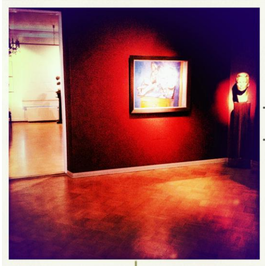
Kuvio 7. Tikanojan taidekoti