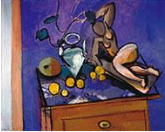
Kuvio 9. Matisse (Tikanojan taidekoti, 2012.)