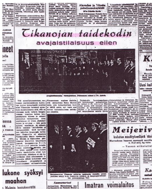
Kuvio 13. Lehtileike 1951