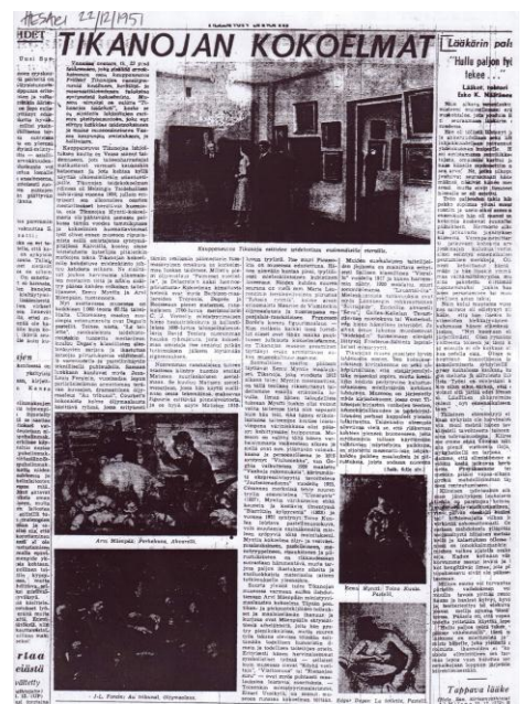
Kuvio 14. Lehtileike 1951