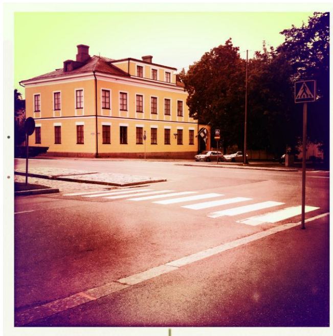
Kuvio 1. Tikanojan taidekoti, Hovioikeudenpuistikko 4