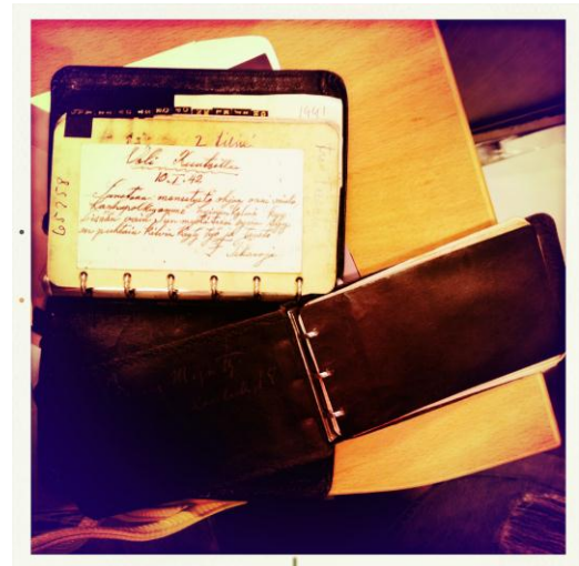
Kuvio 2. Kirjeitä taidekodin arkistossa Kuvio 3. Muistiinpanoja taidekodin arkistossa