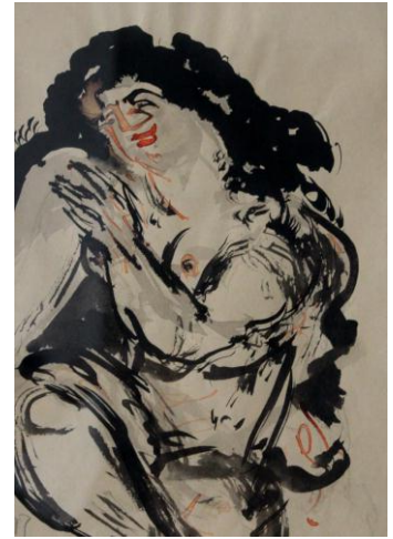
Kuvio 10. Myntti