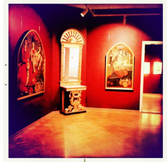
Kuvio 8. Tikanojan taidekoti

1930-luvulla kansainvälisten mestareiden teosten hinnat nousivat hurjasti, harvalla oli varallisuutta hankkia tauluja kokoelmiinsa. Näin ollen Tikanojan kokoelman luonne määräytyi jo 1920-luvulla. Vaikka taidekokoelman luonne määräytyi jo varhaisessa vaiheessa, ei Tikanojan alkuperäisenä tarkoituksena ollut tehdä kokoelmasta julkista. (Salin & Catani 2001, 24.)