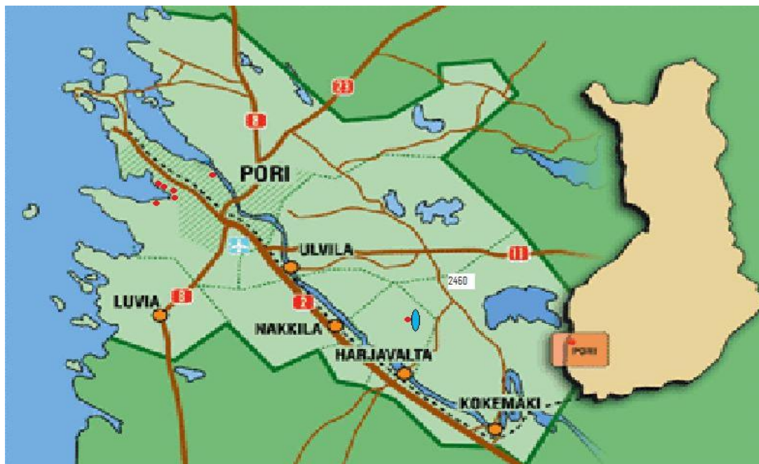
Kuva 4. Kuva karttapohjista ja yrityksestä sijoittaa siihen Karhuseudun luontomatkailukohteita.