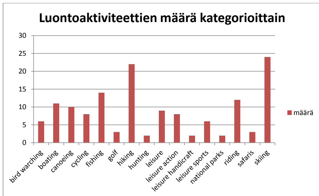
Kuva 2. Luontoaktiviteettien määrä kategorioittain.

kahdeksan pyöräilyreittiä ja pyöräily-yhdistystä Karhuseudun alueelta. Kalastus- osissa (fishing) on listattuna 14 kalastuskohdetta. Veneily-kohtaan (boating) on koottuna 11 veneilykohdetta käsittäen veneen vuokraajia, venematkojen järjestäjiä ja veneily-yhdistyksiä. Golf-aktiviteetteja (golf) on listattuna kolme. Vaeltaminen-osio (hiking) on laaja, siihen on koottuna 22 vaellusreittiä, yhdistystä ja ulkoilualan ylläpitäjää. Kansallispuistoja (national parks) Karhuseudun alueella on kaksi, eli Puurijärven- Isosuon kansallispuisto ja Selkämeren kansallispuisto. Ratsastusaktiviteetteja (riding) tarjoavia yrityksiä alueella oli yhteensä kaksitoista, suurin osa Suomen Ratsastajainliiton hyväksymiä harraste – ja koulutalleja. Metsästyspalveluita (hunting) matkailullisessa ja kaupallisessa mielessä tarjoavia yrityksiä oli kaksi. Alueelta löytyy monia erä – ja metsästysyhdistyksiä, mutta niitä en kartoitukseen koonnut, sillä metsästysyhdistysten toiminta on yleensä jäsenille suunnattua. Hiihtoaktiviteetteja ja reittejä (skiing) listauksessa on 24, mukana on myös hiihtoyhdistyksiä ja hiihtoseuroja. Safaripalveluiden tarjoajia (safaries) listauksessa on kolme yritystä. Vapaa-ajan ja toiminnan (leisure, leisure action, leisure handicraft, leisure sports) kategorioihin tietoja olisi varmasti voinut listata loputtomasti, mutta pyrin noudattamaan luontomat- kailuaktiviteetin teoriamääritelmää ja listata vain siihen sopivat. Tällaisia aktiviteetteja sain kerättyä yhteensä 25 kappaletta.