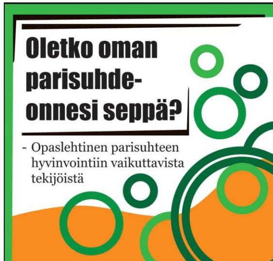
Kansilehti, todellinen koko 7 cm x 7 cm