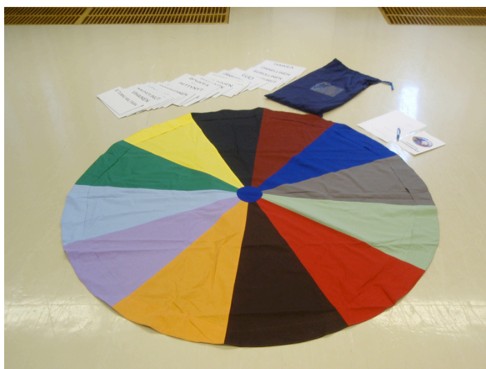
Kuva 4 – Tunnepyörä