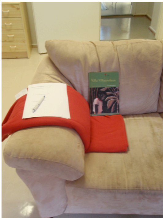
Kuva 3 – Ville Vilkastuksen tunneseikkailu