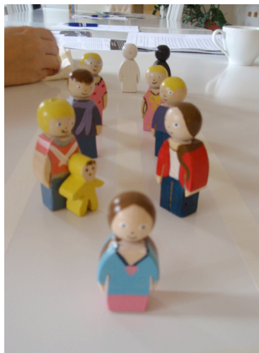
Kuva 7 - Tejping-nuket