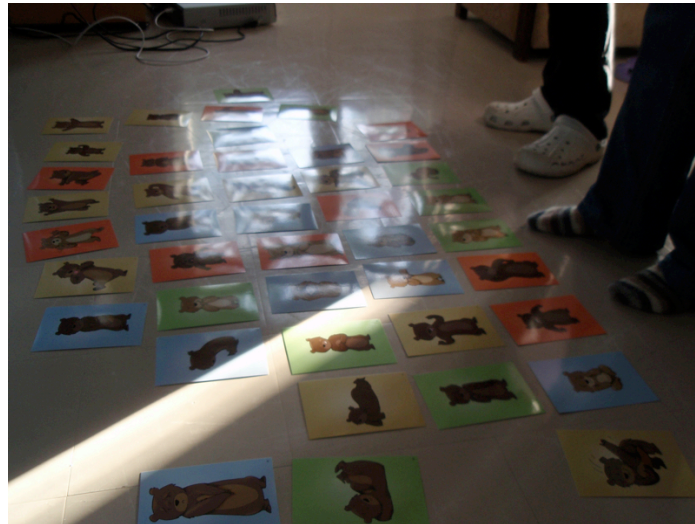
Kuva 1 - Nallekorttien valinta