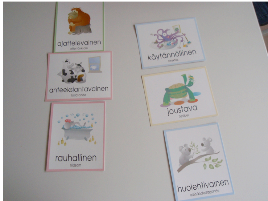
Kuva 8 - Kehittämispäivästä - Lasten vahvuuskortit