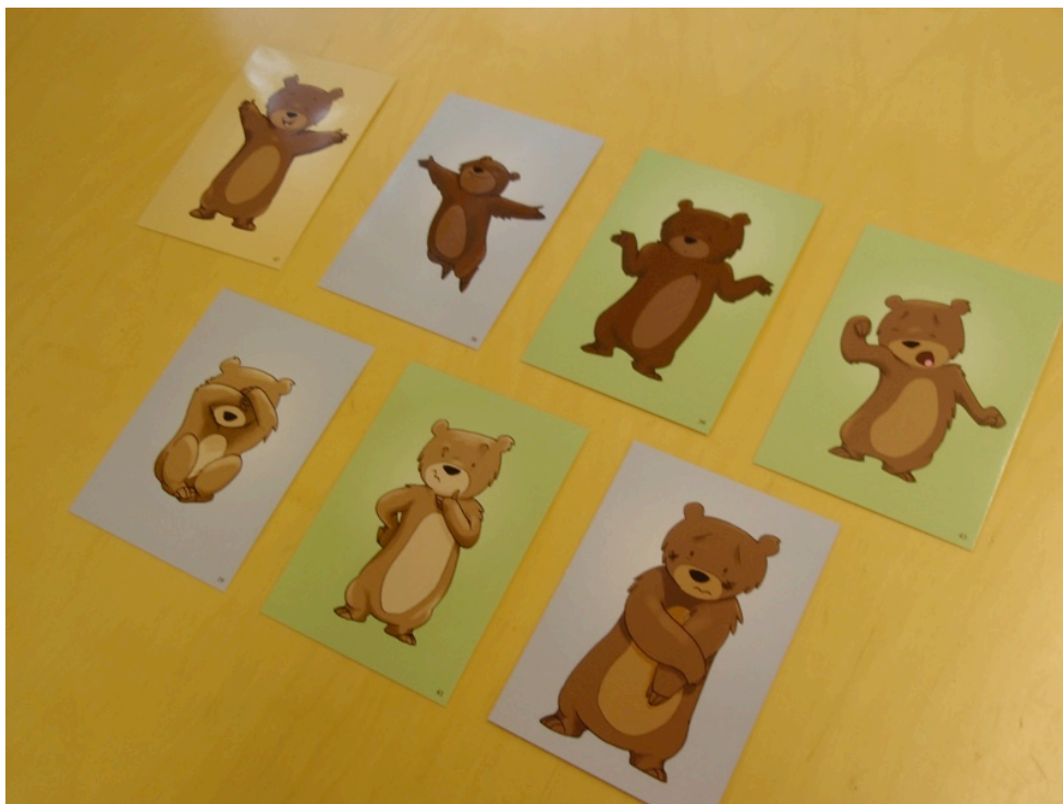
Kuva 2 – Nallekortit kehittämispäivän aluksi