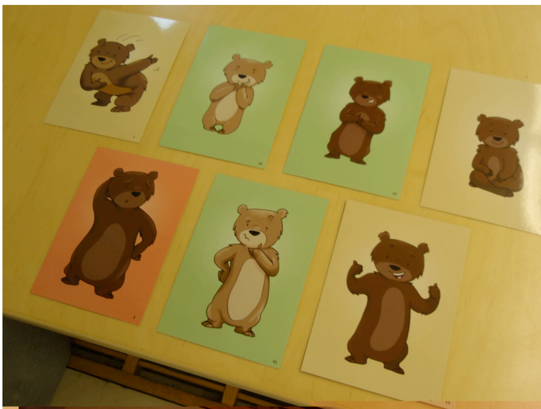
Kuva 9 - Nallekortit kehittämispäivän loppuksi