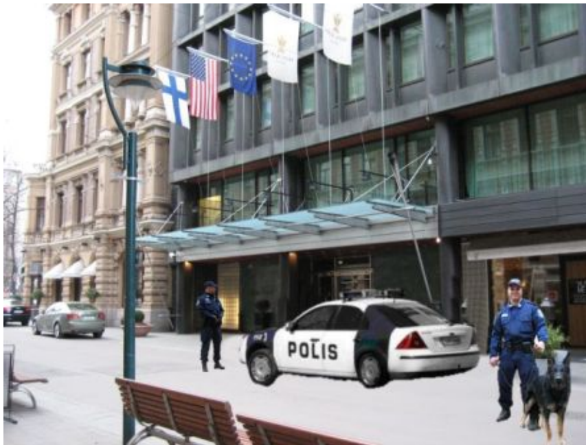
Kuva 25: D3

D-sarjan kolmatta kuvaa pidettiin yleisesti turvallisena ja tavallisena. Yhdeksän diplomaattia piti tilannetta turvallisena tai tavallisena. Synä tähän oli mielikuva tärkeästä vieraasta hotellissa, ja kyseessä on tunnettu hotelli. Yhden diplomaatin mielestä kuva aiheutti korotetun varovaisuuden, mutta poliisi turvasi turvallisuuden, koska poliisi oli rento eikä poliisiautossa ollut välkkyviä valoja. Viisi diplomaattia piti tilannetta melkein samanlaisena kuin D-sarjan toisessa kuvassa, mutta enemmän hämmentävänä tai vähän turvattomampana. Yhden diplomaatin mielestä poliisit tekivät työtään, eikä sillä ollut väliä oliko paikalla yksi vai kymmenen poliisia. Yhden diplomaatin mielestä kuvassa oli liikaa pelottavia poliiseja, eikä hän menisi tilanteeseen. Yhden diplomaatin mielestä kuva tilanne ei ollut normaali. Yhden diplomaatin mielestä tilanne aiheuttaisi korotetun varovaisuuden.