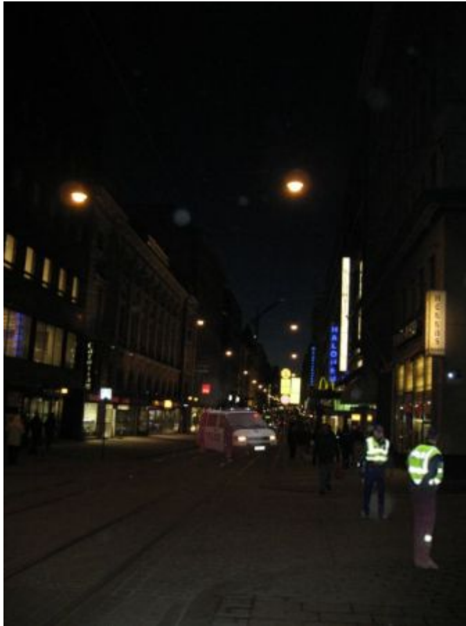
Kuva 21: C5

C-sarjan viidettä kuvaa pidettiin yleisesti vältettävänä, huolestuttavana tai outona. Viiden diplomaatin mielestä tilannetta tulisi välttää, ettei joutuisi itse osalliseksi. Kuuden diplomaatin mielestä tilanne ei ole kovin vaarallinen tai se on turvallinen ja tavallinen. Kahden diplomaatin mielestä tilanne on epätodennäköinen jopa epätodellinen, mutta silti turvallinen. Yksi diplomaatti olisi varovainen tilanteen johdosta. Yhden diplomaatin mielestä tilanne ei tunnu turvalliselta verrattuna C-sarjan neljänteen kuvaan. Yksi diplomaatti olisi huolestunut ja ihmetteli, mitä on tapahtunut, koska paikalla on poliiseja ja poliisiauto. Yhden diplomaatin mielestä jotain on pielessä tai joku korkea-arvoinen henkilö on ajamassa ohi. Hän tuntisi olonsa turvallisemmaksi tässä kuvassa kuin C-sarjan neljännessä kuvassa, koska poliisit ovat paikalla.