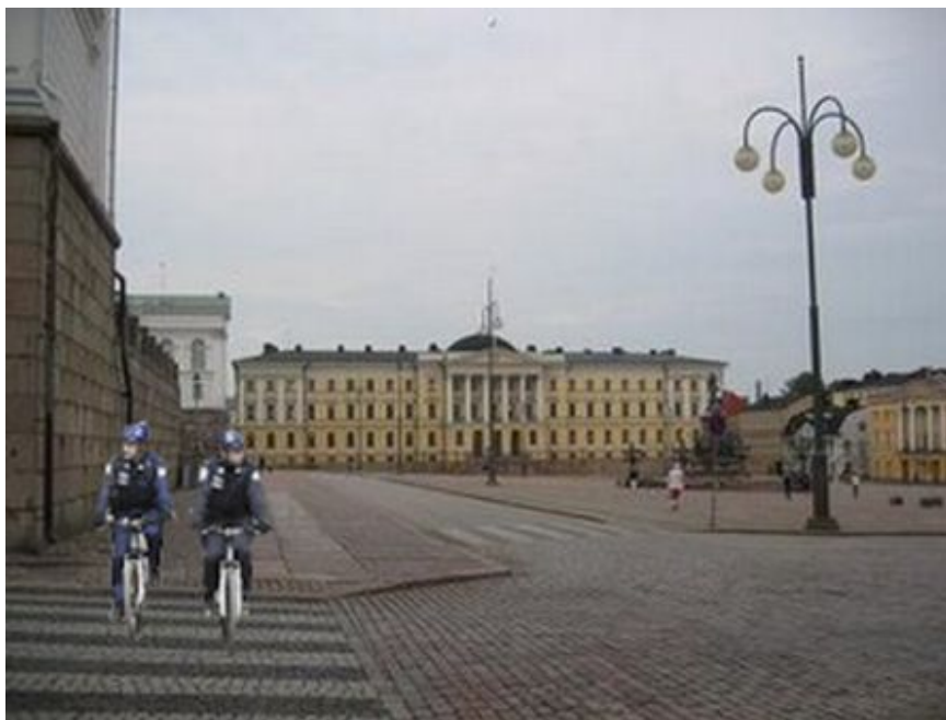
Kuva 4: A4

17 diplomaateista ei pitänyt kuvan tilannetta turvattomana. Ainoastaan yhden diplomaatin mielestä kuvassa oli turvallisuustoimenpiteitä liioiteltu. Melkein puolet diplomaateista ajatteli, että polkupyöräpoliisit olivat partioimassa. Kuvan tilannetta kuvailtiin muun muassa sanoilla: ok, normaali, turvallinen, kiva, vapautunut ja rento. Yksi diplomaatti koki poliisien