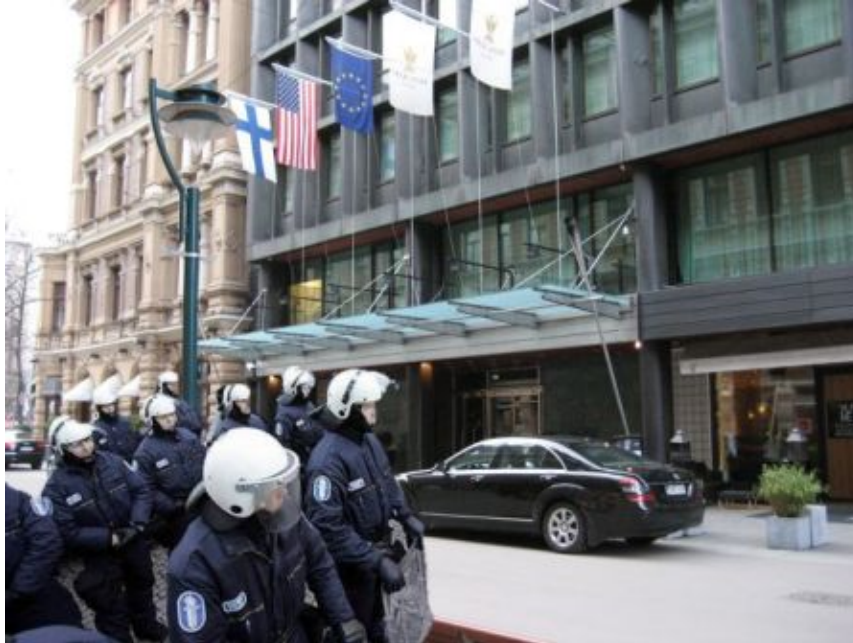
Kuva 27: D5

D-sarjan viidettä kuvaa pidettiin lähinnä joko huolestuttavana tai turvallisena. Viisi diplomaattia olisi tilanteessa huolestunut tai olettaisi jotain tapahtuneen. Kuusi diplomaattia piti tilannetta normaalina tai turvallisena. Yhden diplomaatin mielestä tilanne ei ole normaali ja protestoijat yrittävät päästä sisään hotelliin. Neljä diplomaattia lähtisi pois alueelta ja yksi heistä ei tuntisi oloaan turvallisiksi. Yksi diplomaatti ei oikein ymmärtänyt kuvaa, mutta ei pelkäisi tilannetta vaan olisi utelias. Yksi diplomaatti ei vastannut mitään. Turvattomuutta, huolestuneisuutta tai varovaisuutta aiheuttivat lähinnä poliisien varustus kuten kilvet ja kypärät sekä poliisien määrä. Huolestuneisuutta aiheutti myös poliisien valmistautuneisuus. Diplomaateilta kysyttiin kuvan yhteydessä, mitä mieltä he olisivat, jos sama määrä poliiseja olisi hotellin aulassa tavallisissa univormuissa. Tähän vastattiin yleisesti, että se olisi turvallista etenkin, jos hotellissa olisi tärkeitä vieraita. Yksi diplomaatti pitäisi univormukuisten poliisien aulassa oloa tavallisuudesta poikkeavana, ellei esimerkiksi USA:n presidentti olisi paikalla. Yksi diplomaatti pelkäisi, jos poliisit olisivat hotellin aulassa normaaleissa univormuissa.