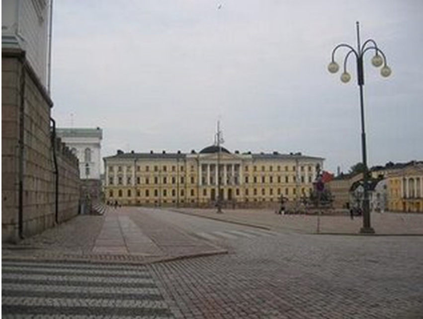
Kuva 2: A2

Kuva on täysin autio. Siinä ei ole autoja eikä ihmisiä lainkaan. Suurin osa eli 11 diplomaateista koki kuvan tilanteen edelleen rauhallisena, hyvänä, ok:na, normaalina tai turvallisena. Näistä yhden diplomaatin mielestä tilanne muuttui jopa turvallisemmaksi edelliseen kuvaan verrattuna. Neljä diplomaattia piti tilannetta joko todella outona, epänormaalina, turvattomana tai vähemmän turvallisena kuin edellisen kuvan tilannetta. Yksi diplomaatti pelkästään kommentoi, että kuva on autio. Yksi diplomaatti ajatteli, että häneltä oli ehkä mennyt ohi jokin hälytys tai varoitus esimerkiksi alkavasta sodasta. Jos kyse ei olisi siitä, tilanne tuntuisi hänestä turvalliselta. Yhdellä diplomaatilla ei ollut kuvasta erityistä mainittavaa.