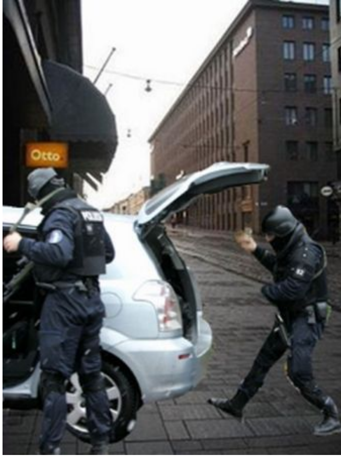
Kuva 16: B6

Diplomaateista 13 kuvaili kuvan tilannetta tai tunnettaan muun muassa seuraavasti: turvaton, vaarallinen, turvallisuustoimenpiteet liioiteltuja, todella hermostuttava, epämukava, pelottava, pahempi tai turvattomampi kuin edellisen kuvan tilanne. Ainoastaan kaksi diplomaattia kuvaili tilannetta normaaliksi tai ei vakavaksi. Yksi diplomaatti pelkästään kommentoi tilanteen olevan kuin elokuvasta ja kaksi ihmetteli, mitä tapahtuu. Yhteensä seitsemän kaikista diplomaateista lisäksi kommentoi tämän kuvan B6 tilannetta joko pahemmaksi, turvattommaksi tai turvallisuustoimenpiteitä liioitellummiksi kuin edellisessä kuvassa B5. Vastaavasti kaksi diplomaattia kommentoi tämän kuvan B6 tilannetta joko vähemmän pelottavaksi tai vähemmän pahaksi kuin kuvan B5 tilannetta.