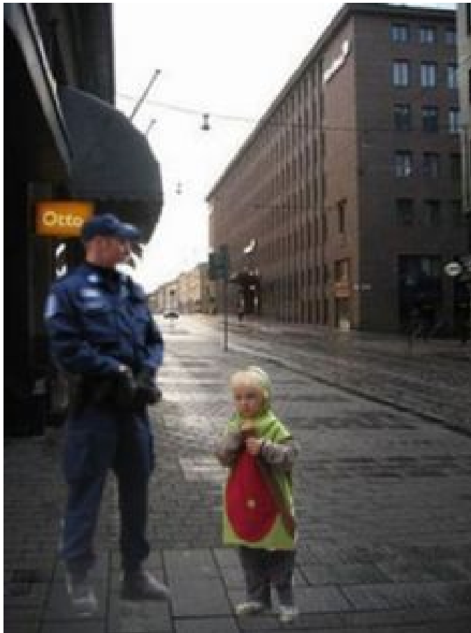
Kuva 11: B1