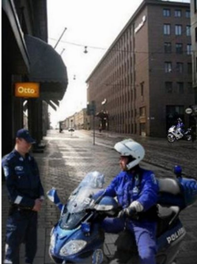
Kuva 14: B4

Kymmenen diplomaattia kuvaili kuvan tilannetta tai tunnettaan muun muassa seuraavasti: normaali, ei paha, ei vaarallinen, ok, ei epäilyttävä ja turvallinen. Yksi heistä kommentoi tämän kuvan B4 tilannetta myös turvallisemman tuntuiseksi kuin edellisen kuvan B3 tilannetta. Yksi diplomaatti kuvaili selkeästi tilannetta turvattomaksi, yksi sanoi kuvassa olevan liikaa poliiseja ja yksi kommentoi pientä varovaisuutta tarvittavan. Viisi diplomaateista ei kuvaillut tilannetta turvallisesti tai turvattomaksi tai millään muullakaan adjektiivilla. He ainoastaan arvelivat, että joku korkea-arvoinen henkilö saattueineen on ehkä kulkemassa ohi tai on tapahtunut ryöstö tai poliisin paikalla olo muuten vain ihmetytti.