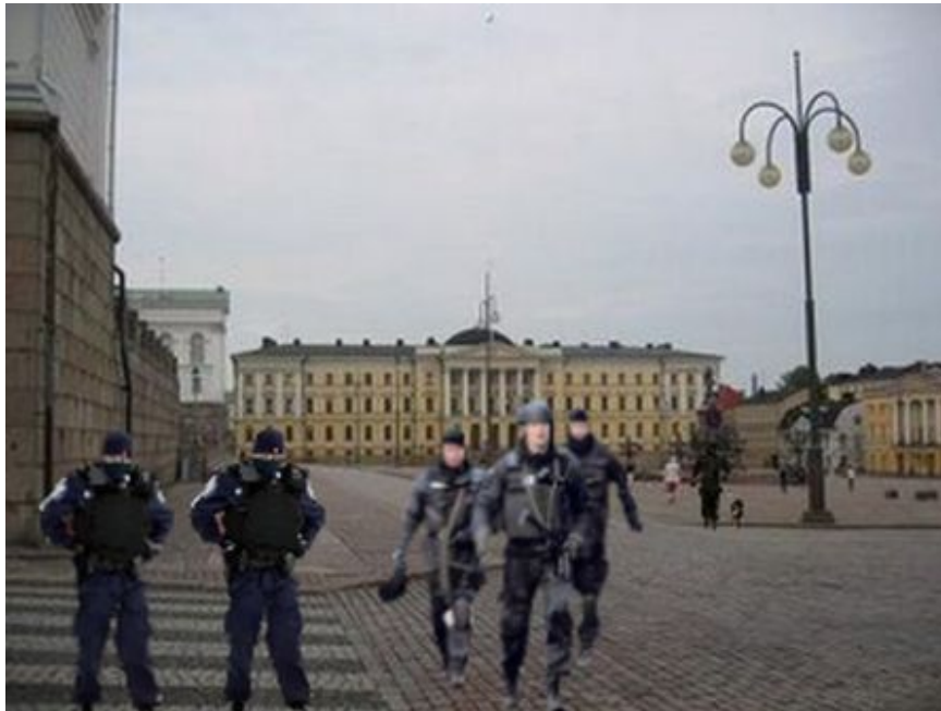
Kuva 10: A10

Kolme diplomaattia ainoastaan kommentoi, että kyseessä oli poliisien harjoitus tai koulutus. Yksi heistä sanoi tuntevänsä olonsa myös turvallisiksi. Yksi diplomaatti kommentoi olonsa olevan hiukan turvallisempi kuin edellisen kuvan tilanteessa. Loput 14 diplomaateista kuvailivat kuvan tilannetta tai tunnettaan muun muassa seuraavasti: vaarallinen, turvaton, ei hallinnassa, liioitellut turvallisuustoimenpiteet, huolestuttava, pelottava, levoton, outo, paha tai pahempi kuin edellisen kuvan tilanne. Eli selkeästi valtaosa diplomaateista piti kuvan tilannetta enemmän turvattomana kuin turvallisena. Kuitenkin kolme heistä kommentoi edellisen kuvan A9 tilanteen olleen joko huolestuttavampi tai pelottavampi tai turvallisuustoimenpiteiden liioitellumpia kuin tässä kuvassa A10. Kolme diplomaattia puolestaan kommentoi tilannetta joko vaarallisemmaksi tai pahemmaksi kuin edellisessä kuvassa A9 ja kaksi diplomaattia kommentoi tämän kuvan A10 tilannetta kaikista A-sarjan kuvien tilanteista pahimmaksi tai turvattomimmaksi.