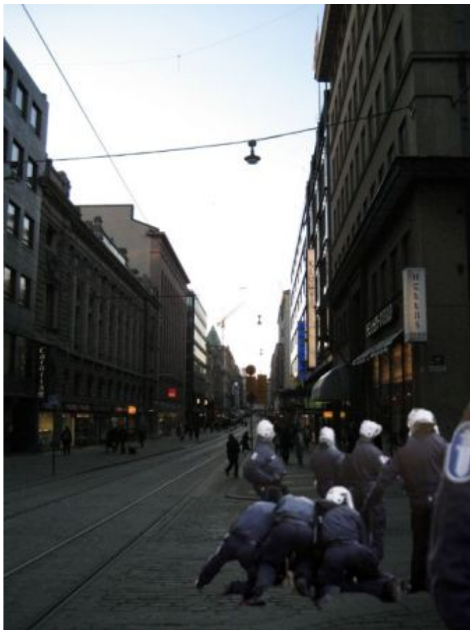
Kuva 19: C3

C-sarjan kolmatta kuvaa pidettiin yleisesti epänormaalina tai vältettävänä tilanteena. Viiden diplomaatin mielestä tilanne ei ollut normaali tai se oli epätavallinen Suomessa. Kolmen diplomaatin mielestä tilanne ei vaikuta vaaralliselta ainakaan yleisesti. Yhtä diplomaattia tilanne ihmetytti. Neljä diplomaattia välttäisi tilannetta tai siirtyisi pois tilanteesta. Yhden diplomaatin mielestä tilanteessa oli liikaa poliiseja. Yhden diplomaatin mielestä tilanne oli rauhaton ja jotain oli tapahtumassa. Kaksi diplomaattia huolestuisi ja selvittäisi, mitä on tapahtunut. Yksi diplomaatti huolestuisi, koska jotain on tapahtumassa eikä tuntisi oloaan kovinkaan turvalliseksi, koska lähistöllä voi olla joku toinenkin henkilö, jota poliisi yrittää saada kiinni.