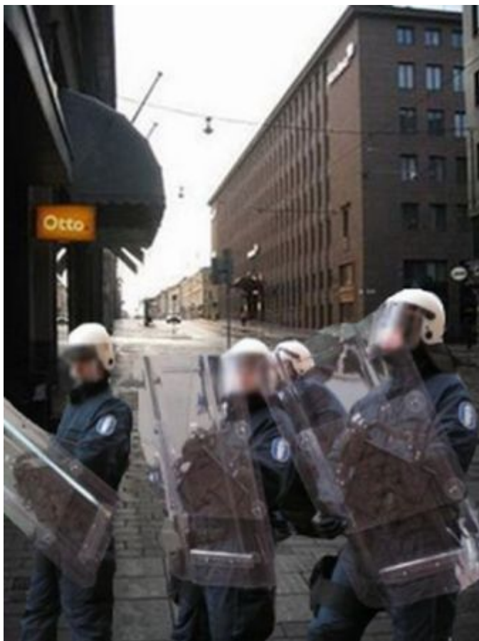
Kuva 15: B5

Diplomaateista 13 kuvaili kuvan tilannetta tai tunnettaan muun muassa seuraavasti: ei hyvä, varovaisuutta lisäävä, vaarallinen, huolestuttava, arveluttava, vältettävä, paha, turvaton tai pelottava. Kolme diplomaattia ainoastaan kommentoi poistuvansa paikalta. Yksi diplomaatti