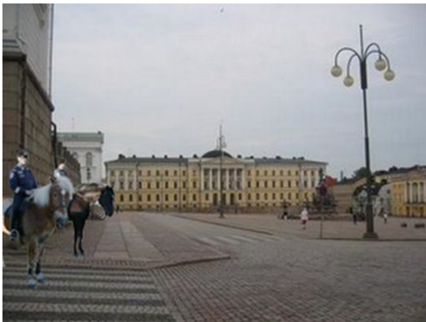
Kuva 3: A3

Suurin osa eli 11 diplomaateista kuvaili kuvan tilannetta tai tunnettaan muun muassa seuraavasti: turvallinen, normaali, ei häiritsevää tai ok. Kaksi näistä diplomaateista joko koki tilanteen tai tunsivat olonsa turvallisemmaksi poliisin läsnäolon ansiosta. Yksi diplomaatti taas tunsivat olonsa levottomaksi samasta syystä. Hän koki tilanteen vähemmän turvallisena verrattuna edelliseen kuvaan. Osa diplomaateista ajatteli, että ratsupoliisit partioivat aukiolla. Kolme vastaajaa pelkästään pohti, että ratsupoliisit liittyvät ehkä johonkin tapahtumaan, korkearvoiseen henkilöön tai mielenosoitukseen. Yksi ainoastaan mietti, miksi poliisi on paikalla. Yhdellä diplomaatilla ei ollut kuvasta erityistä mainittavaa. Yksi pelkästään kommentoi, että poliisit vain seuraavat tilannetta.