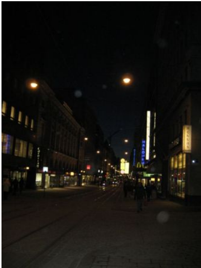
Kuva 20: C4