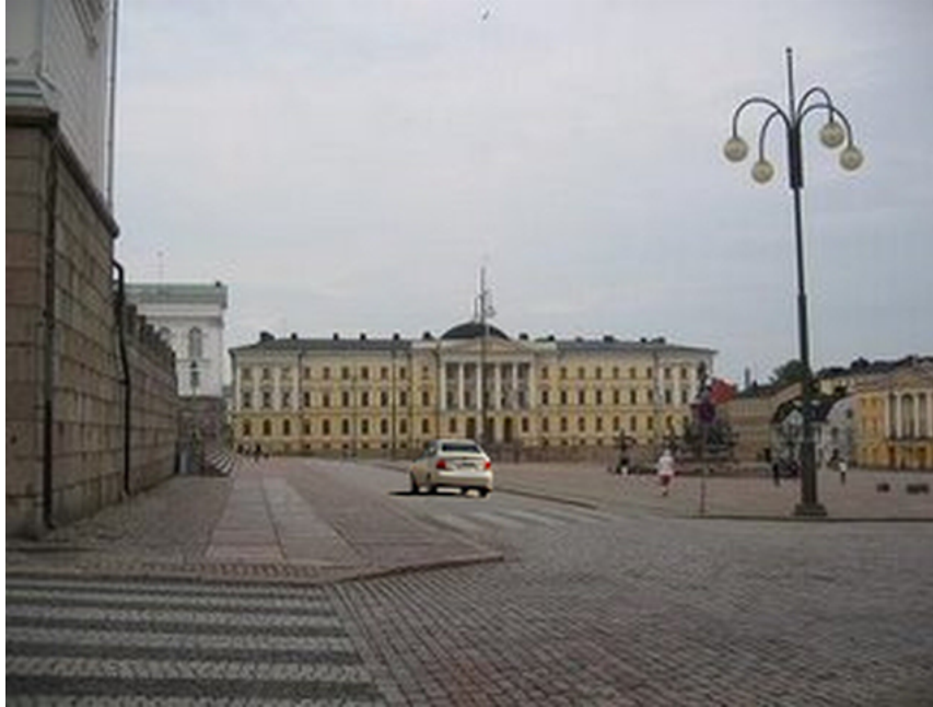
Kuva 1: A1

Suurin osa eli kolmetoista diplomaateista koki kuvan tilanteen normaalina, rauhallisena tai turvallisena. Kolme diplomaattia piti sitä outona tai turvattomana, koska kuvassa oli liian autiota. Tähän voi osin vaikuttaa ihmisen kulttuuristausta. Jos on asunut hyvin väkirikkaissa kaupungeissa ja tottunut ihmispaljouteen, voi tällainen tilanne olla outo ja turvaton, jopa surullinen, kuten yksi näistä diplomaateista lisäksi tilannetta kuvaili. Yhden diplomaatin mielestä tilanne olisi ollut normaali esimerkiksi sunnuntaiamupäivänä, muttei maanantai-iltapäivänä. Yhdellä diplomaatilla ei ollut kuvasta erityistä mainittavaa.