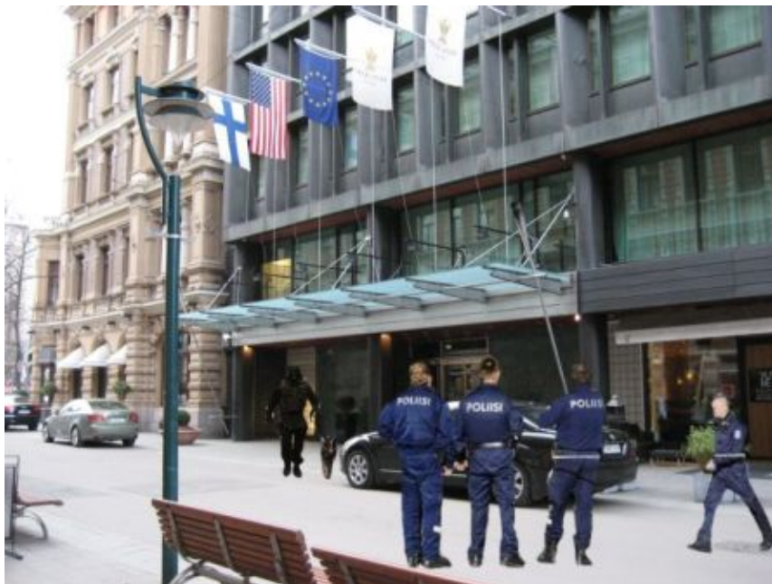
Kuva 26: D4

D-sarjan neljännen kuvan tilanteen näkemykset vaihtelivat paljon. Kuusi diplomaattia piti tilannetta turvallisena tai tavallisena. Kahden diplomaatin mielestä tilanne oli pelottava, koska tilanteessa oli liikaa poliiseja ja paikalla oli erikoisjoukkoja. Näistä kahdesta kumpikaan ei uskaltaisi mennä hotelliin sisään, vaikka heillä olisi siellä kokous ja toisen heistä mielestä turvallisuus paranisi, jos poliiseilta poistaisi univormut. Kahden diplomaatin mielestä tilanne oli huolestuttava. Yhden diplomaatin mielestä oli tapahtunut jotain ja turvallisuutta nostettiin vieraiden takia. Kolmen diplomaatin mielestä tilanne oli epärealistinen tai