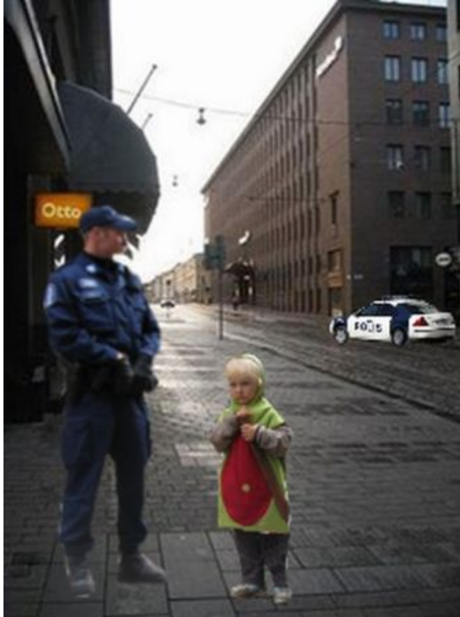
Kuva 12: B2

Yhden diplomaatin mielestä kuvan turvallisuustoimenpiteet olivat liioiteltuja poliisiauton vuoksi. Yksi diplomaatti vain kuvaili tilannetta omituiseksi ja epätavalliseksi. Yksi vastaaja epäili kyseessä ehkä olleen onnettomuuden ja yksi vastaaja pelkästään ihmetteli, mitä oli tapahtunut. Suurin osa eli 14 diplomaateista piti tilannetta kuitenkin edelleen enemmän turvallisena kuin turvattomana. Yhden heistä mielestä tilanne oli muuttunut jopa parempaan suuntaan edelliseen kuvaan verrattuna, jossa ei ollut tässä kuvassa esiintyvää poliisiautoa. Joidenkin diplomaattien mielestä poliisiauto aiheutti päinvastoin hämmennystä, mitä oikein oli tapahtumassa.