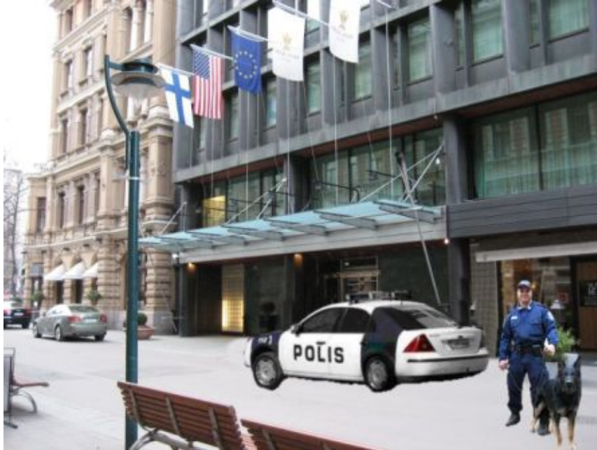
Kuva 24: D2

D-sarjan toista kuvaa pidettiin yleisesti normaalina ja turvallisena. Kymmenen diplomaatin mielestä tilanne oli normaali tai turvallinen, ja poliisit hoitivat vain työtään. Yhden diplomaatin mielestä tilanteesta oli hiukan enemmän turvallisuutta kuin D-sarjan ensimmäisessä kuvassa, mutta lähellä ei ollut vip-autoa. Yhden diplomaatin mielestä tilanne oli liikaa, ellei kyseessä ollut konferenssi. Kyseinen diplomaatti pitää vähemmän näkyvästä turvallisuudesta. Yhden diplomaatin mielestä tilanne ei ole normaali. Yhden diplomaatin mielestä jotain on tapahtunut. Viiden diplomaatin mielestä hotellissa on tärkeitä vieraita tai konferenssi. Yhden diplomaatin mielestä poliisikoira saattaa olla paikalla pommiuhan takia, ja kyseinen diplomaatti kävelisi tilanteen ohi. Yhden diplomaatin mielestä tilanteesta on kyse huumeiden tai räjähteiden etsimisestä koirasta päätellen, mutta tilanne on hyvin hallinnassa poliiseilla.