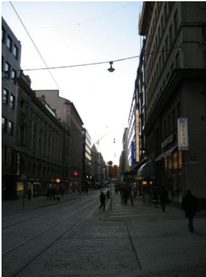
Kuva 17: C1