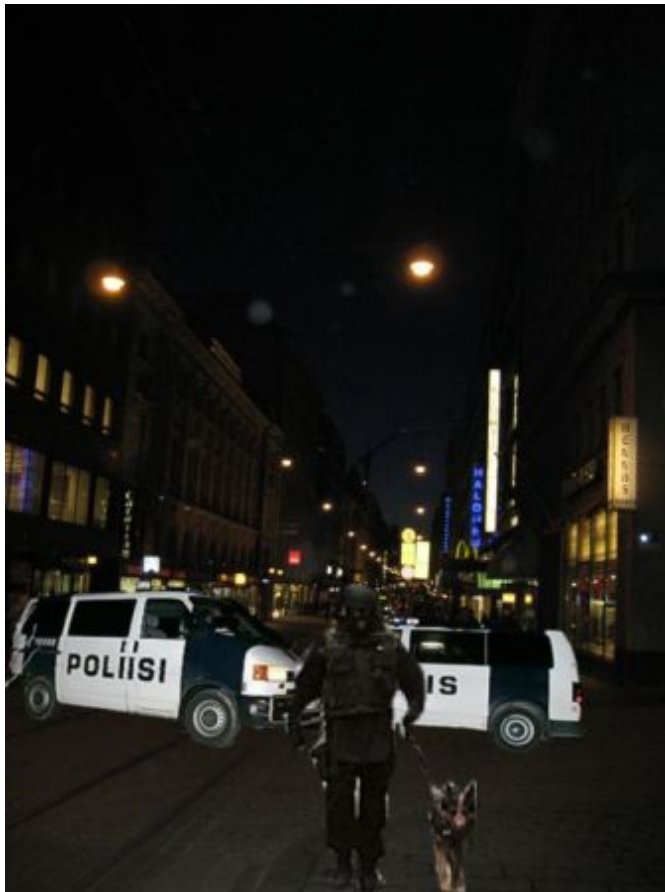
Kuva 22: C6

C-sarjan kuudetta kuvaa pidettiin yleisesti turvattomana tai vältettävänä. Seitsemän diplomaatin mielestä tilanne on turvaton tai pelottava. Pelottavuuden aiheuttajana pidettiin