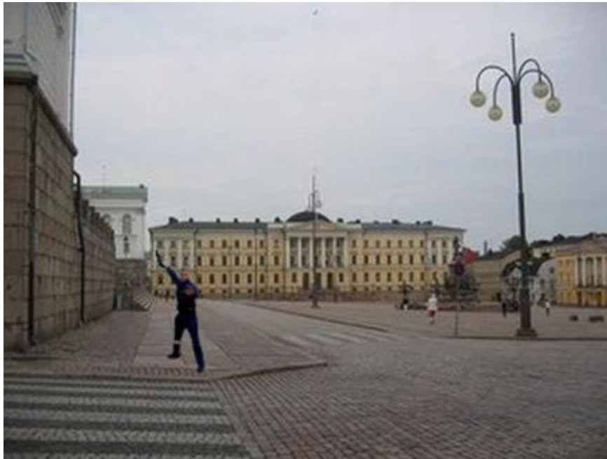
Kuva 5: A5