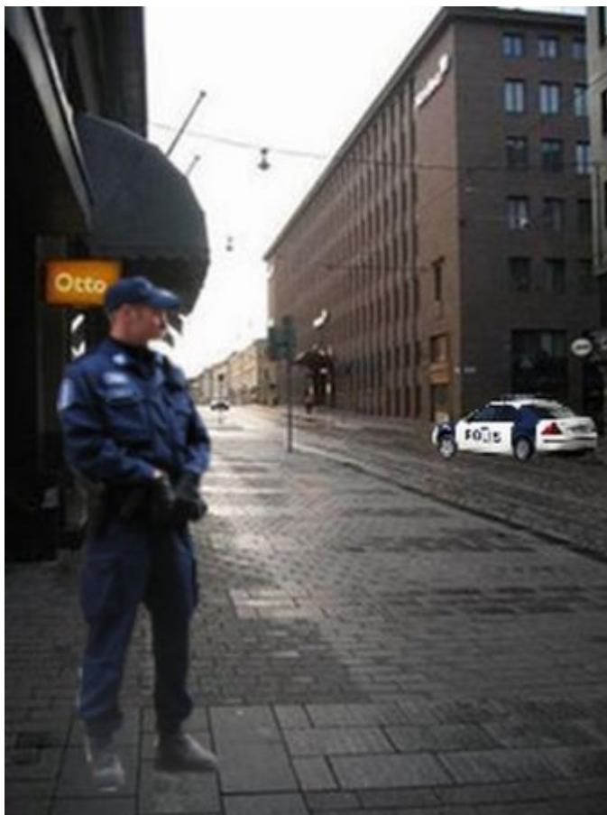
Kuva 13: B3