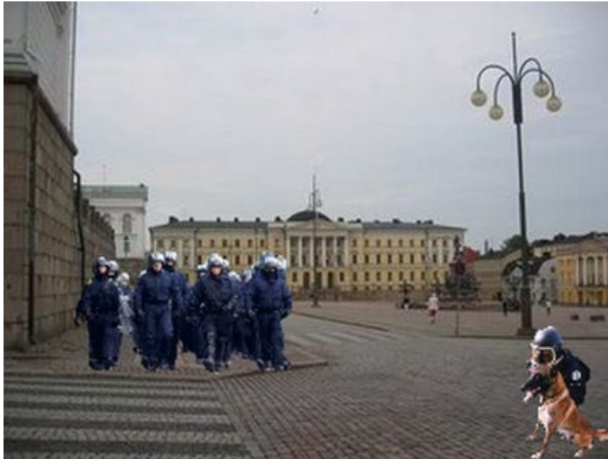
Kuva 9: A9

Viisi diplomaattia kuvaili kuvan tilannetta tai tunnettaan muun muassa seuraavasti: ok, turvallinen, ei pelottava tai ei vaarallinen. Yksi diplomaatti ainoastaan kommentoi, että kuvassa on paljon poliiseja ja ehkä kyseessä on mielenosoitus. Yksi taas kuvaili tilannetta: ”Ihan kuin armeija olisi paikalla.” Yksi diplomaatti vain poistuisi nopeasti paikalta. Loput 10 diplomaattia eli yli puolet kuvaili kuvan tilannetta tai tunnettaan muun muassa seuraavasti: turvaton, varovaisuutta herättävä, huolestuttavampi, vakavampi, pelottavampi, pahempi, vähemmän turvallinen tai turvattomampi kuin edellisen kuvan tilanne. Kolme diplomaattia kommentoi tilannetta vähemmän pelottavaksi tai vähemmän pahaksi edelliseen kuvaan verrattuna, kun taas peräti kahdeksan diplomaattia kommentoi tilannetta huolestuttavammaksi, vakavammaksi, pelottavammaksi, pahemmaksi, vähemmän turvalliseksi tai turvattomammaksi edelliseen kuvaan verrattuna johtuen, ainakin joidenkin kommenttien perusteella, poliisien suuresta määrästä ja mellakkavarusteista.