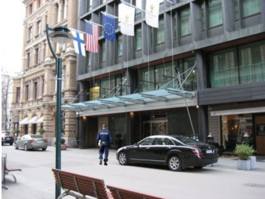
Kuva 23: D1

Kaikki diplomaatit pitivät D-sarjan ensimmäistä kuvaa turvallisena ja normaalina, koska poliisi oli rentona ja oli todennäköistä, että hotellissa oli joku tärkeä vieras. Yhden diplomaatin mielestä parasta turvallisuutta on sellainen, joka ei aiheuta vaivaa.