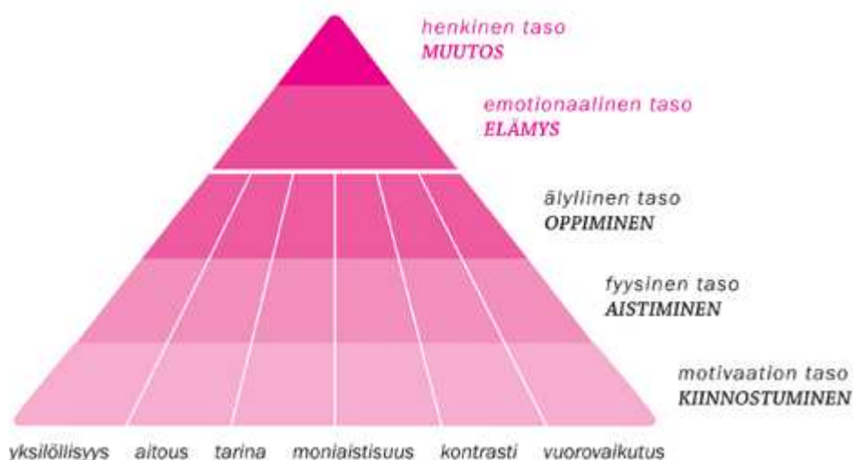
Kuvio 1. Elämyskolmio. (LEO 2009)

Suunniteltaessa toimintaa pääasiassa on perinteisesti ollut itse tekeminen, mutta elämyskolmiomallin avulla voidaan hakea tekemiselle perusteita, ja toisaalta myös tavoitteita. Tavoitteet voidaan myös jakaa eri luokkiin niiden vaikuttavuuden perusteella ja samalla voidaan huomioida yksilöllisesti kaikki toimintaan osallistuvat henkilöt huolimatta siitä, että kokemus on kaikille yksilöllinen.