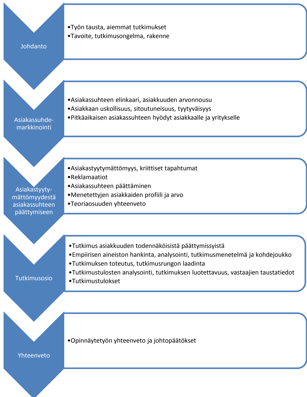
KUVIO 1. Opinnäytetyön rakennekaavio.

Alla olevasta kuviossa 1 on kuvattu tämän opinnäytetyön rakenne pääluvuittain. Opinnäytetyö on jaettu viiteen päälukuun, jotka ovat johdanto, kaksi teoriaosaa, tutkimusosa sekä viimeisenä koko opinnäytetyön yhteenveto.