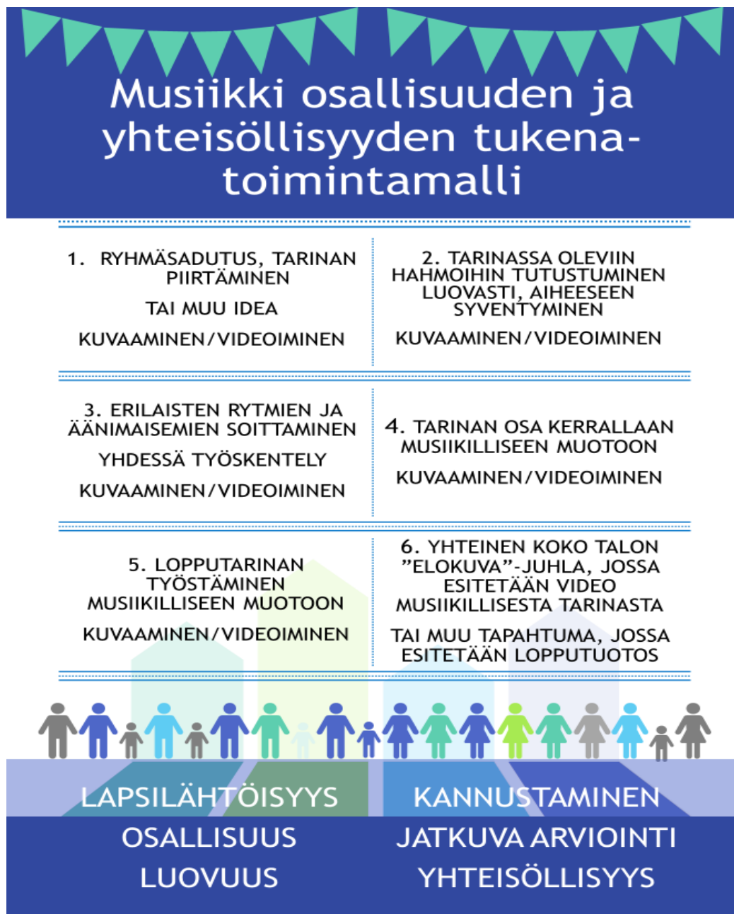
Kuvio 2: Musiikki osallisuuden ja yhteisöllisyyden tukena - toimintamalli

Viimeisellä kerralla pidettiin ”elokuva”-juhlat koko päiväkodin väelle. Tämän tapahtuman olisi voinut korvata myös muunlainen juhla tai tapahtuma, jossa olisi esitelty musiikkikasvatustehkeillä saavutettu lopputuotos. Covid19 aiheutti kuitenkin sen, että tässä tapauksessa musiikkikasvatustehkeiden lopputuotos tehtiin videon muodossa. Videon avulla myös huoltajat pääsivät koronarajoitukset huomioiden näkemään lopputuotoksen ja lasten työskentelyä musiikkikasvatustehkeiden aikana päiväkodissa.