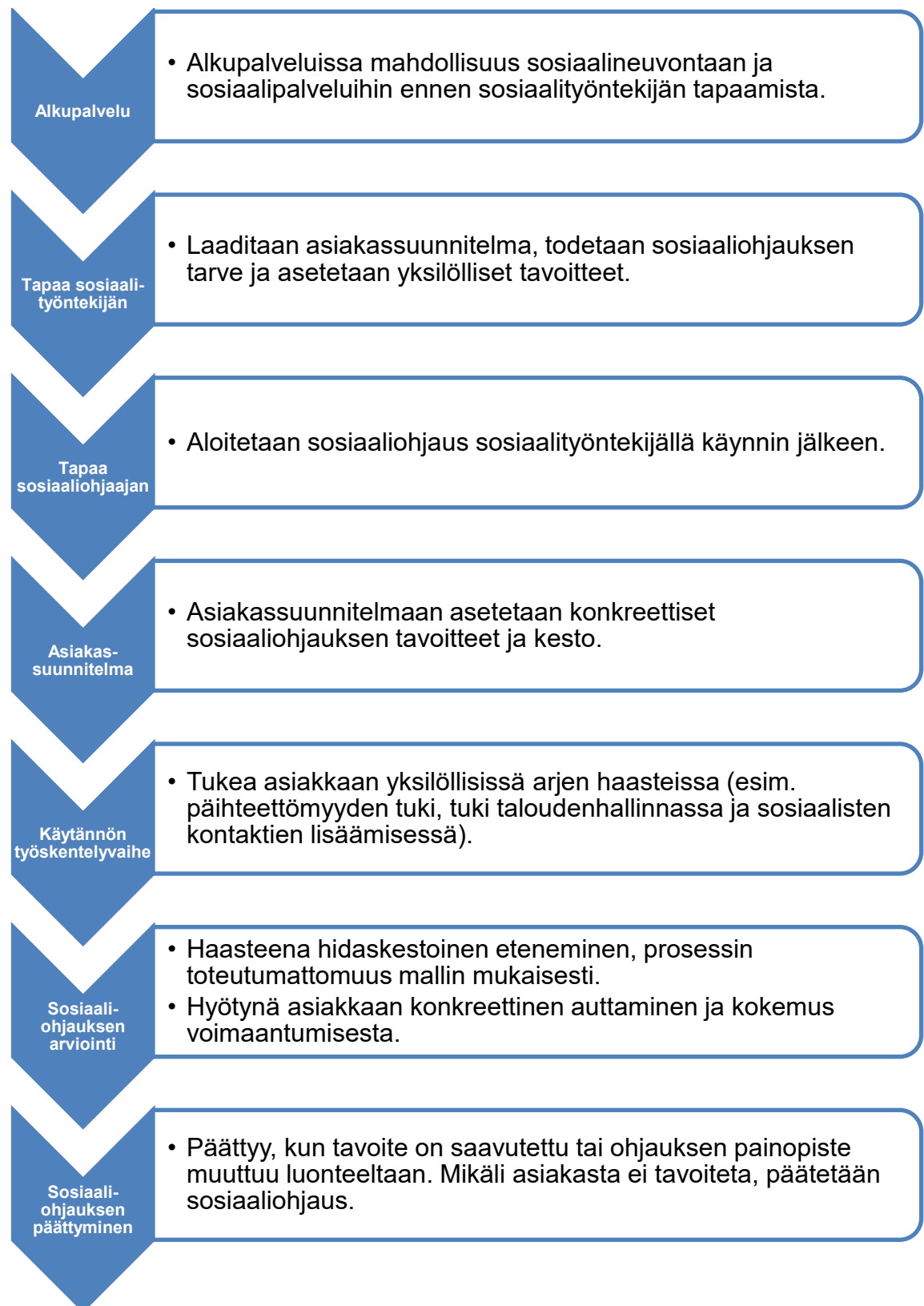
Kuvio 2. Sosiaaliohjauksen prosessin keskeiset vaiheet Turussa